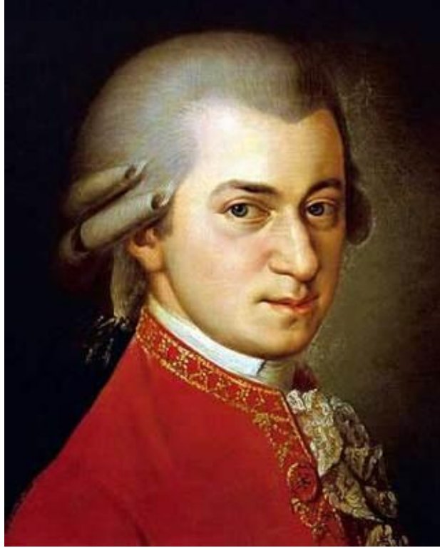
Wolfgang Amadeus Mozart