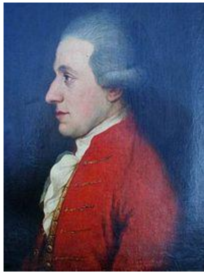
1780'lerin Ortalarında Mozart