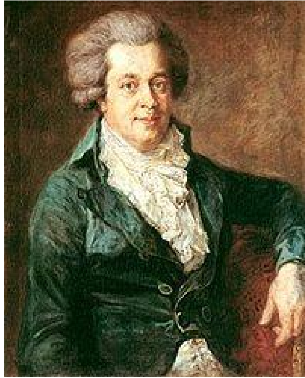
Ölmeden 1 Yıl Önce Mozart