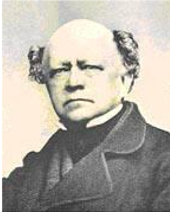
Ludwig von Köchel