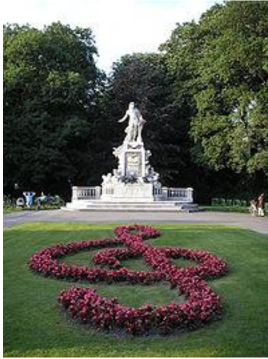
Viyana'daki Mozart Anıtı