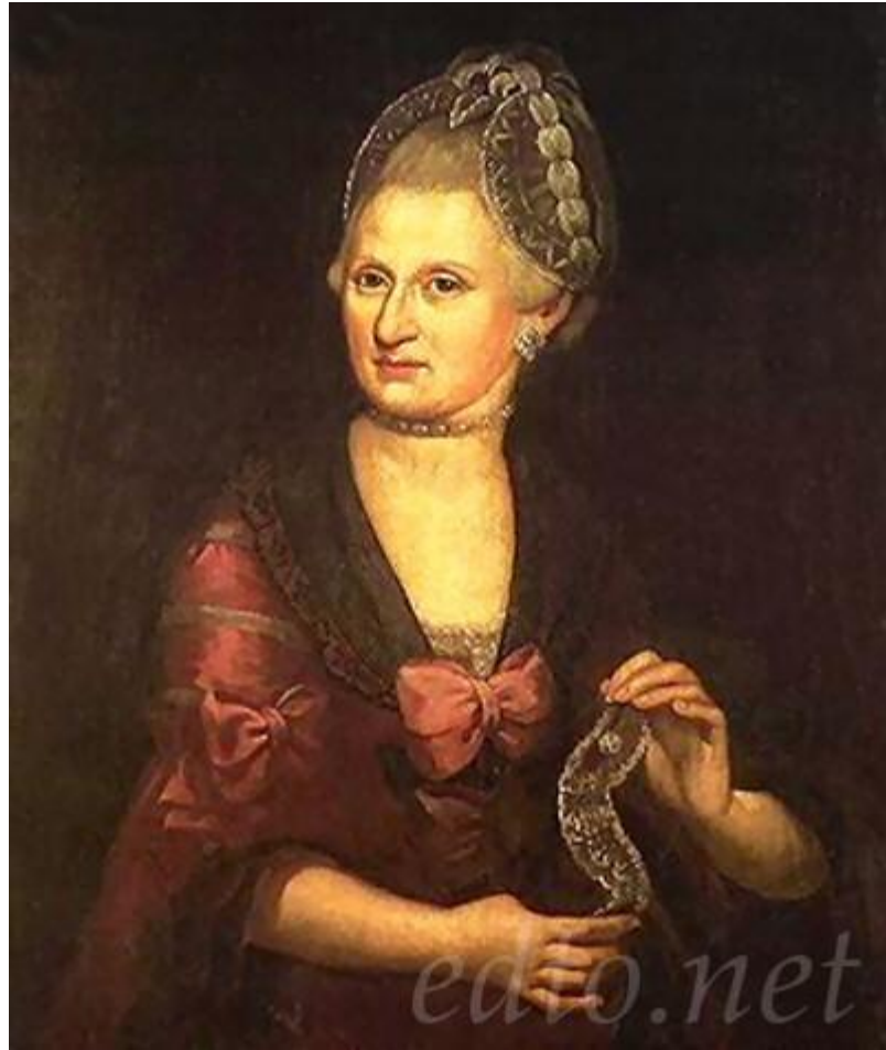
Mozart'ın annesi Anna Maria Petzl Mozart