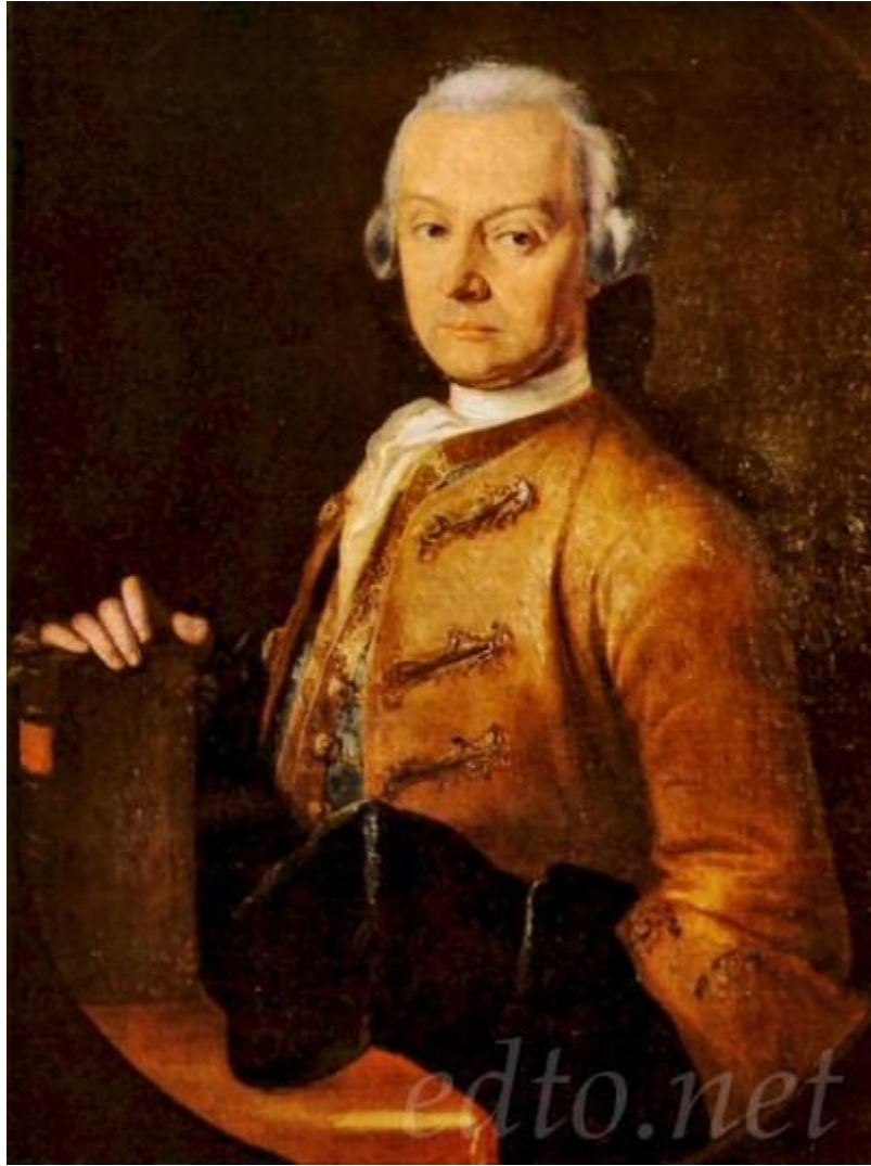
Baba Leopold Mozart