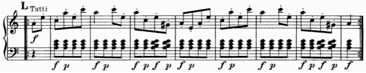
Şekil 3. KV. 219 Keman Konçertosu'nun Üçüncü Bölümündeki Türk Ritimleri

“Mozart için ‘Türk müziği’, Mehter müziğinin yeri göğü inleyen kasırgasıdır” (F. Say, 2000, 103). Mozart Türk temalarını kullanmakla tamamen o dönemin akımına uymuştur (Publig, 2004, 246).