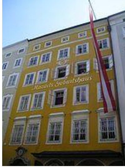
Mozart'ın Doğduğu Ev