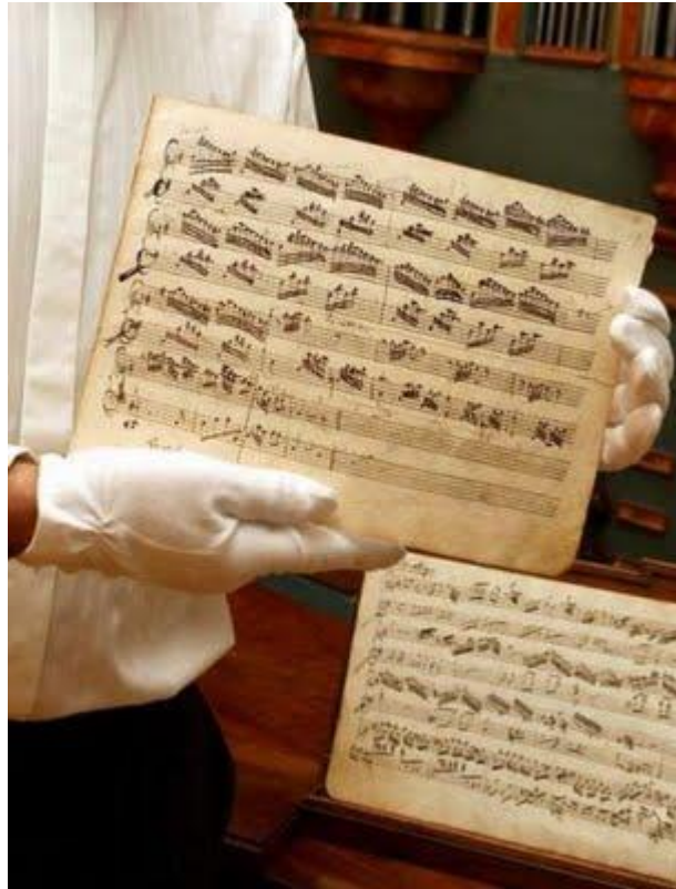
Mozart'ın Keşfedilen Yeni Eserleri