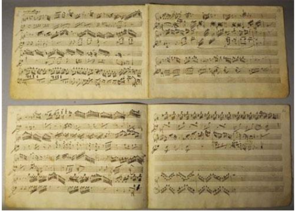
Mozart'ın El Yazısı Nota Örnekleri