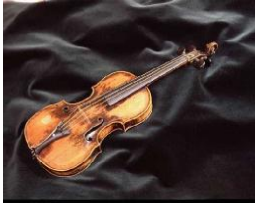
Mozart'ın İlk Kemanı