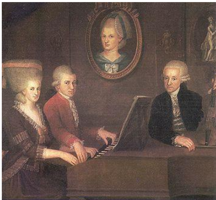
Mozart Ailesi (1780-81)