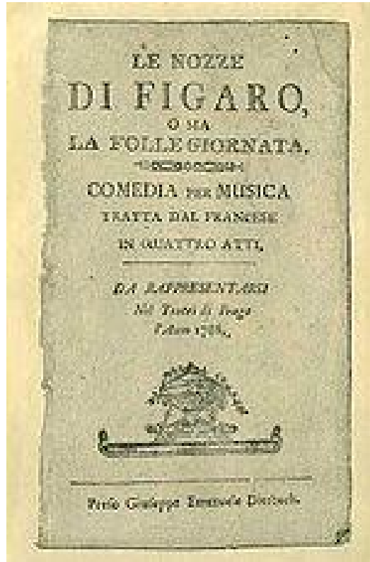
Figaro'nun Düğünü Operasının 1786 Yılındaki İlanı (Prag)