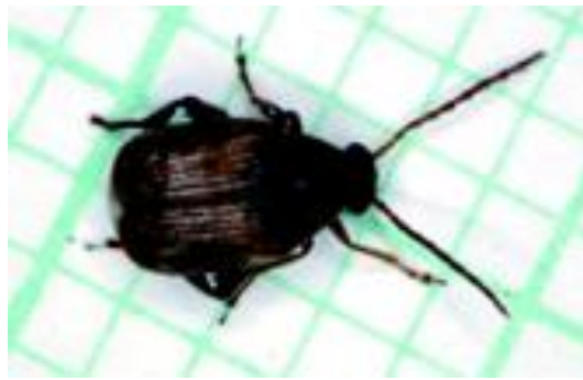
Şekil 2.1. Callosobruchus maculatus (F.) ergini

Uçan ve uçmayan olmak üzere iki formu bulunmaktadır. Uçucu formunun vücudu oval şekillidir ve üzeri kızıl kahve, parlak sarı desenlidir. Uçucu olmayan formunda ise zemin rengi hemen hemen siyahtır ve üzerindeki kıllar gri gibi görünür. Bu formunda ortalama vücut uzunluğu erkekte 2,41mm dişide ise 3,18mm olup uçucu formlarında daha uzundur. Anten halkalarının ilk dördü kızıl, diğerleri siyah renkte, erkeklerde 7. segmenti genişlemiş durumdadır. Yumurta boyu 0,26-0,32 mm., bir ucu daha sivri olmak üzere yuvarlağa yakın kremi beyaz renktedir (Lodos, 1974).