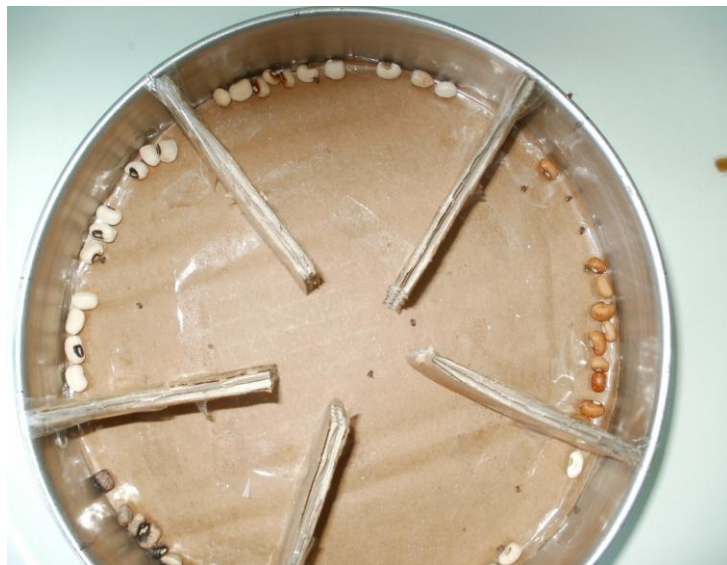
Şekil 3.1. Free-choice test düzeneğinin görünüşü

Çalışmalar Eylül 2010 ile Nisan 2011 tarihleri arasında Bitki Koruma Bölümü Entomoloji Laboratuvarında yürütülmüştür. Erginlerin ayrılması ve yeni kültürlerin oluşturulmasında kademeli eleklerden yararlanılmıştır. Yetiştirme kabı olarak plastik petri kapları kullanılmış ve denemeler iklim kabinde gerçekleştirilmiştir. Free-Choice testi için yuvarlak plastik bir kap kullanılmış ve araları eşit açılı olacak şekilde kartonlarla bölünmüştür (Şekil 3.1).