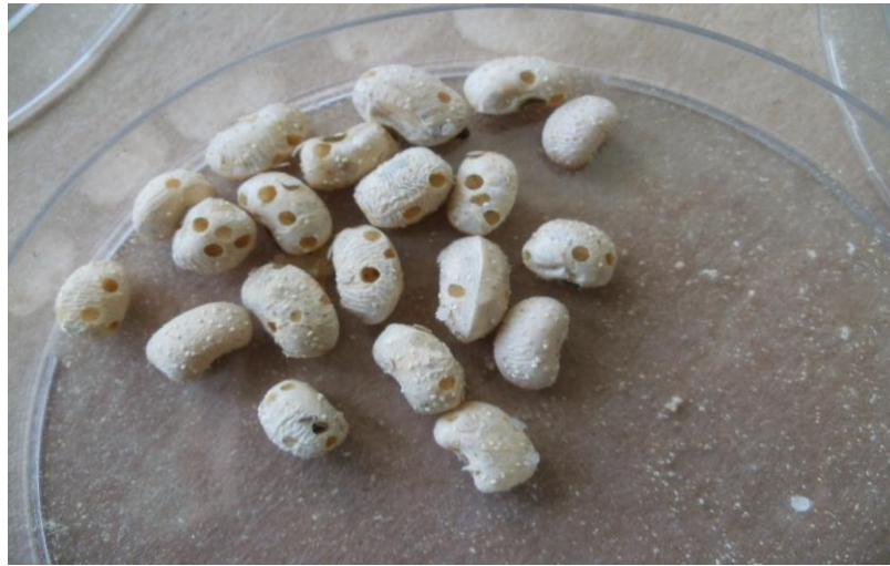
Şekil 2.2. Callosobruchus maculatus 'un börülce tanelerindeki zararı

Callosobruchus maculatus (F.)'un diğer bazı bruchid türleriyle karışık popülasyonlarının bulunduğu depolarda kısa sürede dominant tür haline geldikleri bildirilmektedir (Bokeer,1967). Amevoin ve ark.(2005), yaptığı bir çalışmada C.maculatus ve C. rhodesianus 'un popülasyonlarının birlikte bulunduğu bir depoda C. maculatus 'un dominant hale geldiğini gözlemlemiş ve bunun nedenini C.maculatus 'un ergin diyapozunun olmamasına ve larvalarının yüksek rekabet yeteneğine bağlamıştır.