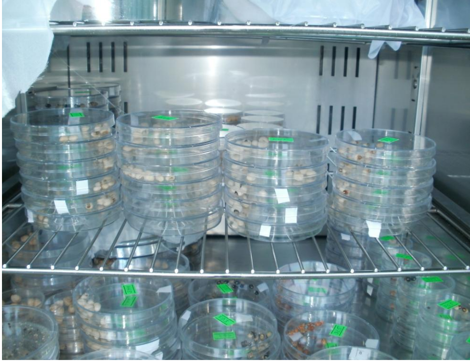
Őekil 3.2. Denemelerin yrtldđ iklim dolabı

Tüm alıřmalar 30\pm 0,5 °C sıcaklık, \%55\pm 5 ortam nemi ve srekli karanlık Őartlardaki iklim kabininde petri kaplarında yrtlmřtr.