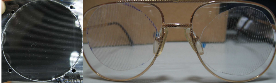
Şekil 1: Fresnel prizması ve gözlüğe uygulanmış hali

Prizma adaptasyon testi Fresnel prizmaları (Şekil 1) kullanılarak yapılmaktadır. Öncelikle hastaların tam refraktif düzeltmeleri yapılmalıdır. Hastalar bir Snellen tablosundaki 6/9 sırasındaki bir harfe 6 m mesafeden, akomodatif bir hedefe de 0.3 m'den bakmalıdırlar ve hastanın öncelikle prizma ile uzak ve yakın açısı ölçülmelidir. Daha sonra hastanın kendi gözlüğüne (refraksiyon kusuru varsa refraktif düzeltmesi yapılmış olan gözlük camına, refraksiyon kusuru yoksa düz cama) tabanı içerde olacak şekilde Fresnel prizmaları yerleştirilir. Hasta uzakta ve yakında akomodatif objeye bakarken alternan prizma örtme-açma testi yapılır. Gözlerde fiksasyon hareketi görülmeyene kadar prizma gücü her 15-30 dk'da bir değiştirilir. Gözde fiksasyon hareketinin olmadığı prizma gücünde hasta en az 2 saat gözünde prizma ile bekletilir ve tekrar ölçüm yapılır. Eğer yeniden kayma ortaya çıkmışsa prizma gücü tekrar artırılarak işleme devam edilir. Hastada prizmaya bağlı diplopi ortaya çıkmışsa hasta 1-2 saat kadar bekletilir ve adapte olmasına çalışılır. Eğer diplopi geçmezse prizma gücü azaltılmalıdır.