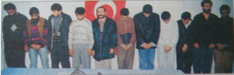
Yeni eylemlere hazırlanırken basıldılar

Gazi Mahallesi olaylarının ardından bir otomobile molotof kokteyli atarak, 2 kadının ölümüne, iki kişinin de yaralanmasına yol açan PKK militanları operasyonla yakalandılar.