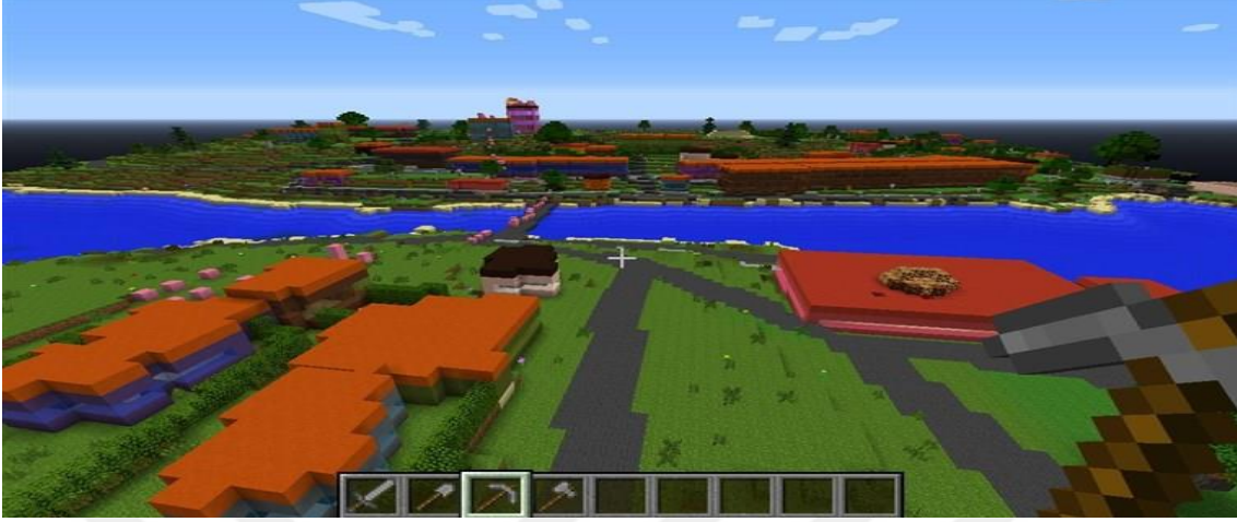
Şekil 4. Minecraft (Nbcnews).

nedenle oyuncular genellikle çok büyük ortak projelerde birlikte çalışmayı seçebilirler (Tüm Danimarka'nın Minecraf ile tekrar oluşturulması projesi, 2014)