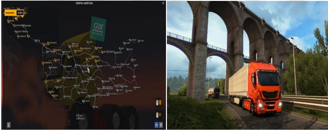
Şekil 5. Euro Truck Simulator 2 (Punktid).

Euro Truck Simulator 2 geniş bir çevreye sahiptir. Oyun dünyasının kuzeyi, batısı ve doğusu ovalar, tepeler, ırmaklarla kaplı iken güneyi ise Alp Dağlarından çok dağlıktır. Oyunda en dağlık yer, İsviçre ve Norveç'tir. Oyunda nerede olursanız olun her yer yeşil, ağaçlarla, bitkilerle kaplıdır. Oyunda mevsim yazdır. Kimi çekicilerde sıcaklık beliriyor. Oyunda kar, dolu gibi hava olayları yoktur. Sadece yağmur vardır ki sıklığı oyuncu tarafından belirlenebiliyor (Vikipedi, 2020a). Sosyal bilgiler dersinde özellikle İnsanlar, Yerler ve Çevreler öğrenme alanı kapsamında yer alan birçok konunun öğretiminde etkili kullanılacak bir oyun.