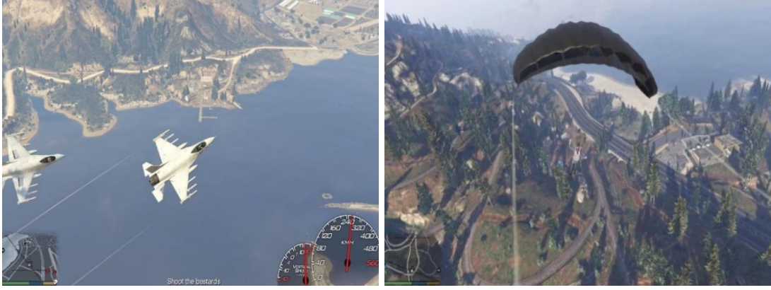
Şekil 10. Grand Theft Auto V (GTA 5)-1.

Oyunda jet ski sürme, uçuş yarışlarına (uçuş okuluna benzer ölçekte uçak yarışmaları) ve off-road yarışmalarına katılma, paraşütle atlayış, akrobasi, yoga, triatlon yapma, tenis oynama ve golf oynama gibi birçok etkinlik mevcuttur. Oyun geniş bir coğrafi alanda geçtiğinden dağlar, nehirler, göller, okyanuslar, askeri üsler, plajlar, tarım arazileri, ormanlar, çöller ve yoğun kentsel ortamlar mevcuttur (Vikipedi, 2020b). Oyunun sahip olduğu zengin içerik sosyal bilgiler dersinde etkili bir ders materyali olarak kullanılabilir. Oyunda Paraşütle atlama veya helikopter sahneleri ile sosyal bilgiler dersi kapsamında öğretilen birçok coğrafi kavram ve olgu (yeryüzü şekilleri, beceri ve doğal faktörler, nüfus ve yerleşme, korki ve ölçek vb.) zevkli biçimde aktarılabilir.