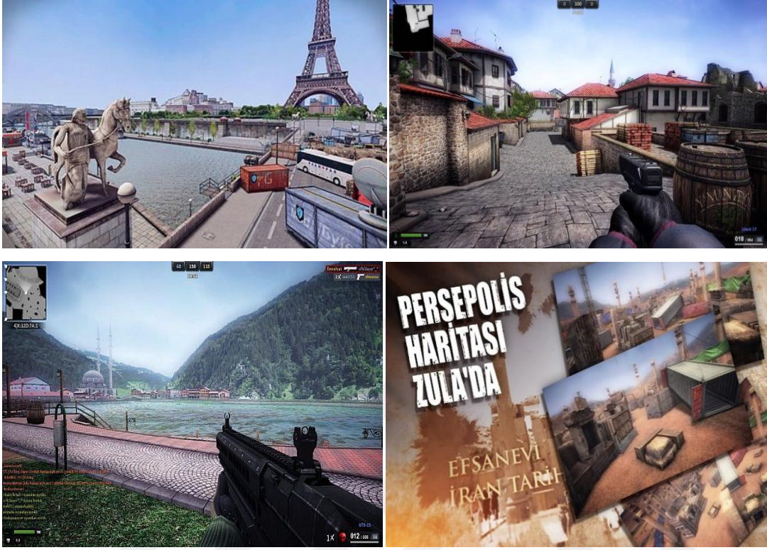
Şekil 7. Zula (Playsultan).

Persapolis, Kuzey Irak, Kıbrıs Açıkları, Paris, Tahran ve Favela (Brezilya) gibi tarihi ve coğrafi mekânlarda geçmektedir.