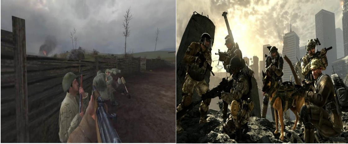
Şekil 6. Call of Duty serisi (Tendanceousset).

serisidir. Modern zamanlara göre kurgulanmış 16 (Call of Duty 4: Modern Warfare, Call of Duty: Modern Warfare 2, Call of Duty: Modern Warfare 3, Call of Duty: Modern Warfare (2019), Call of Duty: Black Ops 2, Call of Duty: Black Ops 3, Call of Duty: Ghosts, Call of Duty: Advanced Warfare, Call of Duty: Infinite Warfare) seriden oluşmaktadır. Bu oyunlar genelde II. Dünya Savaşını, Soğuk Savaş dönemini, hayali bir Üçüncü Dünya Savaşı'nı, Amerika Birleşik Devletleri'ne karşı yapılan terör saldırıları gibi konuları ele almaktadır.