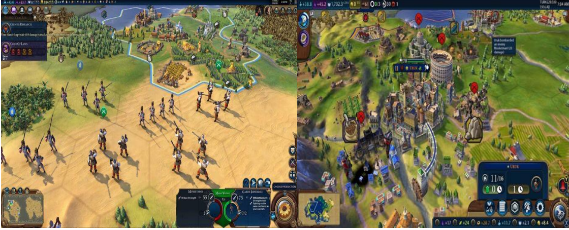
Şekil 9. Civilization serisi (Amazon).

Bu oyunla imparatorluğunuzu harita üzerinde çok geniş bir alana yayabilir, araziden tam olarak istifade eden özel şehirler inşa edebilirsiniz. Sahip olduğunuz medeniyeti daha hızlı ilerletmek ve geliştirmek için yeni kültürler keşfedebilirsiniz.