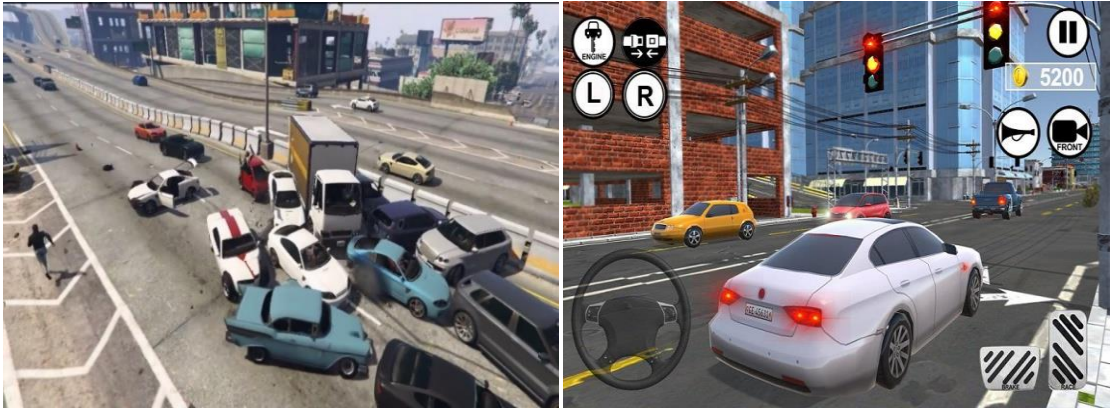
Şekil 11. Grand Theft Auto V (GTA 5)-2 (Google Görseller).

Oyunda jet ski sürme, uçuş yarışlarına (uçuş okuluna benzer ölçekte uçak yarışmaları) ve off-road yarışmalarına katılma, paraşütle atlayış, akrobasi, yoga, triatlon yapma, tenis oynama ve golf oynama gibi birçok etkinlik mevcuttur. Oyun geniş bir coğrafi alanda geçtiğinden dağlar, nehirler, göller, okyanuslar, askeri üsler, plajlar, tarım arazileri, ormanlar, çöller ve yoğun kentsel ortamlar mevcuttur (Vikipedi, 2020b). Oyunun sahip olduğu zengin içerik sosyal bilgiler dersinde etkili bir ders materyali olarak kullanılabilir. Oyunda Paraşütle atlama veya helikopter sahneleri ile sosyal bilgiler dersi kapsamında öğretilen birçok coğrafi kavram ve olgu (yeryüzü şekilleri, beceri ve doğal faktörler, nüfus ve yerleşme, korki ve ölçek vb.) zevkli biçimde aktarılabilir.