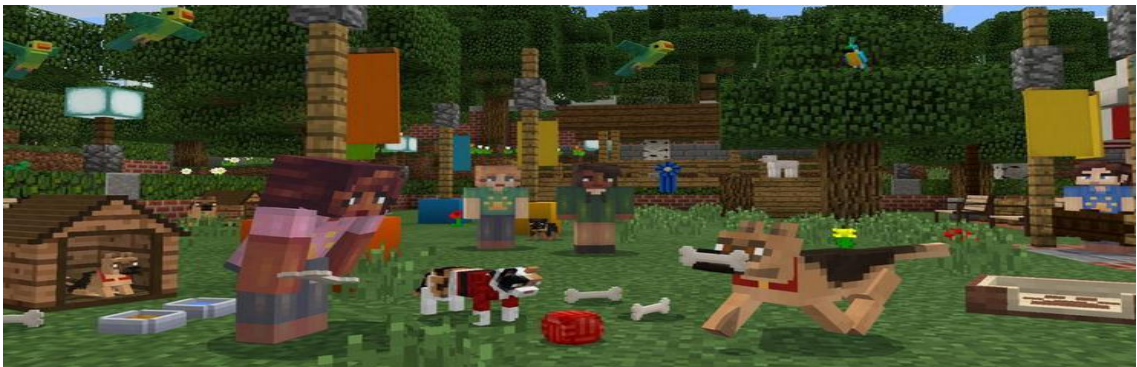
Şekil 3.Minecraft (Store Topia).

Minecraft. Minecraft (Mojang 2011); inşaat, keşif ve hayatta kalma unsurlarına sahip, prosedürel olarak oluşturulmuş bir sandbox (oyuncunun sanal bir dünyayı serbestçe dolaşabildiği video oyunu) türü oyunudur. Tek oyunculu modda, oyuncular dünyayı keşfetmekte ve neredeyse sınırsız sayıda bina, alet ve silah oluşturmak (üretmek) için taş, ahşap ve metal gibi kaynakları (madenini) toplamakta özgürdür.