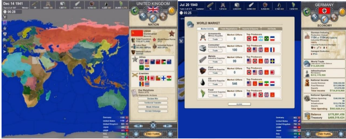
Şekil1. Making History: The Calm & The Storm (Emediaplance).

ABD'nde müfredatında II. Dünya Savaşı konularını bulunduran 150'den fazla okulda konunun öğretiminde kullanılmıştır (Matthew, 2007).