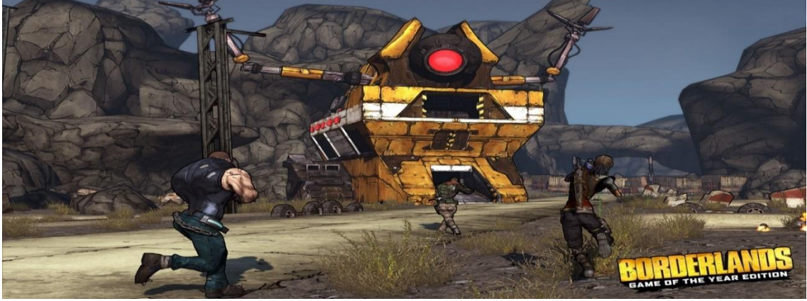
Şekil 2.Borderlands 2 (Gearbox software).

Oyuncuya sunulan, tank benzeri bir "Gunzerker" dan gizli bir suikastçıya kadar çeşitli karakter sınıfları seçimi ile oyun stilleri desteklenir. Bu oyunda vurgu, daha çok işbirliği üzerinedir açıkça rekabet unsuru yoktur. Oyuncular görevlerini tamamladıktan sonra kazandıkları puanlarla karakterlerinin 'seviyesini yükseltebilirler. Bu oyun aracılığıyla öğrencilerde işbirliği içinde hareket etme, strateji geliştirme, problem çözme, yaratıcı düşünme gibi beceriler geliştirilebilir.