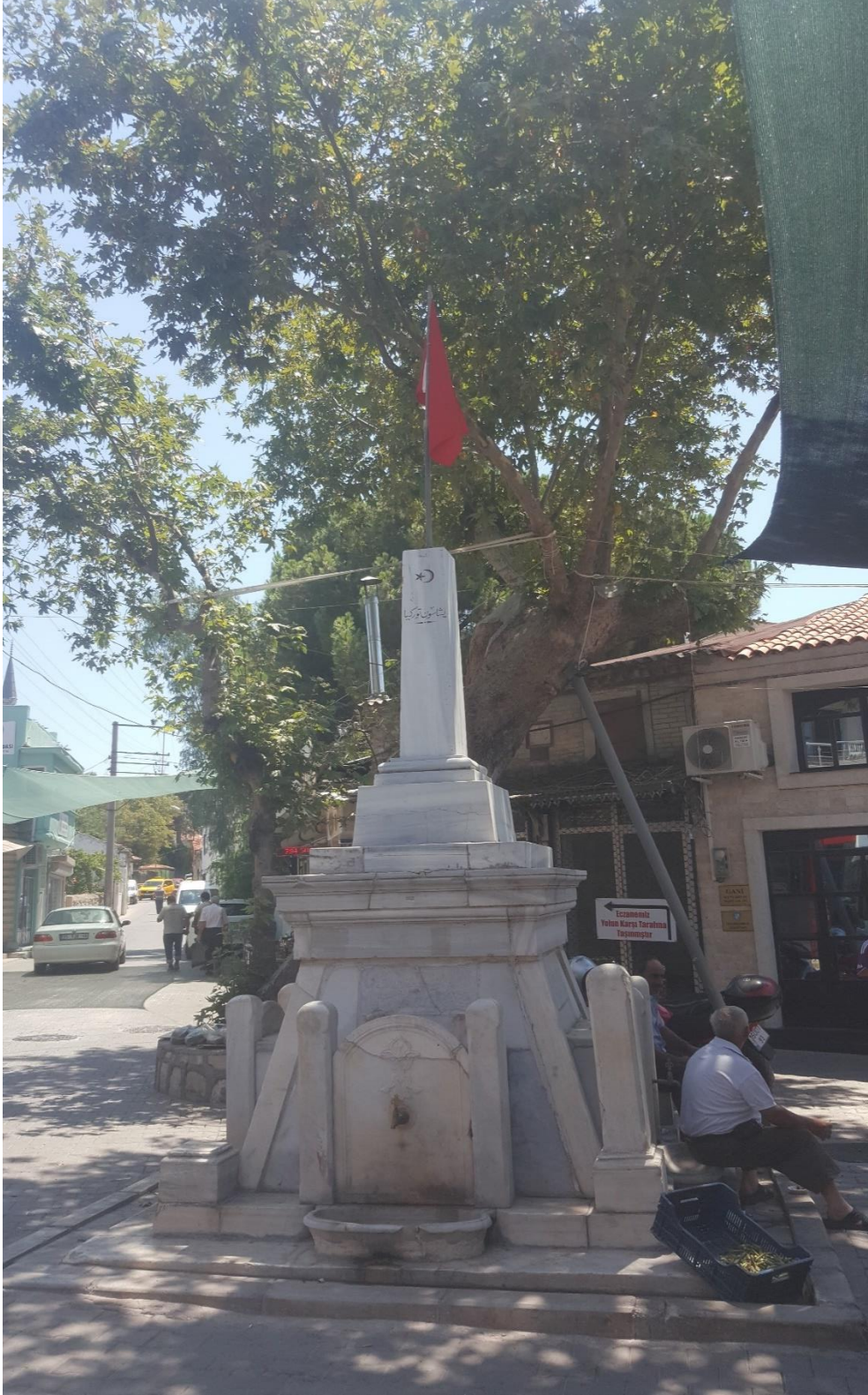
Ek 1: Cumalı'nın Hikâye ve Romanlarında Geçen Urla'nın Eski Şehir Merkezinde Bulunan Ulu Çınar ve Altındaki Cumhuriyet Anıtı