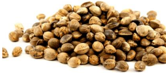
Resim 2.1 Kenevir tohumu görseli (İnt. Kyn. 2).

X ve Y olan cinsiyet kromozomları, bitkilerin cinsiyetlerinin belirlenmesinde kullanılan yöntem olarak belirtilmiştir. Dişi bitkilerde iki X kromozomu, erkek bitkilerde bir X kromozomu ile bir Y kromozomu var olup Y kromozomunun; X kromozomu ve otozomlardan daha büyük olduğu bildirilmiştir. X ve Y kromozomları kenevir için cinsiyet belirleyici genler taşıırken, otozomlar ise kenevirin cinsiyet tespitiyle ilgili bir alakasının olmadığı belirtilmiştir (Sakamoto vd. 1995).