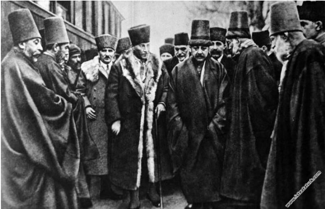
Ek 8: Mustafa Kemal Paşa Konya Mevlana Türbesinde (21 Şubat 1931)