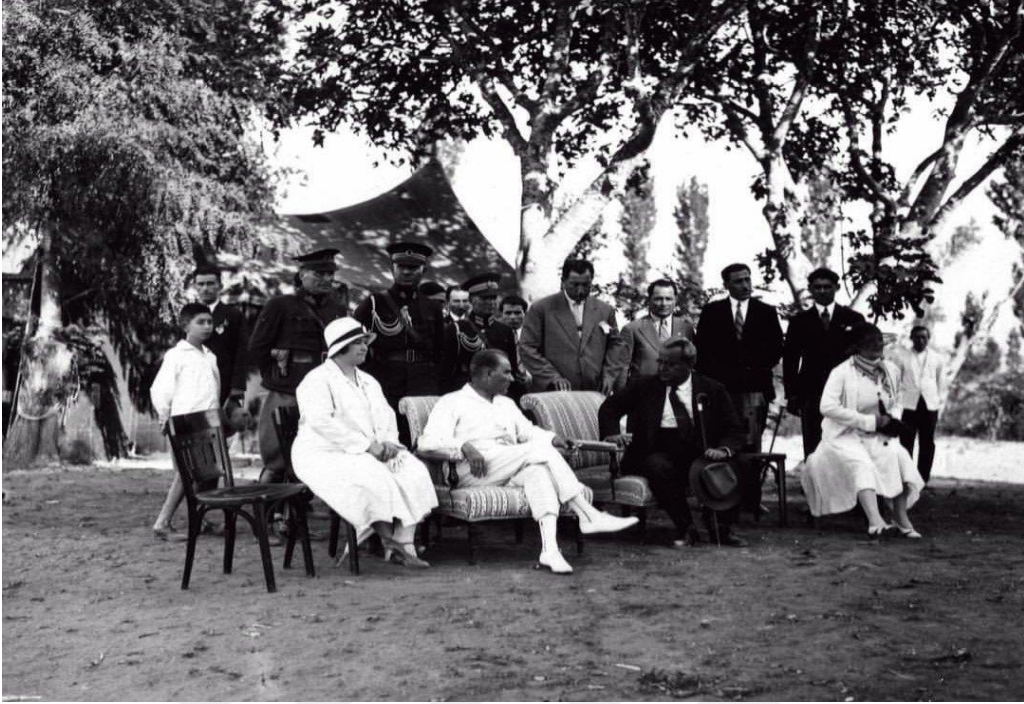
Ek 5: Mustafa Kemal Paşa Yalova'da (8 Ağustos 1930)