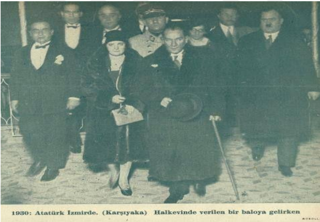
Ek 6: Mustafa Kemal Paşa İzmir'de (1 Mart 1930)