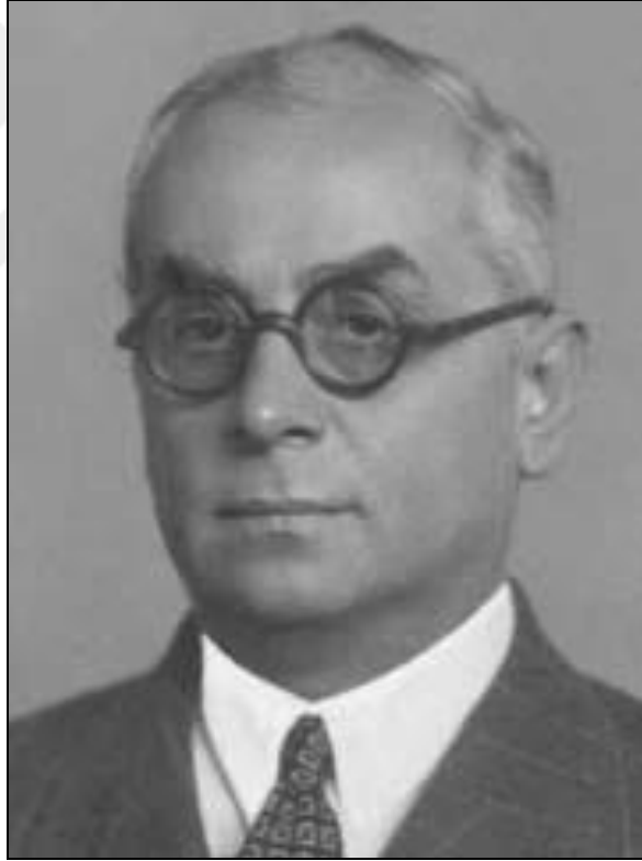
Şekil 2.1: Celal Bayar