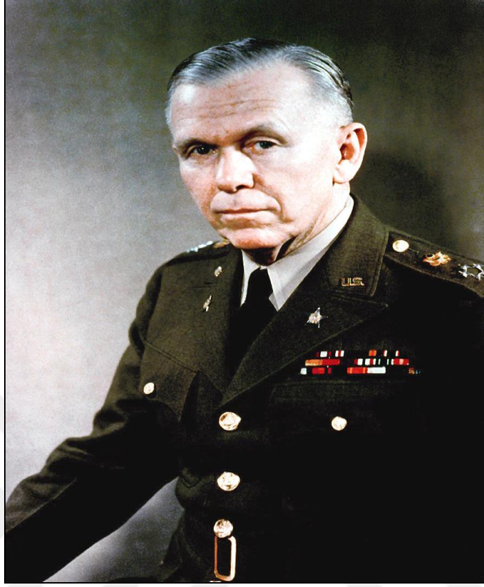
Şekil 1.3: Marshall