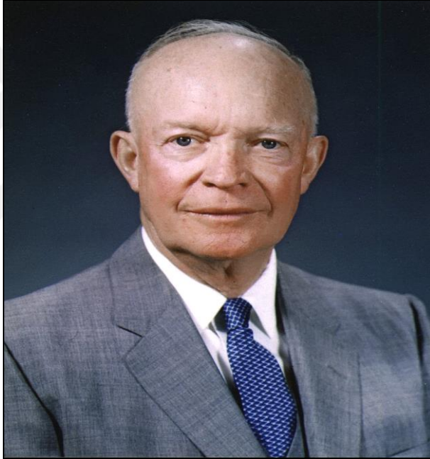
Şekil 2.5: Dwight D. Eisenhower

Kaynak: www.wikipedia.org , [erişim tarihi 4 Mart 2020].