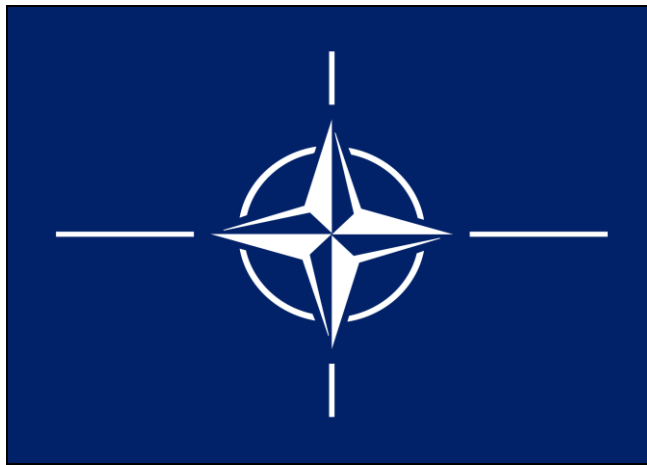
Şekil 1.4: NATO İşareti