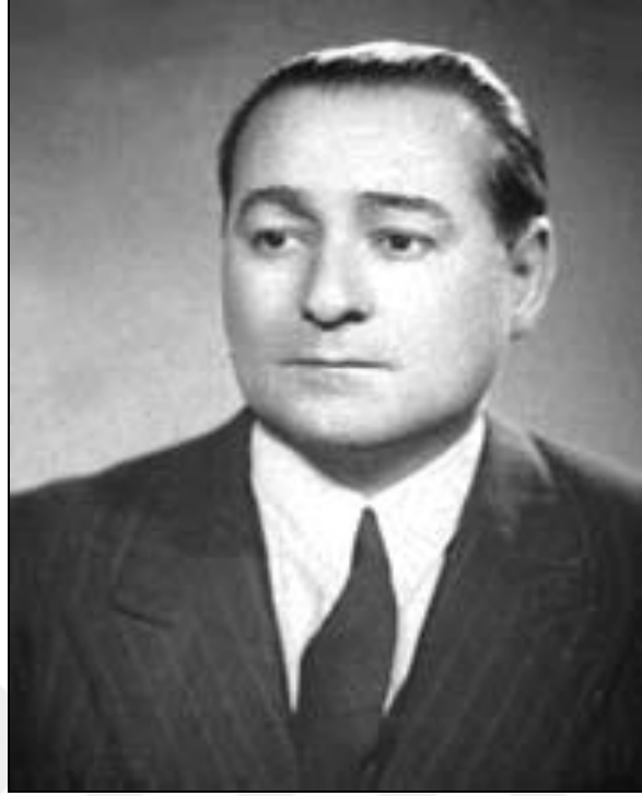
Şekil 2.2: Adnan Menderes