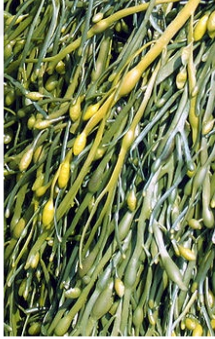
Şekil 3.4. Ascophyllum nodosum görüntüsü

Ascophyllum cinsi Fucacea familyasına ait büyük, yaygın kahverengi algdir . Ascophyllum nodosum 'un uzun, sert ve kösele yaprakları vardır (Bunker ve ark., 2017). Düzensiz olarak ikiye bölünmüş görüntüye sahip, büyük, yumurta şeklinde hava kesecikleri, yapraklar boyunca düzenli aralıklarla dizilidir ve saplı değildir (Newton, 1931). Yapraklar 2m uzunluğa ulaşabilir. Yapraklar zeytin yeşili (Harvey, 1841) veya zeytin-kahverengi renkte ve biraz sıkıştırılmış, ancak orta damarı yoktur (Hiscock, 1979). Ascophyllum nodosum , aljinalarda, gübrelerde ve hayvan ve insan tüketimi için deniz yosunu unu üretiminde kullanılmak üzere hasat edilir. Hem makro besinleri (N, P ve K) hem de mikro besinleri (Ca, Mg, S, Mn, Cu, Fe, Zn, vb.) aynı zamanda sitokininler ve oksin benzeri hormonları içerir. Ascophyllum nodosum görüntüsü Şekil 3.4'te verilmiştir.