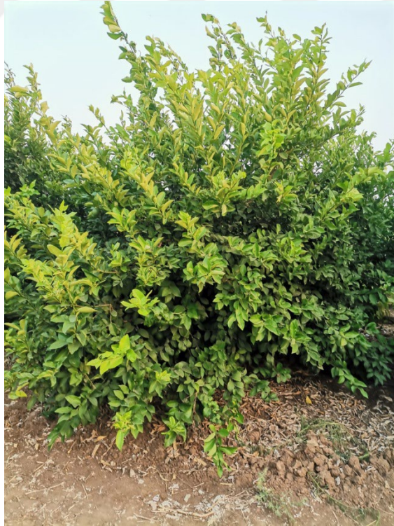
Şekil 3.2. Meyer limonunda genel görünüm

Limonda erkencilik yaz aylarında fiyatların giderek yükselmesi nedeniyle son 10 yılda daha da önem kazanmış bir husustur. Bu önemin bir neticesi olarak Interdonato çeşidi ile yapılan üretime ilave olarak Meyer çeşidi ile üretim ciddi bir yükseliş göstermektedir. Mevcutların ötesinde daha da erken hasat edilebilecek çeşitlerin üretime girmesi limon tarımını daha iyi noktalara taşımak açısından önem arz etmektedir. Üretimde verimin daha yukarılara taşınması limon çerçevesinde gelişen üretim ve pazarlama ağının daha sürdürülebilir bir yapıya dönüşmesinin kilidi konumundadır (Budak ve ark. 2016). Meyer limon çeşidi ağacının genel görünümü Şekil 3.2’de ve meyve görünümü de Şekil 3.3’te verilmiştir.