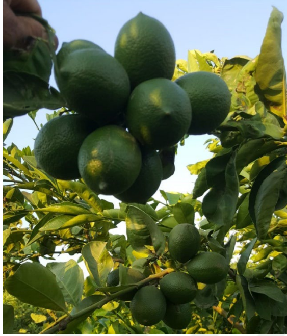
Şekil 3.3. Meyve görünümü