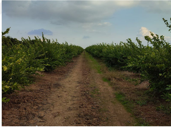
Şekil 3.1. Deneme parselinin genel görünümü