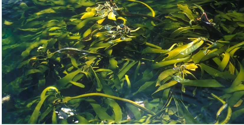
Şekil 3.5. Ecklonia maxima görüntüsü

öneme sahiptir (Andersan ve ark., 2006; Robertsan ve ark., 2006). Ecklonia maxima görüntüsü Şekil 3.5’de verilmiştir.