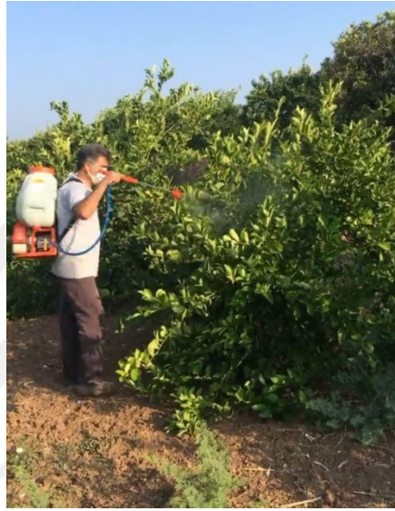
Şekil 3.6. Deniz yosunu uygulamaları yaparken görüntü

Deneme alanı tesadüf parselleri deneme deseninde olup; her uygulamada 10 tekerrür her tekerrürde 10 ağaç bulunmaktadır. Meyer için derim zamanı Ağustos sonu-Eylül başı olarak alınmış ve derilen meyveler tesadüfe bağlı olarak, hastaliksız ve yarasız olanlardan 25 meyve alınarak Özsan ve Bahçecioglu (1970)'na göre pomolojik analizleri yapılmıştır.