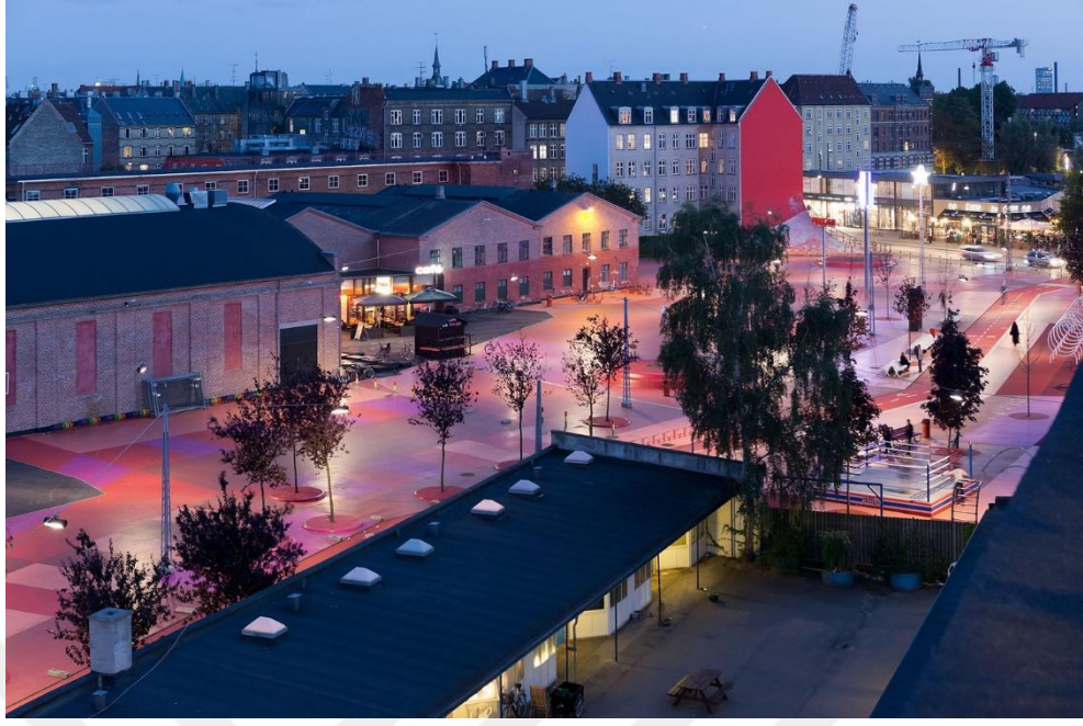
Görsel 2.5. BIG tarafından tasarlanan Superkilen Fotoğraf: Iwan Baan (http-14)

Mostafavi'ye göre (2017, s. 14) kentin devamlı mücadele halinde ele alınması alternatif demokrasi biçimlerinin aranması ile benzer özellik gösterir. Aynı zamanda kentin fiziksel ve kamusal alanlarının, kentliler arasında kültürel ve duygusal alışverişi sağlayan, farklılıkları ve anlaşmazlıkları barındıran, kentlinin öteki ya da diğer bir deyişle yabancı olan ile etkileşimini artıran ve sonuç itibariyle çoğulcu bir toplumu destekleyen bir gücü olduğunu düşünür. Benzer bir yaklaşımla barınma, ulaşım ve altyapı gibi temel ihtiyaçlara yönelik hizmetlerin toplumun her kesimine kolaylıkla ulaşamaması ise çoğulcu demokrasinin sağlanamadığının bir göstergesi olarak ele alınır (Mostafavi, 2017, s. 13).