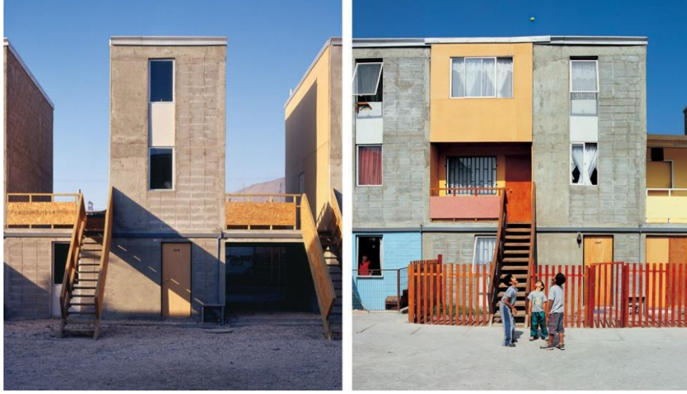
Görsel 2.8. Alejandro Aravena'nın Quinta Monroy sosyal konut projesi (tamamlanmamış durum ile kullanıma bağlı geliştirilen durum karşılaştırması)

Tip-biçimler ise farklı koşullarda farklı şekiller alan, varyasyonlara imkân tanıyan kentsel biçimler olarak tanımlanabilir (Sennett, 2019, s. 231). Tip-biçimler her şeyin noktası noktasına belirlenerek tasarlanan projelere karşıt bir fikir barındırır. Örneğin, yapılarda ihtiyaçtan fazla bırakılan elektrik ve sıhhi tesisat çıkışları, yapının daha sonra yeni bir varyasyona uyumunu kolaylaştırırken ihtiyaca göre yapılan tasarım gelişime kapalı, sınırları belirlenmiş bir kullanım deneyimi sunar (Sennett, 2019, ss. 232-233). Sennett (2019, s. 233), kabuk ve tip-biçim arasındaki ince nüansı salyangoz örneği ile açıklar: salyangozun kabuğu, kabuğu tariflerken, salyangozun kendisi değişime açık haldeki tip-biçimi simgeler. Bununla birlikte Sennett (2019, s. 233) prototip ile tip-biçim arasındaki farkı da vurgular. Prototip tamamlanmış bir nesneyi tanımlarken, tip-biçim henüz gerçekleştirilmemiş biçimlerin bir parçasını tanımlar. Bir nesnenin, bir binanın, bir mahallenin zaman içinde ihtiyacının değişebileceğine dikkat çeken Sennett, böyle bir durumda tip-biçimin kritik rol oynayabileceğini düşünür (2019, s. 235).