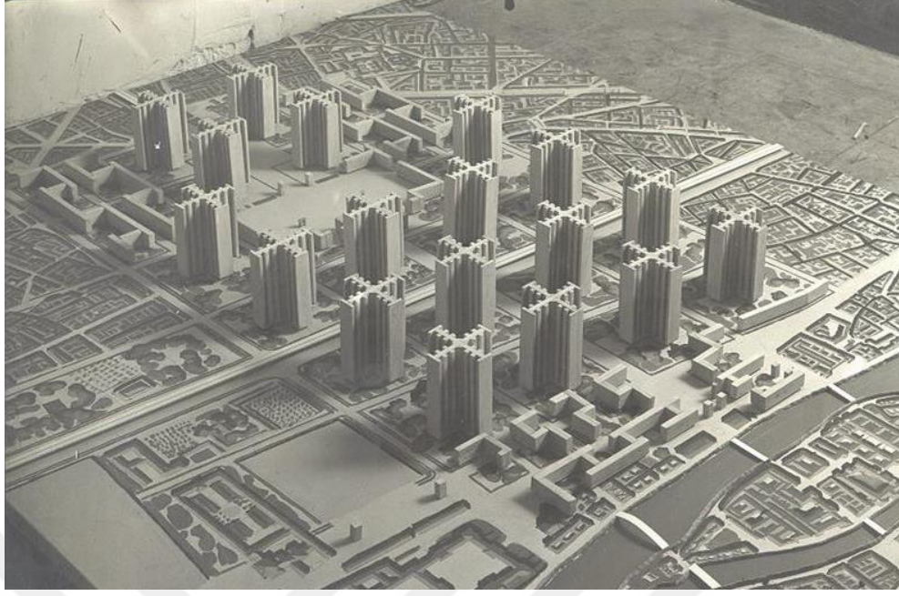
Görsel 2.6. Le Corbusier'in Paris için önerdiği "Plan Voisin" tasarımı (1925) ( http-15 )

Papa Sixtus V Roma'da, şehrin yedi hac bölgesini düz sokaklarla birbirine bağlamak ve hacıları yönlendirmek üzere ünlem işareti görevi gören dikilitaşı kullanmıştır. Fakat 19. yüzyılda şehrin geneline hâkim olan anıtsal şehircilik yaklaşımı anıtların yönlendirme aracı olarak işlevini azaltmış, sanayi döneminde kamusal alanlara konulmak üzere benzer heykellerin ihracat için üretilmesiyle ise anıtsal işaretin ritüel veya yönlendirme amacı taşıyan anlamı salt görsel bir amaç taşıyan dekorlara indirgenmiştir (Sennett, 2019, ss. 212-213).