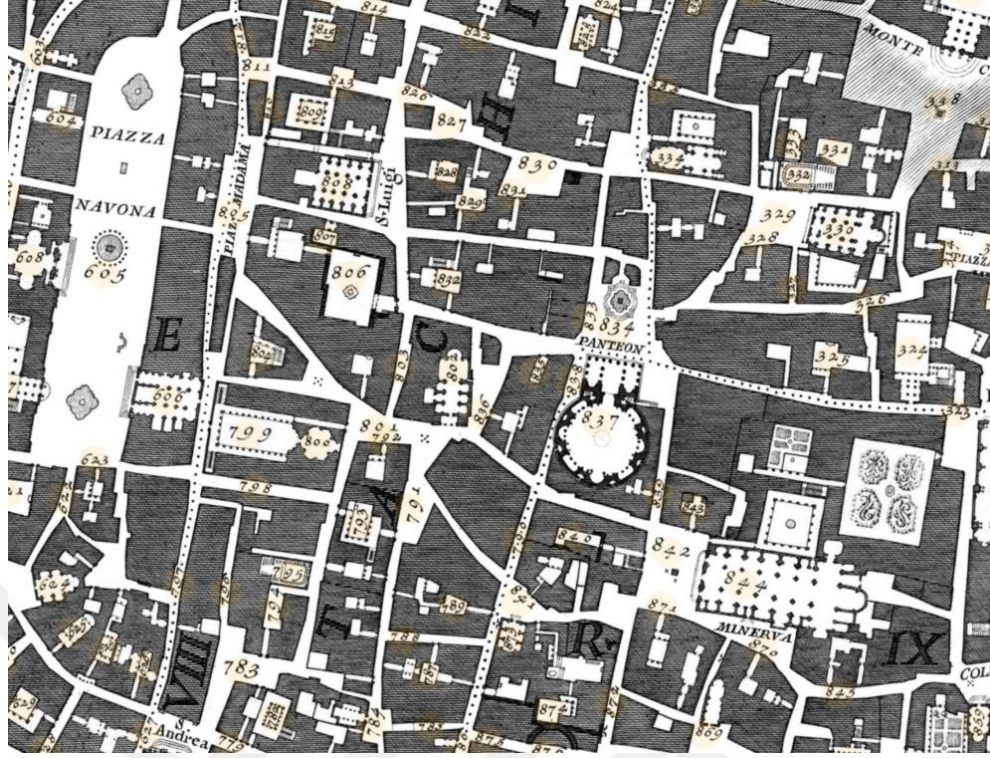
Görsel 2.7. Nolli'nin Büyük Roma Planı'ndan bir kesit (La Pianta Grande di Roma) (1748) ( http-16 )