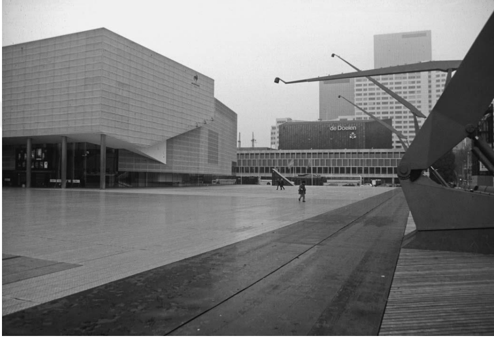
Görsel 2.4. West 8 tarafından tasarlanan Rotterdam Schouwburgplein (Canniffe, 2006, s. 159)

temsil edildiğini öne sürer. Aynı zamanda, kentsel kamusal alanın, bireyleri bir araya getiren, topluluk duygusunu pekiştiren bir güce sahip oluşunun altını çizer (Canniffe, 2006, s. 88). Canniffe'in bu bağlamda dikkat çektiği Rotterdam Schouwburgplein (tiyatro meydanı) (Görsel 2.4.), farklı kullanıcılar için tasarlanmış kamusal bir kent mekânı olarak ele alınabilir. Burada mekân, liman tasarımının bir parçası olarak farklı kullanıcılara yönelik tasarlanmış ve mağazalar, tiyatro ve konser salonu tarafından çevrelenmiştir.