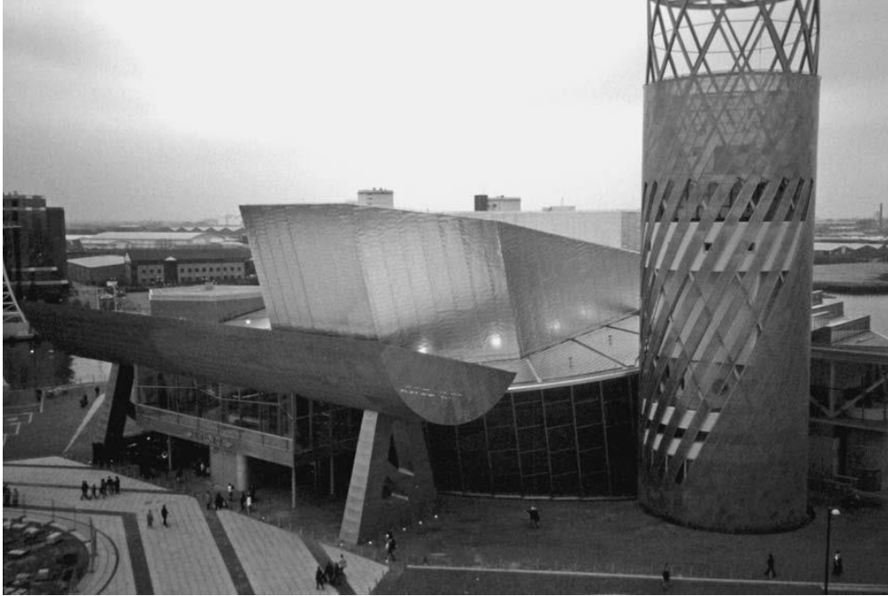
Görsel 2.3. Michael Wilford ve James Stirling tarafından tasarlanan The Lowry Kültür Merkezi (Canniffe, 2006, s. 144)