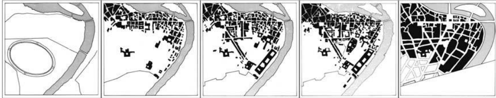
Görsel 2.2. Trastevere'nin yaklaşık iki bin yıl içerisindeki örüntüsel değişimi (Canniffe, 2006, s. 97)

Örüntüler ( patterns ): Kentin mekânları, anıtları ve anlatıları arasındaki düzenini tanımlayan kentsel örüntü, kent tasarımının temel bir unsurudur (Canniffe, 2006, s. 80). Kentin ikili bir koda (dolu-boş) indirgenmiş temsili olan kent örüntüsü, kentin inşa edilmiş alanlarının, boşluklarının, kamusal alanlarının ve kentin yayılımının anlaşılması açısından iki boyutlu veriden fazlasını içermektedir. Canniffe bu durumun spesifik bir örneği olarak Roma'da yer alan Trastevere bölgesini gösterir (Görsel 2.2.). Burada, bölgenin iki bin yıllık süreç içindeki evrimi, kentin fiziksel çevresine yönelik bir veri sunarken aynı zamanda sosyal yaşama dair verileri de barındırır (Canniffe, 2006, ss. 96-97).