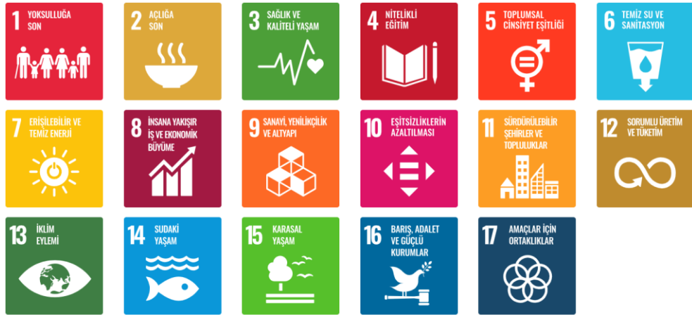
Görsel 2.1. Sürdürülebilir kalkınma amaçları ( http-7 )

2030 yılına kadar gerçekleştirilmek üzere Gündem 2030: BM Sürdürülebilir Kalkınma Amaçları olarak adlandırılan 17 amaç (Görsel 2.1.) belirlemiştir ( http-6 ). Bu hedeflere yönelik her yıl Birleşmiş Milletler tarafından yayınlanan raporların 2022 yılına ait sonuncusu ise, Covid-19 pandemisi, Ukrayna'daki savaş ve bunları izleyen krizlerin 2030 Sürdürülebilir Kalkınma Gündemi'ni ve insanlığın kendi varlığını sürdürmesini tehlikeye attığının altını çizmiş; aynı zamanda, yoksulluk ve açlığın ortadan kaldırılması, sağlık ve eğitimin iyileştirilmesi, temel hizmetlerin sağlanması ve başka pek çok konuda yıllardır kaydedilen gelişmenin tersine döndüğünü belirterek durumun vahametini gözler önüne sermiştir (United Nations, 2022). Bütün bu gelişmeler birlikte değerlendirildiğinde, kentlerin bu tür bir olumsuz senaryo karşısında dayanıklılığını korumak ve sürdürülebilirliğini sağlamak adına güncel bir yaklaşıma ihtiyaç duyduğu görülmektedir. Bu ihtiyaca yönelik ortaya çıkan kent etiği kavramının kentlere yönelik çağdaş etik bir ihtiyaca cevap verme amacı taşıdığını; kentlerdeki mevcut sorunların etik bir perspektif ile irdelenmesinin ise çeşitli çözümleri ortaya çıkaracağını söylemek mümkündür. Bir sonraki kısımda kavrama ilişkin farklı yaklaşımlar detaylıca ele alınmıştır. Söz konusu güncel yaklaşımların sunduğu ölçütler ve alt kavramlar, kentlerin etik değerlendirilmesinin mümkün olduğunu göstermektedir.