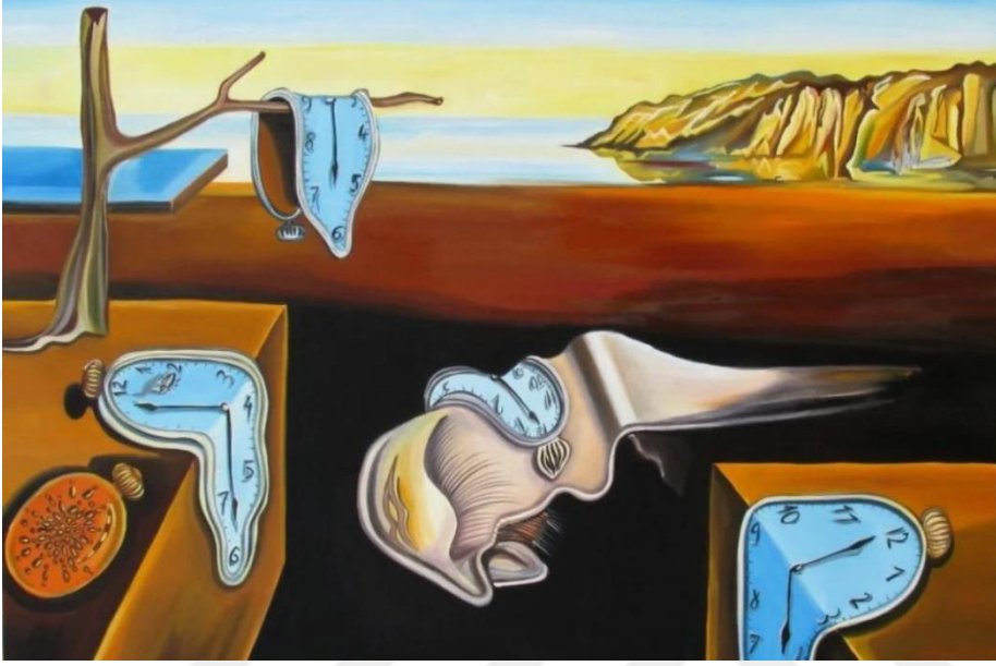
Şekil 2.4 Salvador Dali, Belleğin Azmi, 1931, Yağlıboya, 24 x 33 cm, Çağdaş Sanat Müzesi New York (Dali, 1931)

derinlemesine etkilerde bulunmuştur. Sürrealist akımın, 20. yüzyılın zorlu dönemlerinden biri olarak kabul edilen dönemde ortaya çıkmasının tesadüf olmadığı görülmektedir. İnsanların benlik duygusunu kaybetme noktasına geldiği travmaların bilinçaltındaki yankılarına odaklanması, sürrealizmi sanat dünyasında özel bir konuma taşımaktadır (Antmen, 2008, s. 133-138).