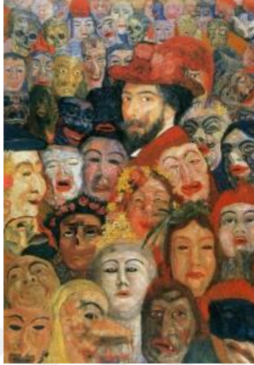
Şekil 2.2 James Ensor, Maskeler ile Otoportre, 1899, Tuval üzerine yağlı boya, 120 x 180 cm (Ensor, 1899)

Eserlerinde toplumun yaşam tarzını gösterirken maskeleri kullanarak yeni bir yaklaşım geliştirmiş ve aynı zamanda toplumsal süreçlere alaycı bir eleştiri sunmuştur. Düşsel semboller ve gizlenmiş figürler, modern insanın içine düşmüş çatışmayı ifade etmektedir (Nezir, 2010, s. 62).