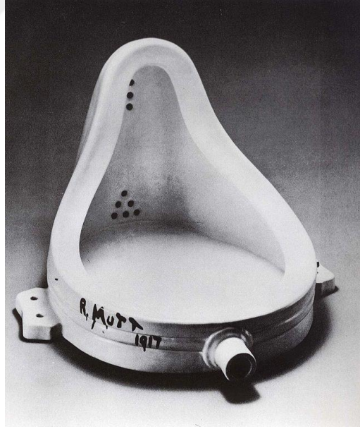
Şekil 2.3 Marchel Duchamp, Çeşme, 1913, Fotoğraf (Çeşme, 1913)

Dadaizm, geleneksel sanata karşı olan estetik durumları, rastlantısallık sonucu oluşan olayları, kuralların olmayışını savunan; ve var olan sanat, savaş, toplum, gelenek, din ve ahlaki değerleri reddeden ve bunları hafife alan bir akımdır. Dadaizm, yaratıcı ve soyut sanatı canlandırma, yeniden hareket kazandırma arayışı içindedir. Dadaistlere göre, Dada bir sanat akımı değil özellikle sanata karşı duran bir kavramdır. Çünkü Dadaistler estetik kaygı gütmeyen eserler ortaya koymaktadır (Baskıcı, 2012, s. 35-47).