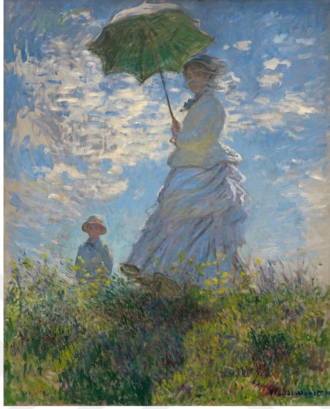
Şekil 2.1 Claude Monet, Gezinti, 1875, Tuval üzerine yağlı boya, 100 cm × 81 cm (39 in × 32 in), Ulusal Sanat Galerisi (Monet, 1875)

duyulmuştur. Suyun hareketli yüzeyinin, güneşin kırmızı ve turuncu ışınlarının birleşimi empresyonist eserler için önemli bir ilham kaynağı olmuştur.