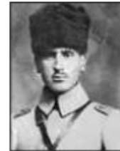
Fotoğraf 3.4: Şahin Bey (1877-1920)

Fransızlar, Antep'i 5 Kasım 1919'da İngilizlerden devraldı. Antep'e gelen Fransız askerî birliklerinin içinde Ermeniler de vardı. Fransızların Ermenilerle ortak hareket etmesi ve Ermenilerin yaptıkları taşkınlıklara göz yummaları, Antep halkını rahatsız etti. Antep'te Anadolu ve Rumeli Müdafaa-i Hukuk Cemiyetinin bir şubesi açıldı. Üsteğmen Salih'in "Şahin" takma adıyla (Fotoğraf 3.4) Kuva-yı Milliye Komutanlığına atanması ve başarılı sonuçlar almasıyla halk daha da örgütlü hâle geldi. Şahin Bey'in şehit olmasından sonra Mustafa Kemal'in emriyle Antep'teki Kuva-yı Milliye birliklerinin komutanlığına Kılıç Ali Bey atandı, çatışmalar daha da şiddetlendi.