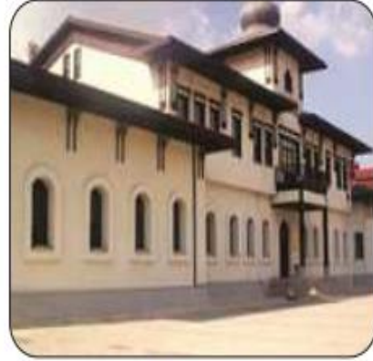
Fotoğraf 2.16: Amasya Genelgesi'nin hazırlandığı Saraydüzü Kışlası

İzmir'in işgali sırasında Türk halkında oluşan tepkiyi gören Mustafa Kemal, 12 Haziran 1919'da Amasya'ya geçti. Artık ulusal mücadeleyi kişisel bir girişim olmaktan çıkarıp tüm ulusa mal etmek gerekiyordu. Bu amaçla burada halkı Milli Mücadele'ye çağıran bir metin üzerinde çalıştı. Bu metinde ülkenin içinde bulunduğu durum ve bu durum karşısında yapılması gerekenler açıklanmaya çalışılıyordu. Mustafa Kemal'in yaveri Cevat Abbas (Gürer) Bey'in kaleme aldığı metin, 22 Haziran'da Amasya Genelgesi (Tamimi) olarak tüm ilgililere duyuruldu (Fotoğraf 2.16). Genelgenin başlıca noktaları şöyleydi: