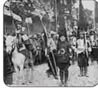
Fotoğraf 3.2: Maraş'ın düşman işgalinden kurtuluşu kutlamaları (1920)