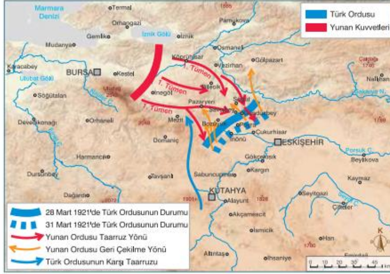
Harita 3.4: İkinci İnönü Savaşı'nı gösteren kroki

ortadan kaldırmak hem de TBMM'nin askerî açıdan daha fazla güçlenmesini engellemek amacıyla. Ankara'ya kadar ilerleyip sonuca ulaşma gayretiyle Bursa üzerinden Afyon ve Eskişehir'e doğru saldırıya geçtiler. Bilecik ve Adapazarı'nı işgal ettiler (Harita 3.4).