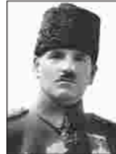
Fotoğraf 2.20: Ali Fuat Paşa (1882-1968)

Kongre kararları her kesime duyurulmaya çalışılırken Padişah Vahdettin'e de ulaştırılmak istendi. Damat Ferit Paşa Hükümeti kongreyi engellemeye çalıştığı gibi kongre kararlarının padişaha ulaştırılmasına da engel oldu. Bunun üzerine İstanbul Hükümeti ile bütün resmî ilişkileri kesme kararı alındı ve Anadolu'daki çoğunluk bu karara uydu. Kongrenin bu girişiminden sonra Damat Ferit Paşa Hükümeti istifa etmek zorunda kaldı. Yerine Ali Rıza Paşa Hükümeti kuruldu. Damat Ferit Paşa'nın istifası, Anadolu hareketinin İstanbul Hükümeti'ne karşı kazandığı ilk siyasi başarısı oldu.