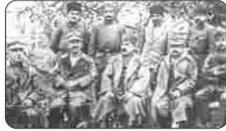
Fotoğraf 3.13: Büyük Taarruz zaferle neticelenmiş, Yunan Orduları Başkomutanı Trikupis ise esir edilmiştir. (Alta, soldan ikinci) (1922)

Türk ordusu, 9 Eylül 1922'de İzmir'e girerek İzmir'i Yunan işgalinden kurtardı. 11 Eylül'de Bursa'nın kurtarılması ve 18 Eylül'de Mudanya'dan Yunan kuvvetlerinin çekilmesiyle Batı Anadolu'nun tamamı düşman işgalinden kurtarıldı. Böylelikle Türk devriminin askerî aşaması zaferle sona erdi. Artık diplomatik başarı için ortam hazır. 26 Ağustos'ta başlayıp 9 Eylül'de sonuçlanan Büyük Taarruz ile sömürgeci devletlerin Anadolu'ya yönelik beklentileri boşa çıkarıldı.