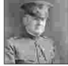
Fotoğraf 3.1: ABD'li General James Harbord (1866-1947)

Mustafa Kemal, Doğu Cephesi'nde Ermenilere karşı yapılan mücadelenin gerekçesini şu sözlerle vurgulamıştı: