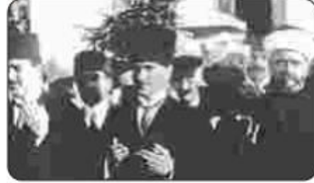
Fotoğraf 2.24: Mustafa Kemal, BMM'nin açılışı sırasında dua ederken (1920)

Mustafa Kemal, 19 Mart 1920'de yayımladığı genelgede Ankara'da olağanüstü yetkilere sahip bir meclisin toplanacağını haber verdi. Yapılacak yeni seçimlerle oluşacak bu meclise, İstanbul'dan tutuklanmamış mebusların da katılabileceğini bildirdi. 23 Nisan 1920'de en yaşlı üye Şerif Bey başkanlığında Ankara'da açılan meclis, o günlerde Büyük Millet Meclisi (BMM) olarak adlandırılmıştır (Fotoğraf 2.24). Yaklaşık dokuz ay sonra Türkiye Büyük Millet Meclisi (TBMM) ismini almıştır.