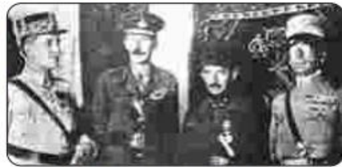
Fotoğraf 3.14: Türkiye adına Mudanya Mütarekesi'ni imzalayan İsmet Paşa, Fransız, İngiliz ve İtalyan delegeleri ile (1922)

İngiltere, Fransa ve İtalya temsilcilerinin hazır bulunduğu konferansa TBMM, Batı Cephesi Komutanı İsmet Paşa başkanlığında bir heyetle katıldı (Fotoğraf 3.14). TBMM'yi İsmet Paşa'nın temsil etmesinde onun İnönü Savaşlarındaki kritik başarıları etkili olmuştur. Yunanistan'a ait delegeler ise konferansa katılmayarak gelişmeleri Mudanya açıklarındaki bir gemiden takip etti. Görüşmelerde Yunanistan'ın sözcülüğünü İngiliz temsilcisi üstlendi.