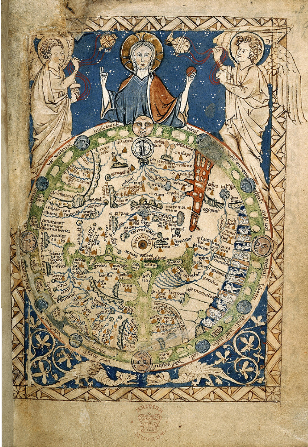
Şekil 2.3: Psalter Dünya Haritası 183