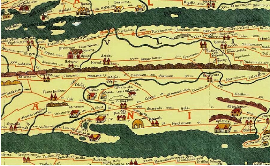
Şekil 2.2: Peutinger Haritası'ndan bir kesit 176

leştirilmiş halinden ibarettir. 178 Talbert'e göre ise harita Romalılar'ın dünya egemenliği propagandasını yansıtır biçimde okunabilir. Bir diğer olasılıksa haritanın Diocletian'ın tetraşisi dönemine ait olması ve isyanlardan, istilalardan kurtulan imparatorluğun artık güven içinde olduğu savını işliyor olmasıdır. 179 Ancak şu kesin ki Roma'yı merkeze alan bu haritada modern siyasi haritalar gibi sınırlar ve homojen alanlar gösterilmiyor, aksine her bir yerleşim yeri kendi karakteristik özellikleri ile birlikte resmediliyor.