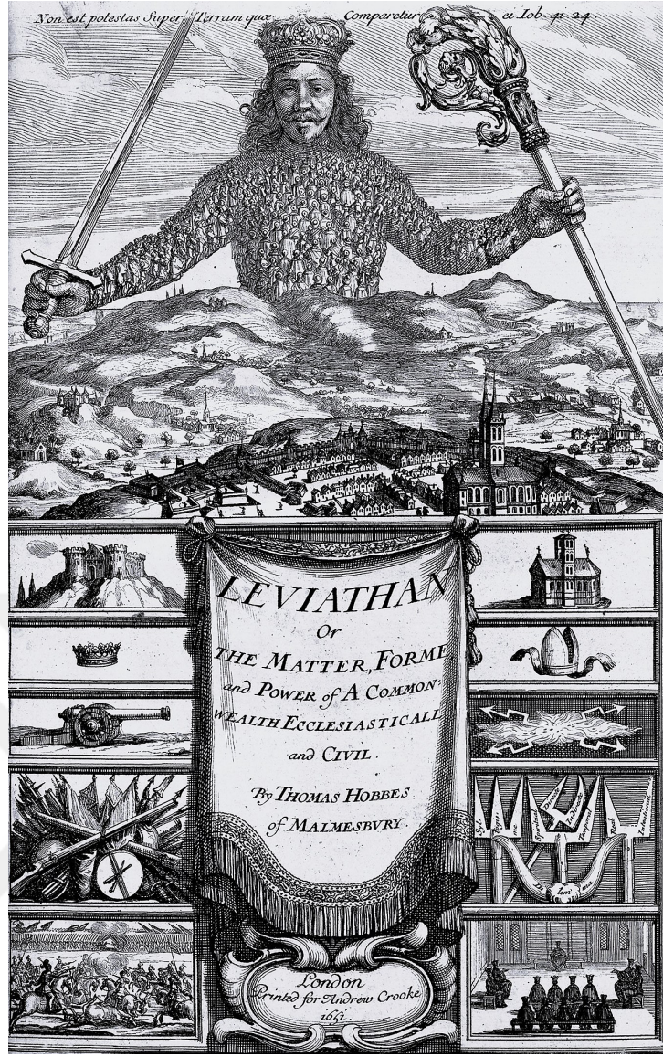
Şekil 2.4: T. Hobbes, Leviathan, İç Kapak

etmekte ve Leviathan imgesinde birleşmektedirler. 284 Leviathan imgesinin üzerinde durduğu alan seküler iktidarın egemenlik alanını simgeler. Şehirle birlikte onu çevreleyen kırsal alan tasvirinden mekana ilişkin bakış açısındaki değişim; tek tek şehirler, yerleşim yerleri üzerinden düşünmek yerine çevreyi de kapsayan homojen bir bütün olarak ülke/bölge fikrine dönüşümün izlerini görmek mümkündür.