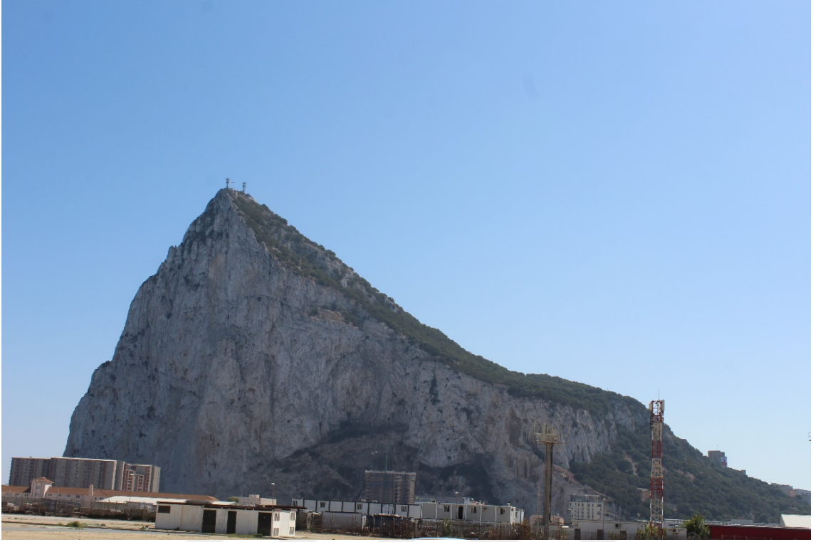
EK 1: Târik b. Ziyâd'ın çıkarma yaptığı Cebelitârik adası.