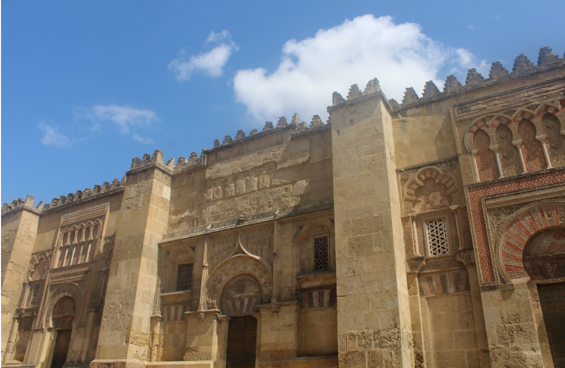
EK 2: Kurtuba Ulu Camii/Dış Görünüm.

(Günümüzde Cordoba Katedrali olarak kullanılmaktadır).