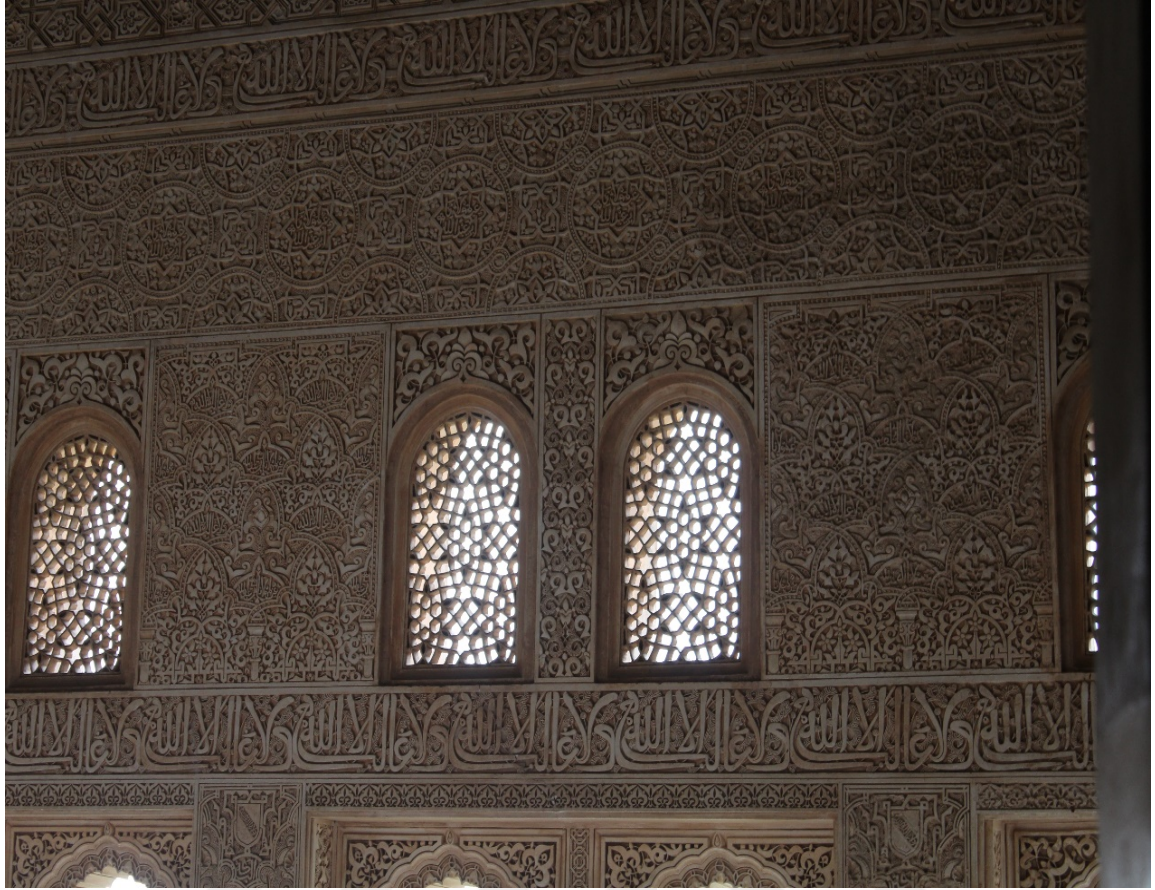
EK 7: Elhamra Sarayı içerisinde “Lâ gâliba illallah” motifleri.