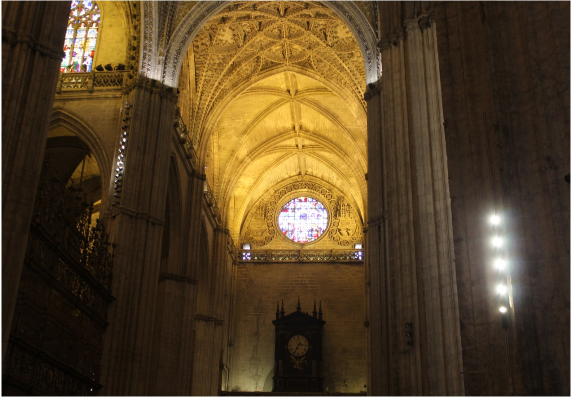
EK 4: İşbîliye Ulucamii/Santa Maria Kilisesi’ne dönüştürülmüştür.

(Günümüzde “Cordoba Katedrali” olarak kullanılmaktadır.)