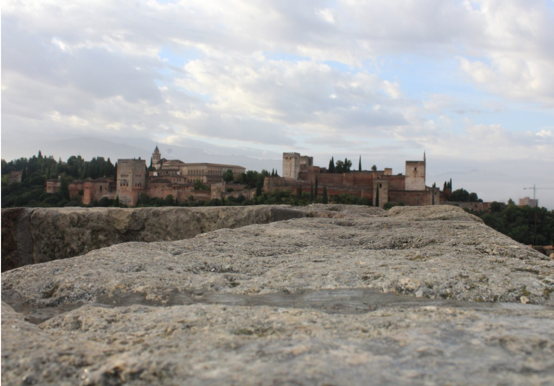
EK 6: Elhamra Sarayı'nın dış görünümü.