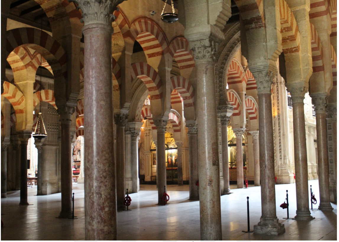
EK 3: Kurtuba Ulu Camii/iç Görünüm.

(Günümüzde “Cordoba Katedrali” olarak kullanılmaktadır.)