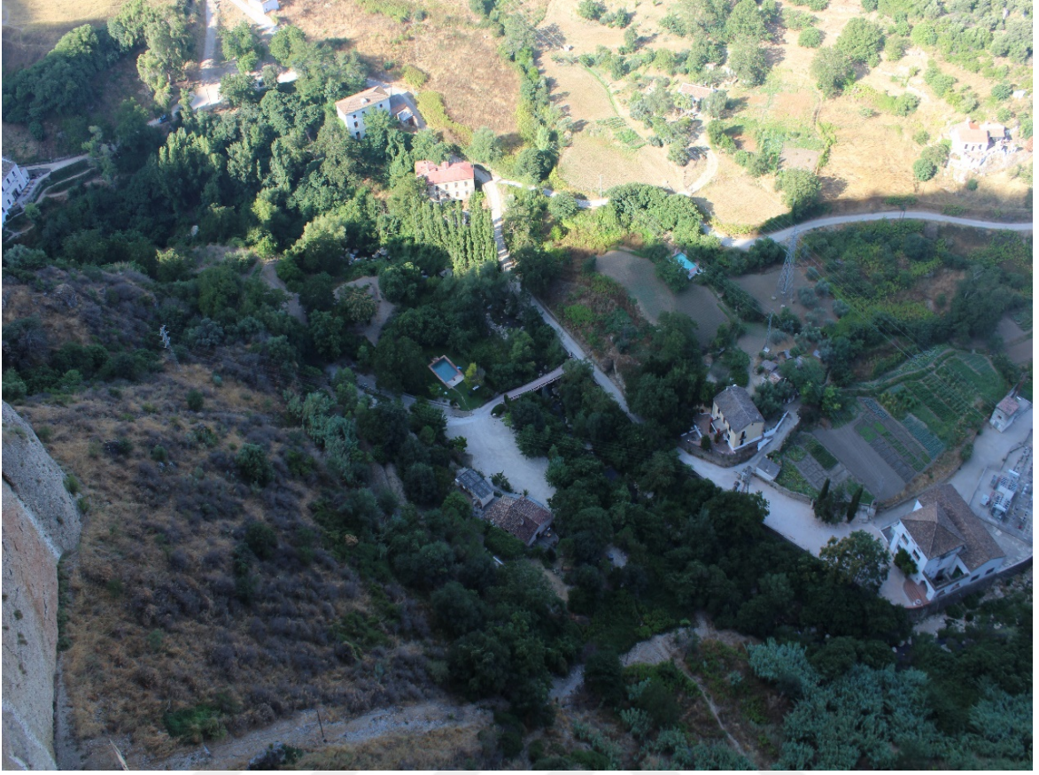
EK 9: Abbas b. Firnâs'ın Ronda şehrinde gerçekleştirdiği ilk uçuş alanı.