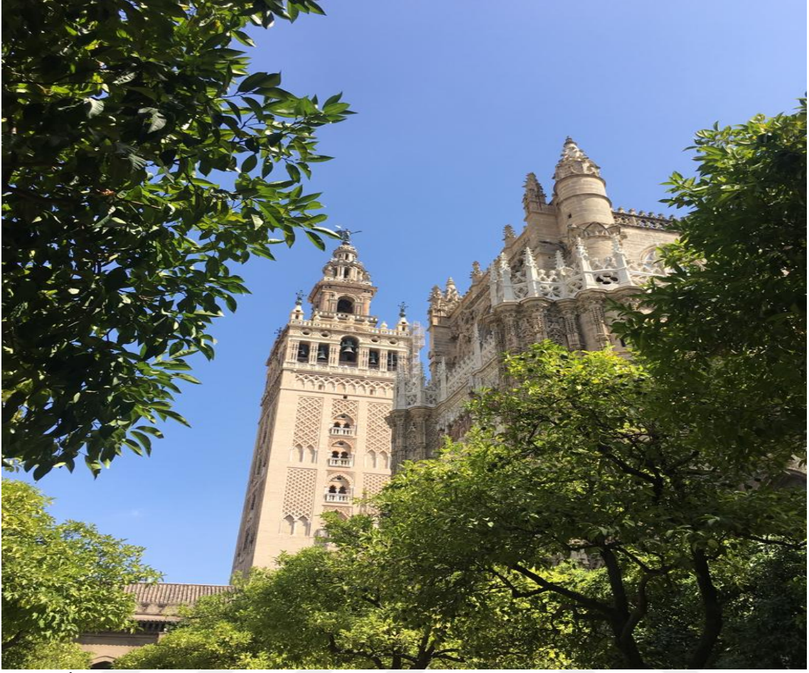
EK 5: İşbîlye Ulucamii minaresi, çan kulesine çevrilerek “La Giralda” adını almıştır.