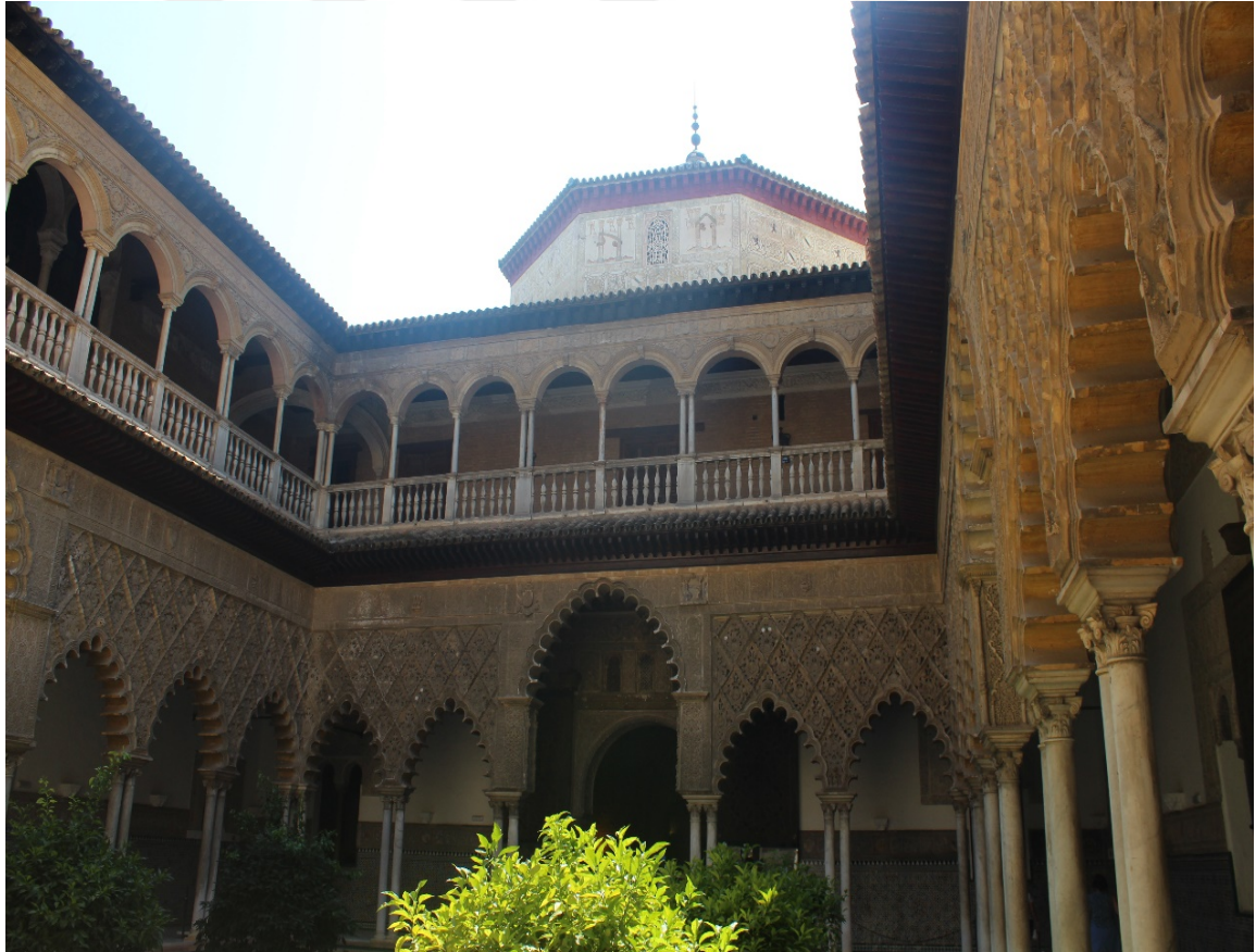
EK 8: Endülüs'te Ortaçağ saraylarından, Sevilla Alkazarı.