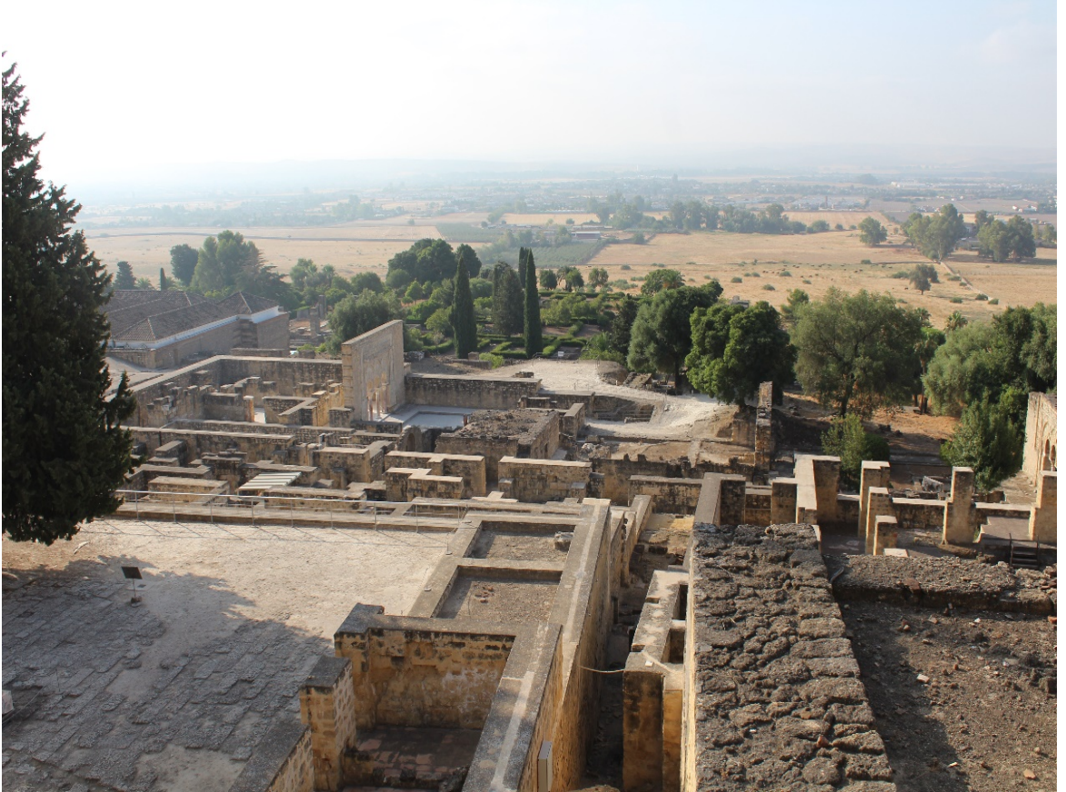
EK 10: II. Abdurrahman zamanında inşa edilen Medînetüzzehrâ sarayının kalıntıları.