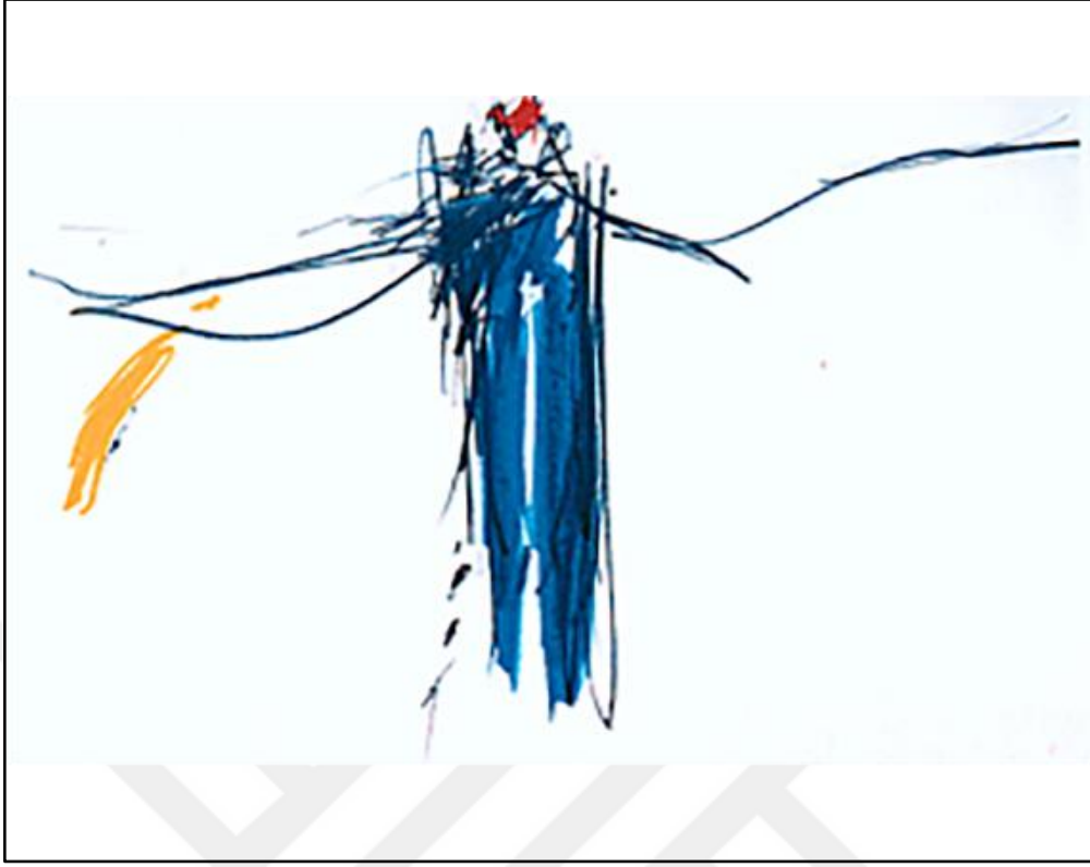
Resim 7. Z. Gençaydın, isimsiz, 33X50 cm