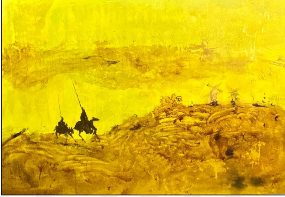
Resim 5. M. Zahit Büyükişleyen, güz sancısı, 70x100 cm, TÜYB, (2021).