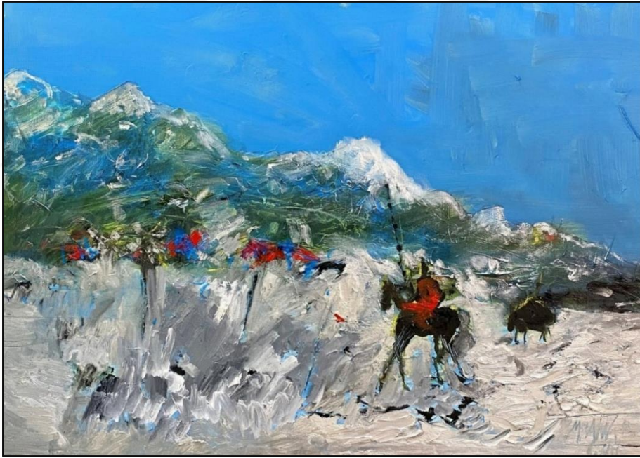
Resim 4. M. Zahit Büyükişleyen, sevdalinka, TÜYB, 70x100 cm, (2022).