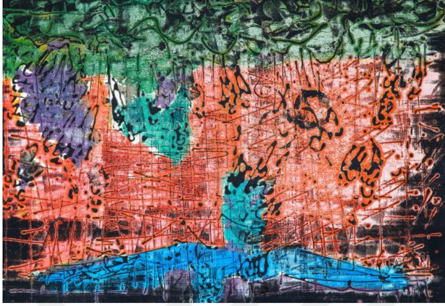
Resim 1. Hasan Pekmezci DÜYB imzalı, 57x83 cm.