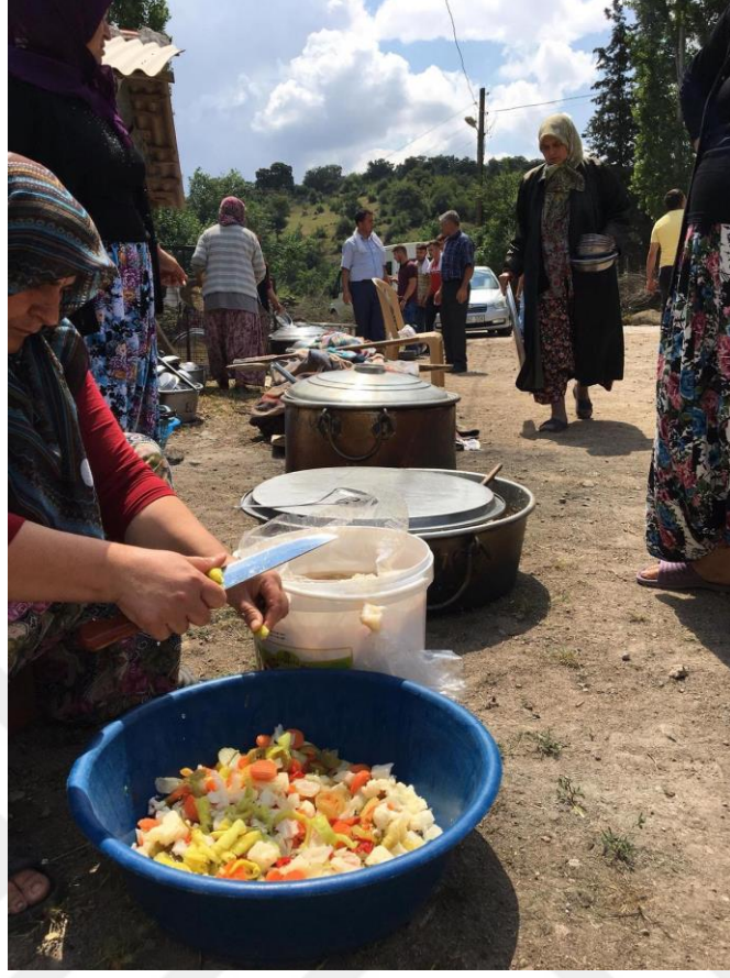
Resim 22. Köy Hayrı Hazırlıkları