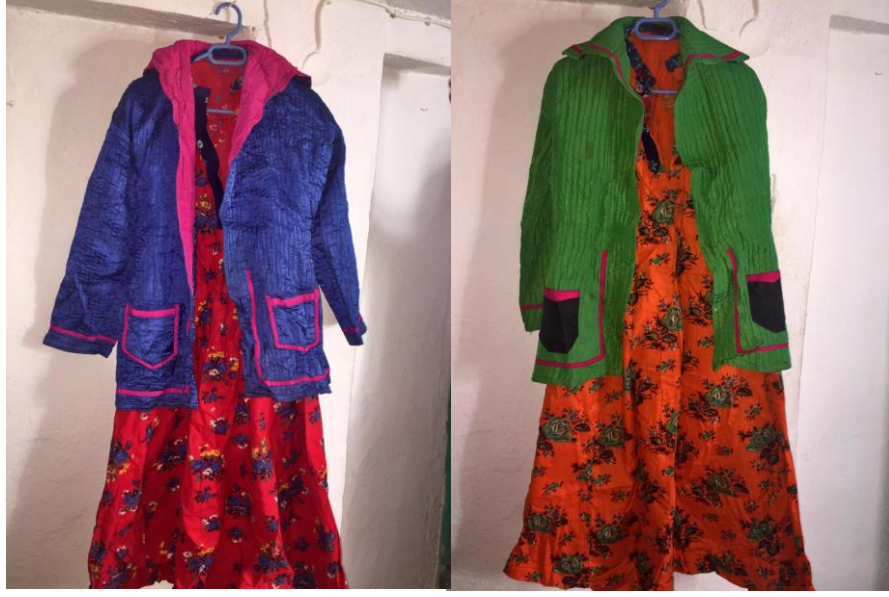
Resim 24. Gnlk Kadın Giysileri