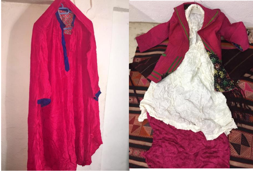
Resim 23. Kırmızı Gelinlik