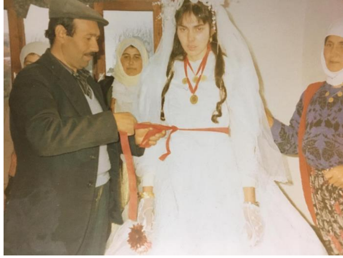
Resim 12. Gelin ıkarma