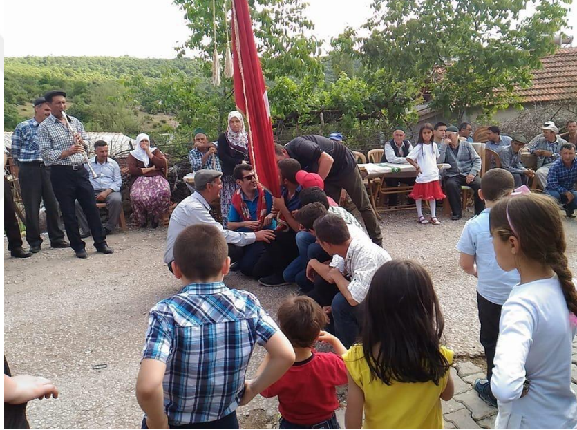
Resim 13. Seferim ekimi