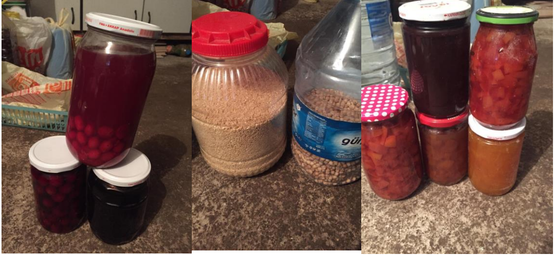
Resim 31. Kış Hazırlıkları 2