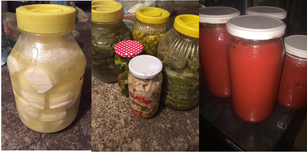
Resim 30. Kış Hazırlıkları 1