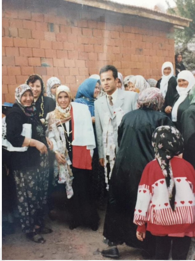
Resim 8. Nişan Töreni