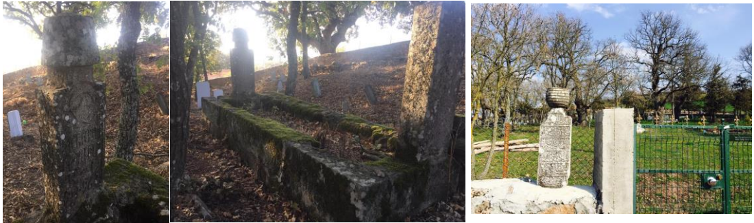
Resim 16. Mezar Taşı Örnekleri