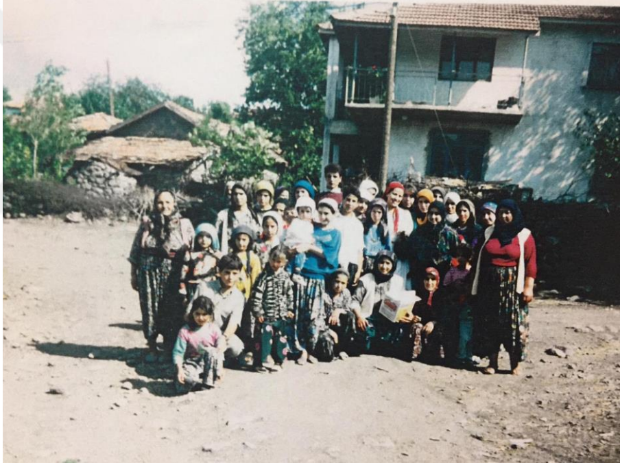
Resim 15. Suya Götürme