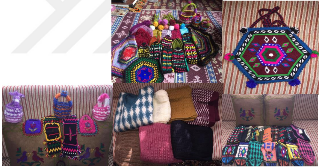
Resim 11. eyiz