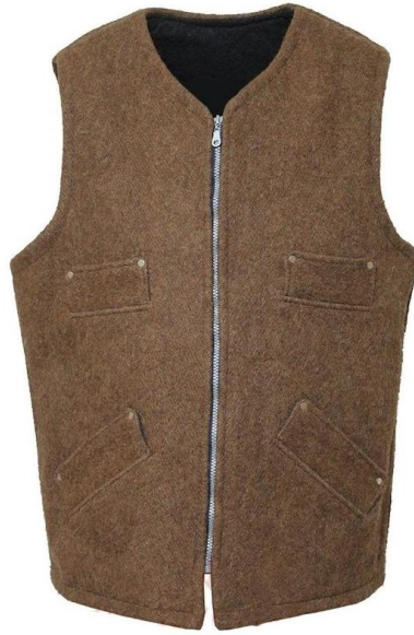
Resim 26. Şayak Yelek