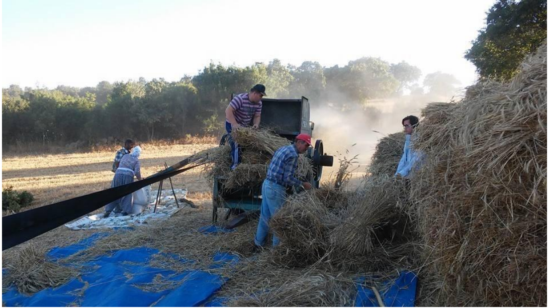
Resim 18. İmece Usulü Yardımlaşma