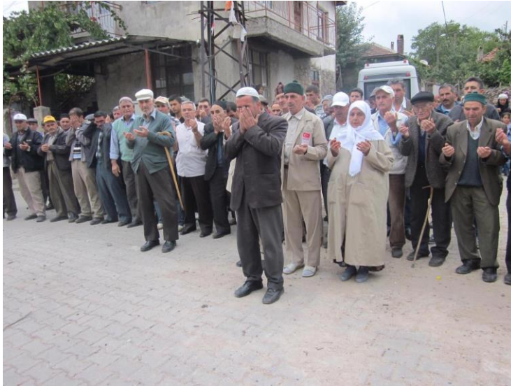
Resim 21. Hacı Uğurlama