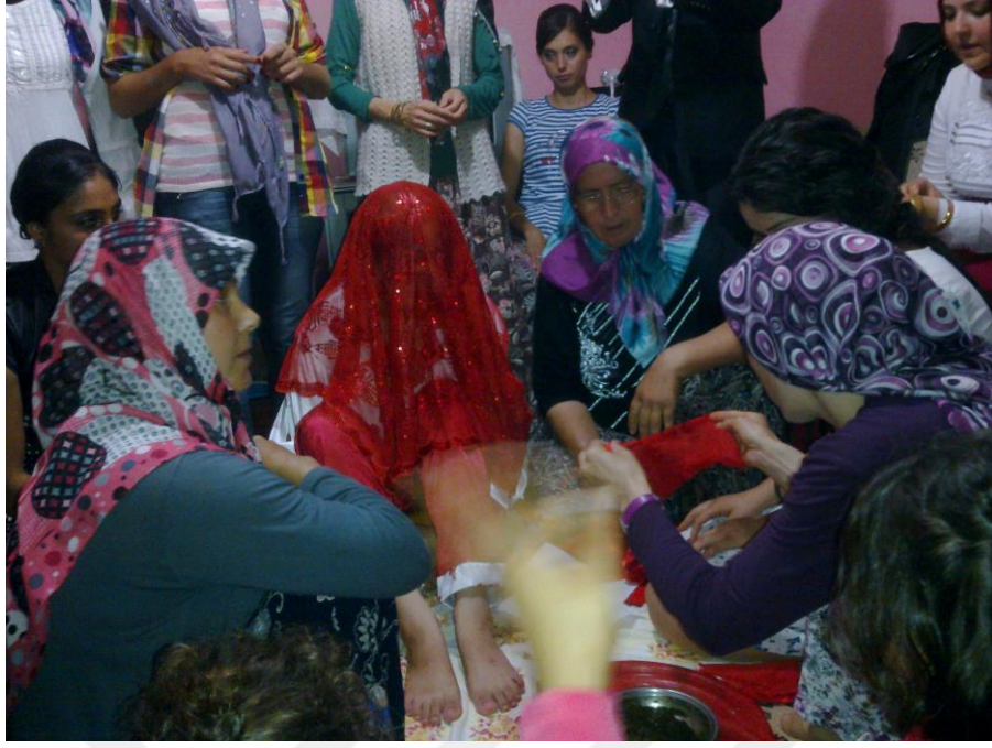
Resim 10. Kına Gecesi