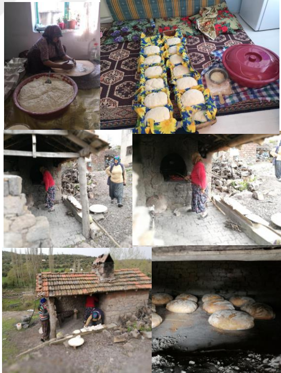
Resim 9. Düğün Ekmeği Yapımı