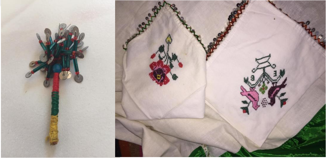
Resim 7. Sözde Verilen Hediyeler