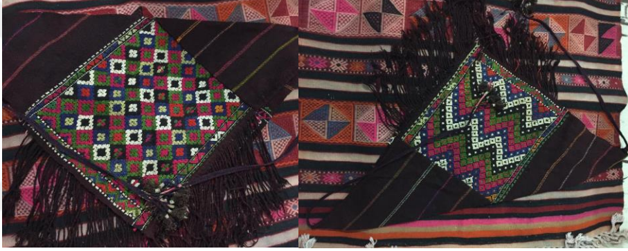
Resim 25. Peşkir ve Kuşak