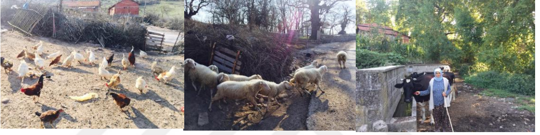
Resim 4. Mahallede Hayvancılık