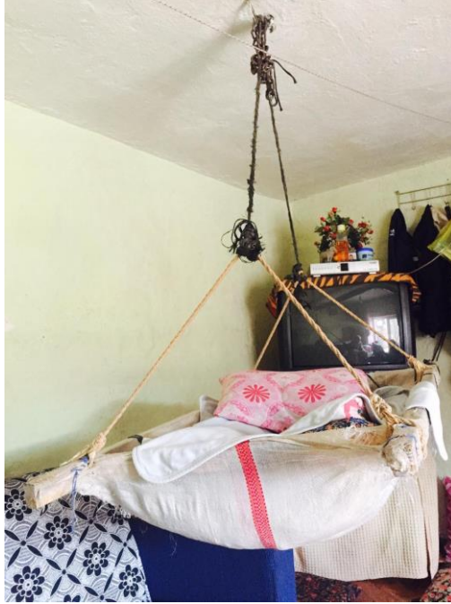
Resim 5. Çingen Salıncağı