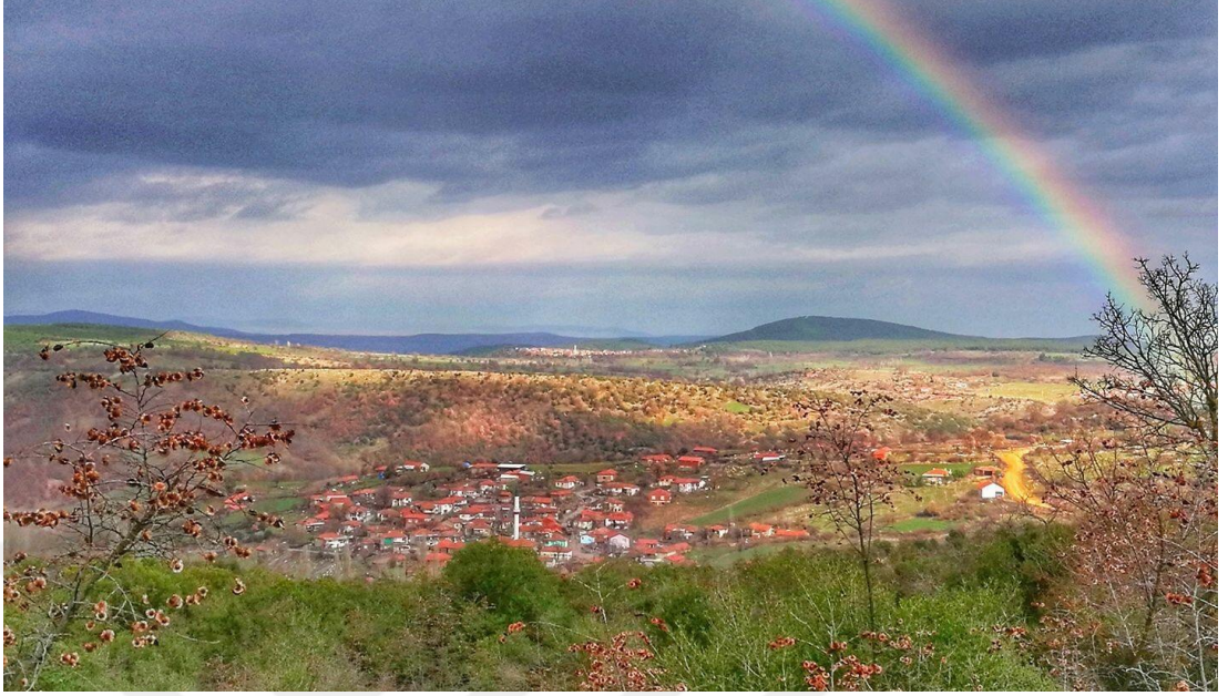
Resim 1. Yaren Mahallesinden Bir Görünüm