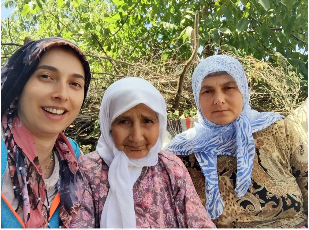
Resim 17. Yaren Mahallesinde Üç Kuşak