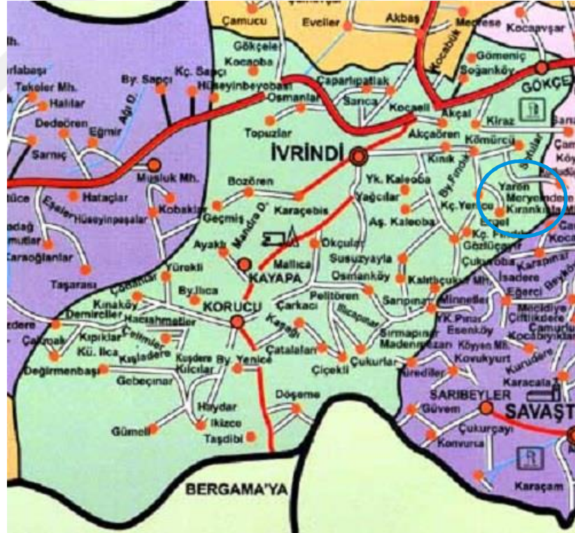
Resim 2. İvrindi Yaren Mahallesi Haritası