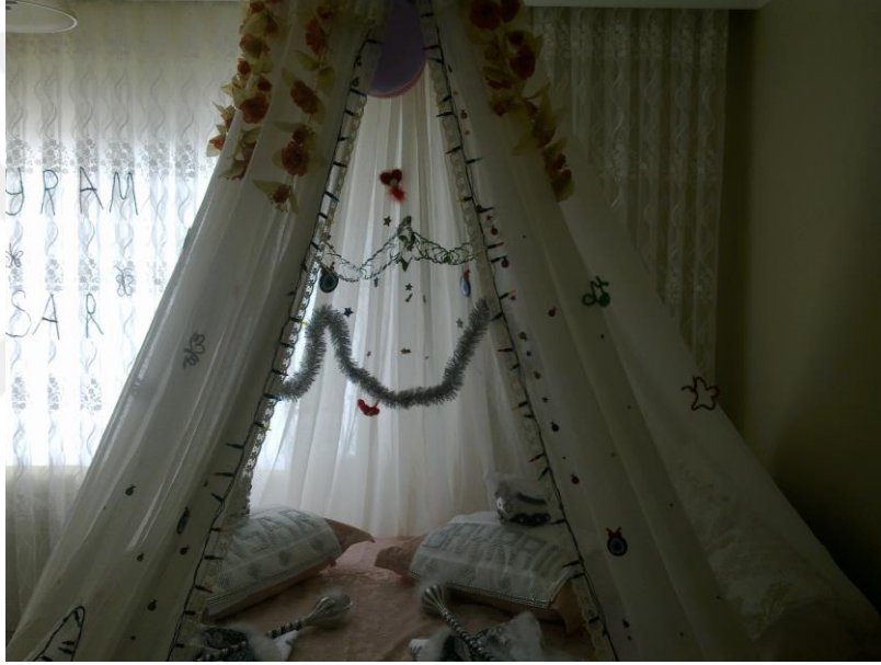
Resim 20. Sünnet Karyolası