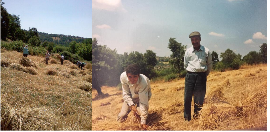
Resim 3. Mahallede Tarım