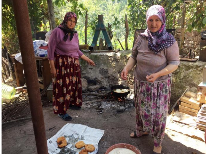
Resim 19. Lokma Yapımı