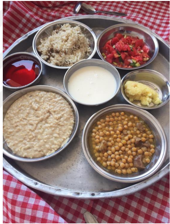
Resim 32. Düğün Yemekleri ve Hazırlıkları