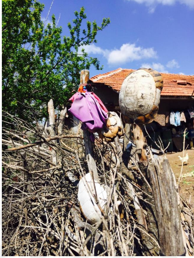
Resim 29. Nazar Önleme