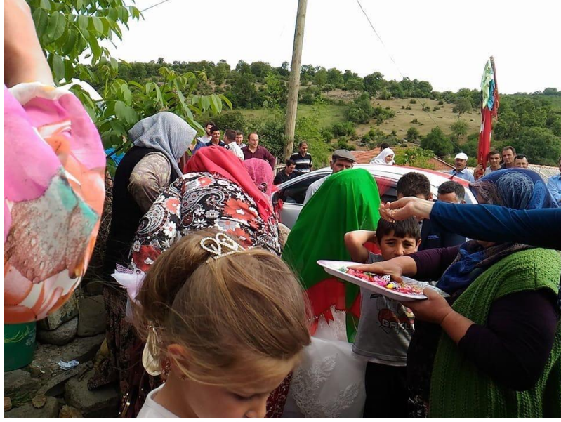
Resim 14. Gelin İndirme Geleneği