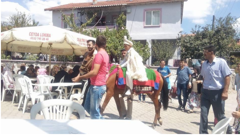
Resim 6. Sünnet Düğünü