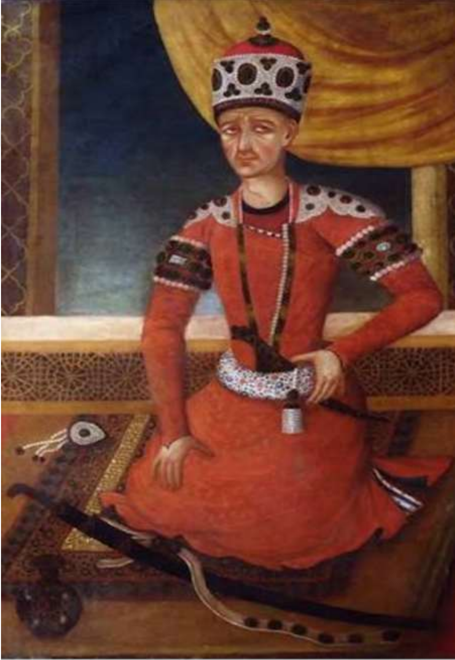
Şekil 1. Ağa Muhammed Şah Kaçar