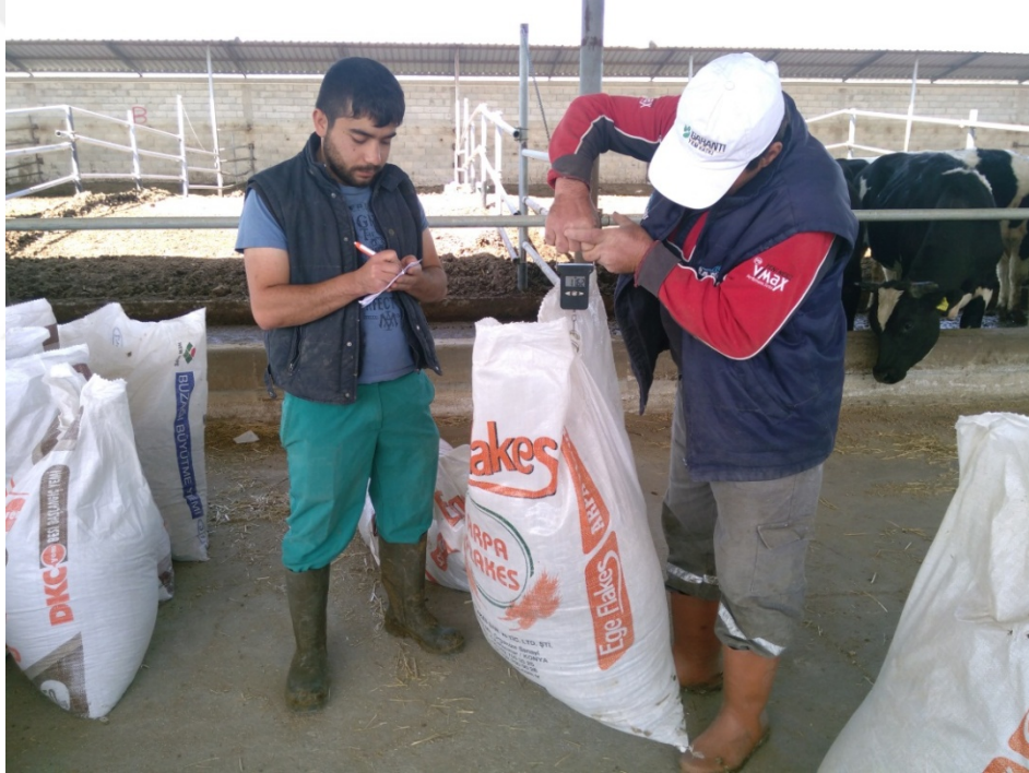
Şekil 2.2. Artan yemlerin toplanıp tartılması

Deneme süresince yem tüketiminin saptanması amacıyla, günlük artan yemler hayvanların önünden alınarak torbalara konulmuş ve haftada bir biriken yemler tartılarak artan yem miktarları bulunmuştur. Bir haftalık aralıklarla her bir grubun yemediği yem miktarları tartılarak, verilen yem miktarından çıkarılıp tüketilen yem miktarı saptanmıştır. Her bir grup için ayrı ayrı belirlenen tüketilen yem miktarları, gruplardaki hayvan sayısına bölünerek 1 haftalık dönemlerdeki hayvan başına ortalama yem tüketimleri saptanmıştır.