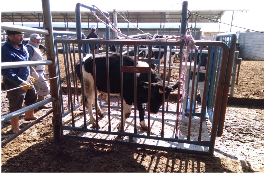
Şekil 2.3. Hayvanların Tartılması