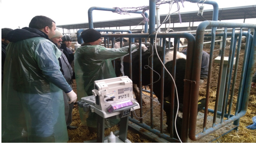
Şekil 2.6. Karkas kalitesinin ölçülmesi için görüntü alınması