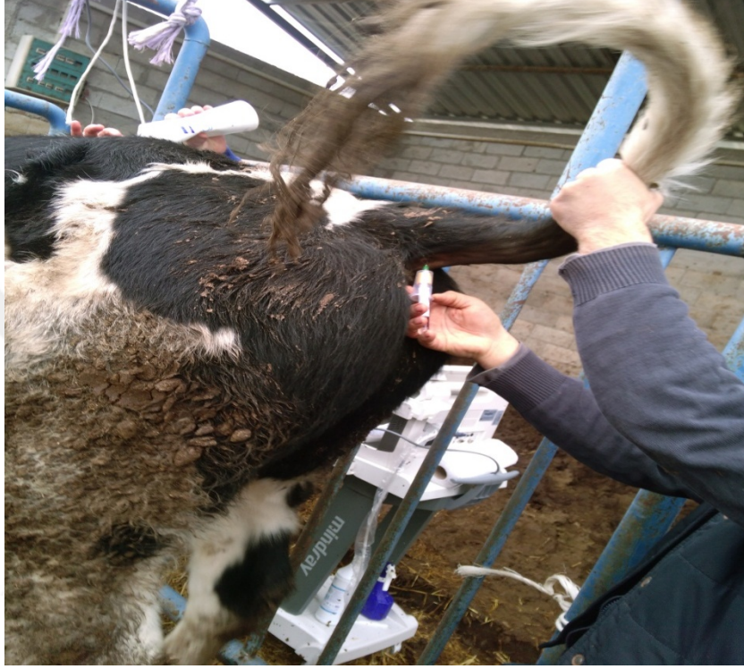
Şekil 2.4. Deneme başlangıcında ve sonun da hayvanların kuyruk altı venasından (V.coxys (caudalis) mediana) kan örneği alınması

tüplerine konularak analizlerin yapılacağı tarihe kadar -18 °C'de derin dondurucuda saklanmıştır. Oda sıcaklığında çözünmeleri ve uygun analiz sıcaklığına gelmeleri beklendikten sonra serum örneklerinden, bazı kan parametrelerinin ( glikoz, Ca, P, Mg, total protein, albümin, kan üre azotu, AST, GGT, kolesterol) ölçümleri Selçuk Üniversitesi Veteriner Fakültesi İç Hastalıkları Anabilim Dalı Laboratuvarında bulunan BT-3000 Plus marka oto analizör kullanılarak yapılmıştır.