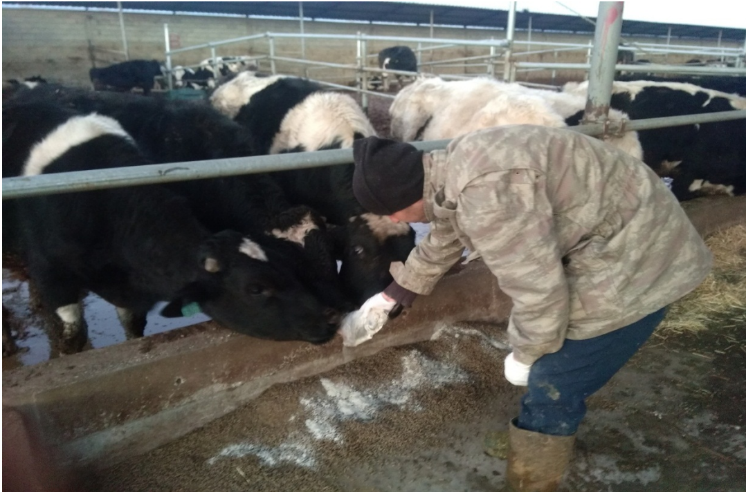
Şekil 2.2. Yumesa-Meat Plus'ın deneme grubunun yemlerinin üzerine dökülmesi