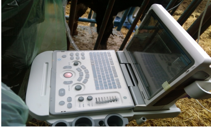
Şekil 2.5. Karkas kalitesini ölçmek için kullanılan ultrason cihazı