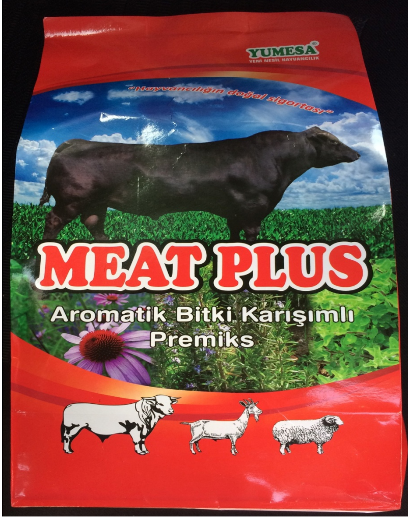
Şekil 2.1. Yumesa-Meat Plus aromatik bitki karışımı premiksin görünümü