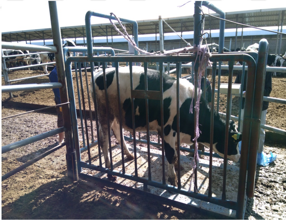
Şekil 2.1. Hayvanların tartılması

Denemede kullanılan erkek besi danaları, doğum tarihleri ve canlı ağırlıkları birbirine yakın olacak şekilde seçilmiştir. Hayvanların deneme yerine alışmaları amacıyla, on beş gün boyunca adaptasyon dönemi uygulanmıştır. Bu dönemde kontrol ve deneme grubunda kullanılan konsantre besi başlangıç yemi ve saman kuru yonca otu karışımı ad libitum olarak verilmiştir. Adaptasyon dönemi sonrasında besi sığırlarının canlı ağırlıkları belirlenerek, bir kontrol ve bir deneme grubu olmak üzere iki gruba ayrılmışlardır. Gruplar arasında, deneme başlangıcı canlı ağırlık ortalamalarında fark olmamasına dikkat edilmiştir. Her bir grupta 10 adet besi sığırı bulundurulmuştur ve toplam 20 adet besi sığırı ile deneme yapılmıştır. Deneme ve kontrol grubu oluşturulduktan ve iki haftalık alıştırmaya dönemin tamamlandıktan sonra hayvanlar tekrar tartılmış ve canlı ağırlıkları belirlendikten sonra denemeye başlanmıştır (Şekil 2.1). Deneme süresi, 15 günlük adaptasyon dönemi de dahil olmak üzere toplam 108 gün sürmüştür.