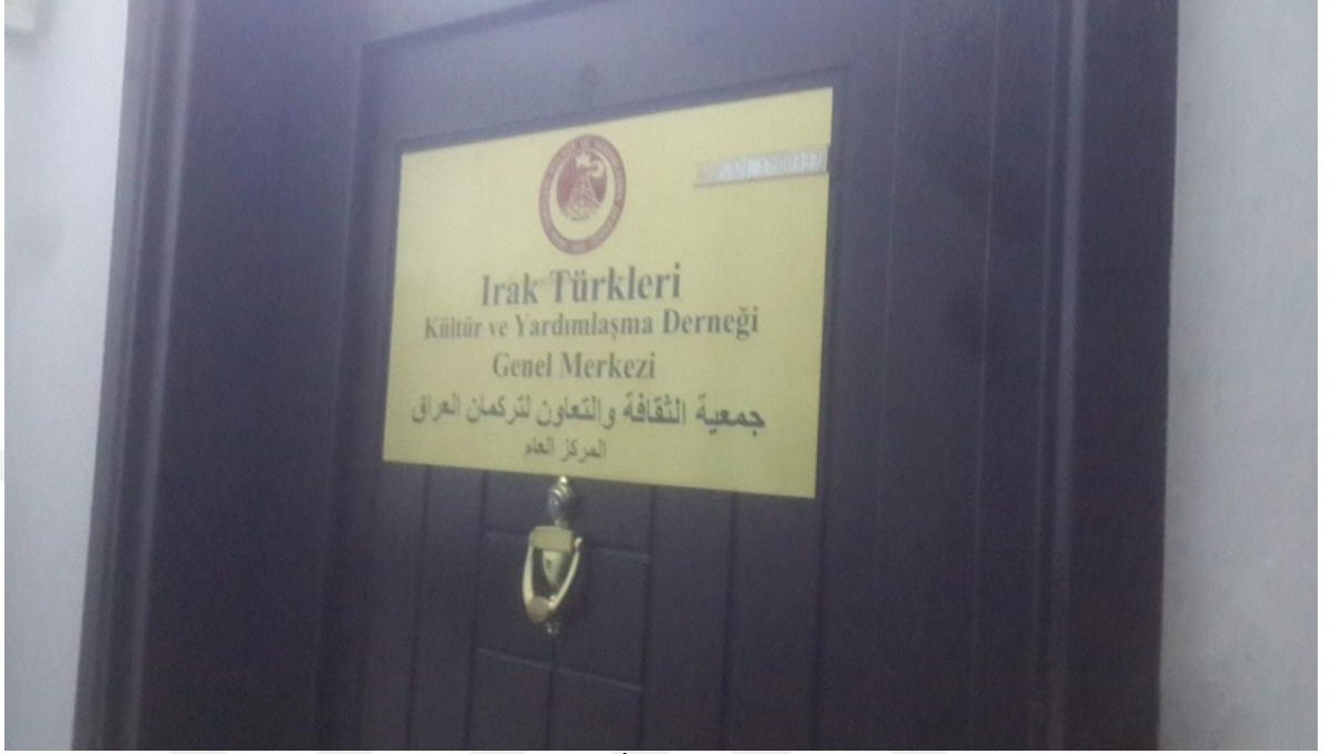
Fotoğraf 6: Derneğin Kapısında Derneğin İsmi Türkçe ve Arapça Olarak Yazılmaktadır.