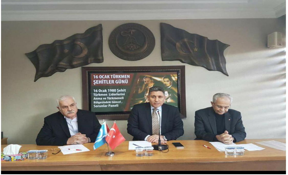
Fotoğraf 7: Türkmen Şehitler Günü'nde Başkan Mehmet Tütüncü'nün Açılış Konuşması