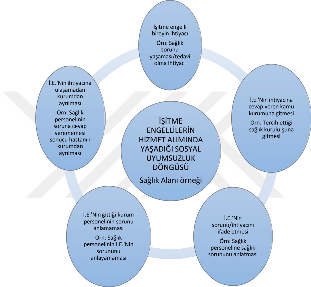
Şekil 3. İşitme engellilerin hizmet alımında yaşadıkları sosyal uyumsuzluk döngüsü.

iletişim yöntemleri olan işaret dilini kullanmaktadır. İşitme engellilerin kullandıkları işaretleri anlamayan kamu personelleri hizmet alan-veren ilişkisinde bir kopukluğa neden olmakta ve çözüm üretememektedir. Bu döngü Şekil 3.'te yer almaktadır.