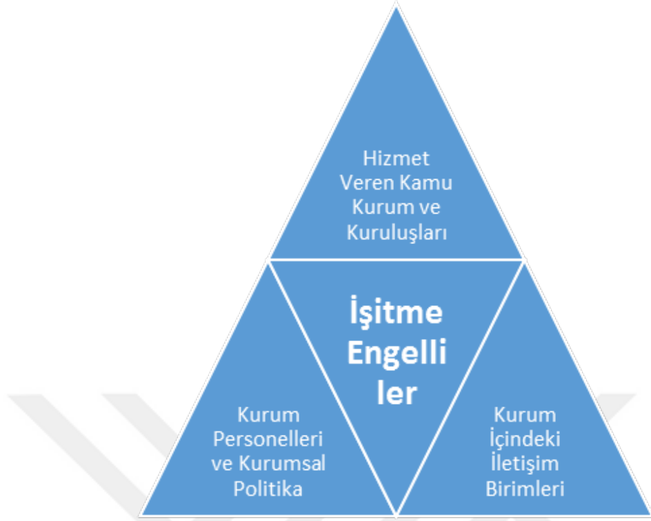
Şekil 2. İşitme engellilerin sosyal uyumuna ilişkin sistemik çerçeve

İşitme engellilerin fiziksel engelleri duyma ve buna bağlı konuşma kaybı iken sosyal engelleri iletişim kurmakta güçlük çekmeleridir. Anlamak ve anlaşılmaq olarak düşünöldüğünde iletişim bir bütündür ve bunlardan birisi olmadığında iletişim kurulamamaktadır (Bozkurt 1999).