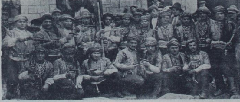
Maraşın kurtuluş bayramına iştirak eden maraşlı kahramanlar

Maraş, 12 (A.A.) — Maraş bugün kurtuluşunun 18 inci yıldönümünü büyük bir sevinç ve coşkunlukla kutladı. Cumhuriyet meydanını dolduran ve taşırın on binlerce halk büyük Önderin kurtarıcı bayrağı altında her zaman can vereceklerine bir daha and içtiler.