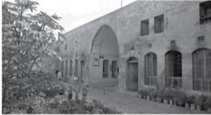
Cemiyet toplantılarının yapıldığı Güllüzade Hacı İbrahim'in evi

Urfa Müdafaai-i Hukuk Cemiyetinin toplantılarını yaptıkları evler.