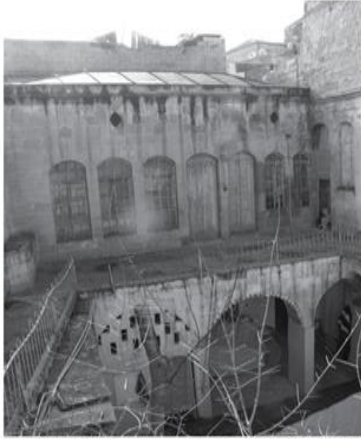
Müdafaayı Hukuk Cemiyeti'nin ilk toplantısının yapıldığı Güllüzade Osman'ın evi