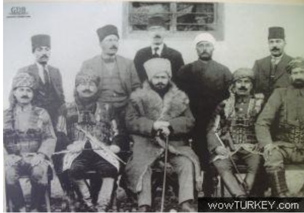
Antep Savaşındaki Çete Reisleri. (1920)