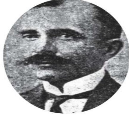
Urfa mutasarrıfı Şehit Nusret Bey