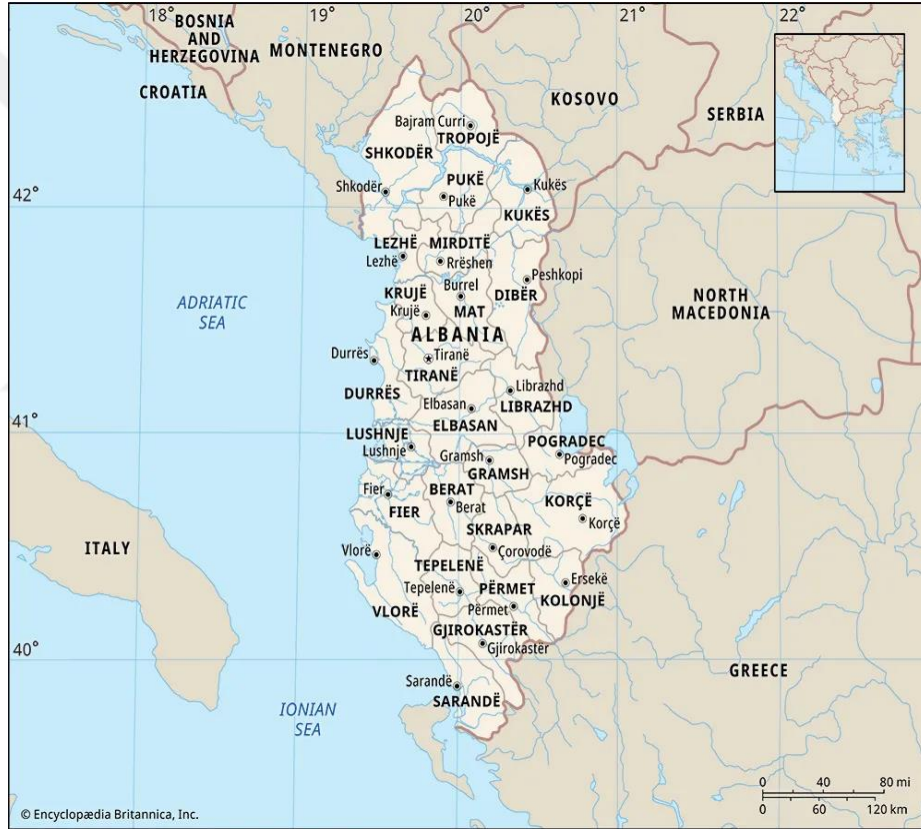
Şekil – 1: Arnavutluk'un Haritası

Osmanlı İmparatorluğunun ayrılmasıyla kendi uluslarını kurmaya girişen birçok halktan biri olan Arnavut halkı, 1912 yılında bağımsızlığını ilan etmiş ve bugüne kadar ulus olarak varlığını sürdürmüştür. Bugün kuzeyde Karadağ ile doğusunda Kuzey Makedonya ile güneyinde Yunanistan ile ve Kuzeydoğusunda Kosova ile komşu olan Arnavutluk'un güncel konumu aşağıdaki haritada gösterildiği gibidir: