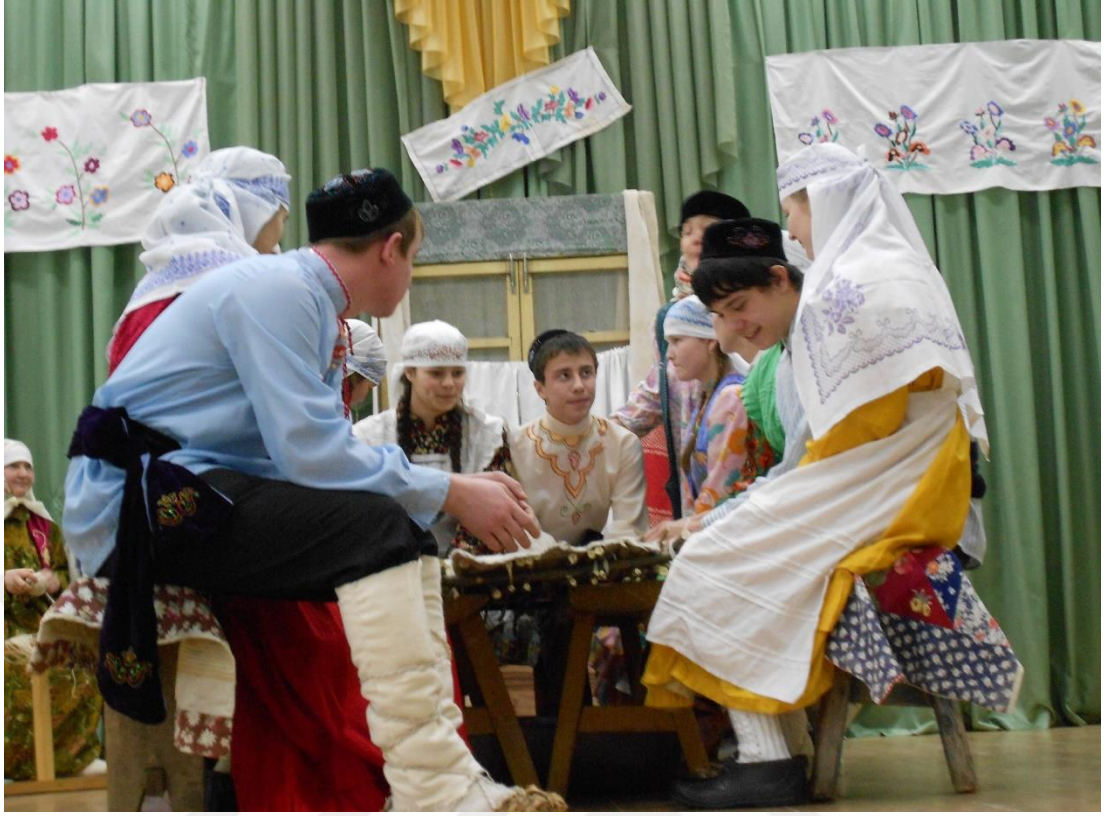
Ek 6. KİNDÉR SUGU (KETEN YAPMA)