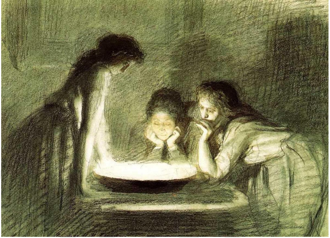
Ek 9. KÖZGÉ FALI /AYNA FALI