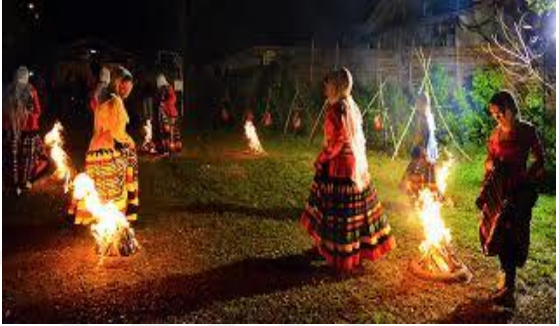
Ek 24. TORPAQ (TOPRAK) ÇARŞAMBASI