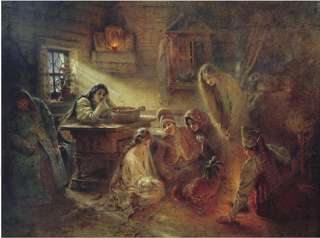
Ek 16. KOYMAK (KREP) FALI