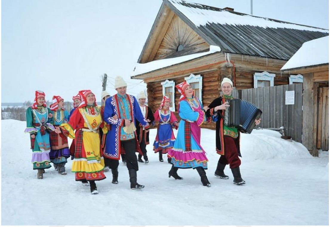
Ek 8. NARDUGAN'DA YÜZÜK FALI