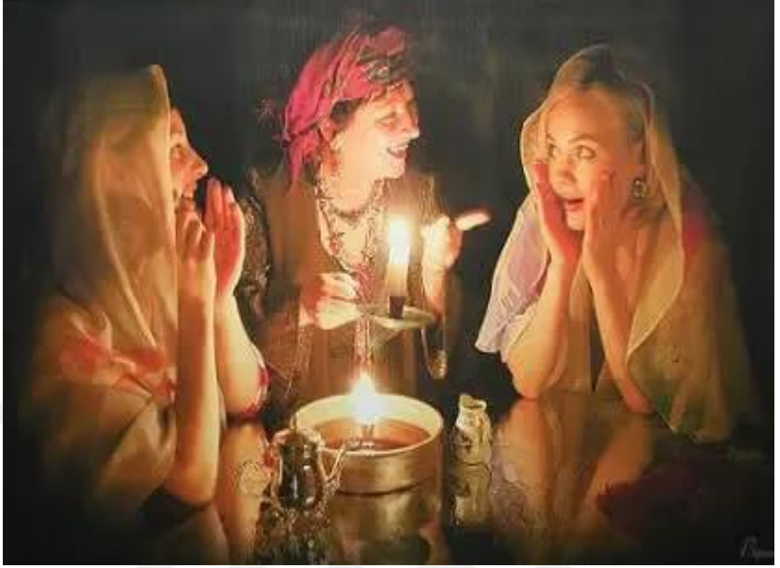
Ek 14. YÖZÉK (YÜZÜK) FALI