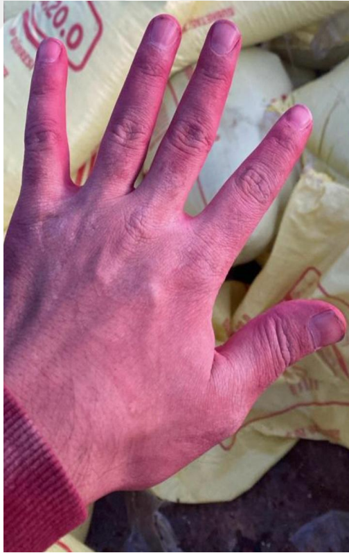
Görsel 4. Zarar Görmüş El 2