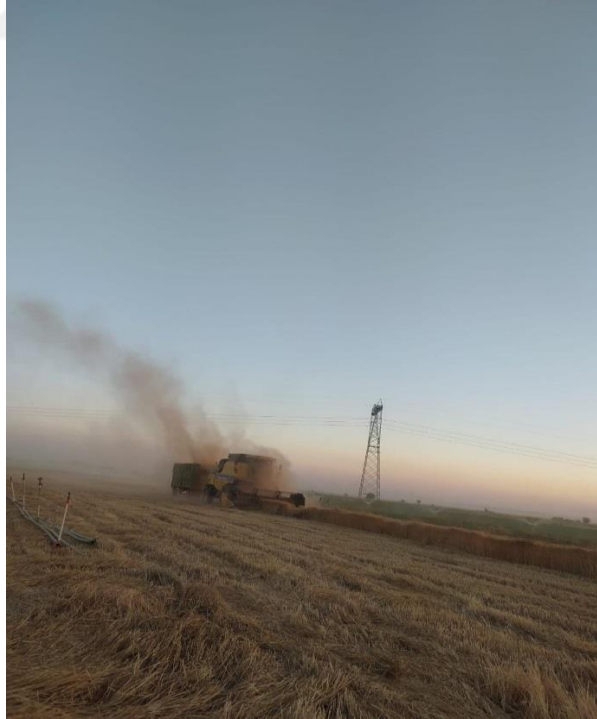
Görsel 6. Tarım Makinesi 2