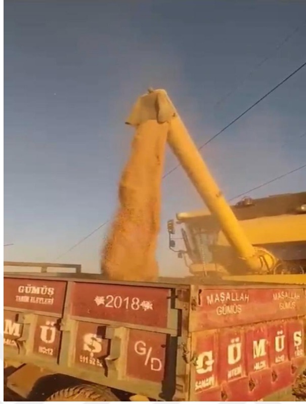
Görsel 5. Tarım Makinesi 1