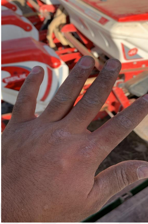
Görsel 3. Zarar Görmüş El 1