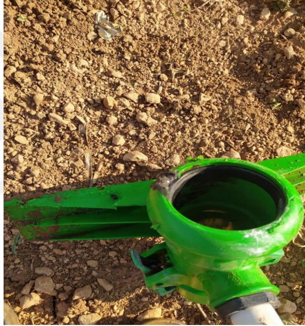
Görsel 7. Kırık Sulama Borusu

Her sulama yönteminin avantajları ve dezavantajları göz önünde bulundurularak, bitki çeşidine, toprağa ve sulama ihtiyacına bağlı olarak en uygun sulama yöntemi seçilmelidir. Ayrıca, suyun tasarruflu ve verimli kullanılmasına önem verilmeli ve sulama sistemleri düzenli olarak kontrol edilmelidir (Sepetçioğlu vd., 2018).