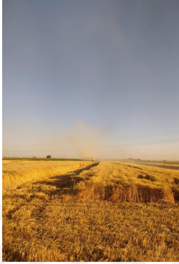
Görsel 2. Tarım Arazisi 2