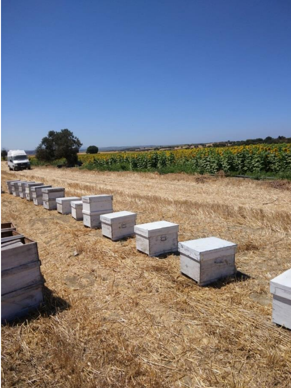
Şekil 2. Kovanlar tarlaların tek tarafına yerleştirilmiştir.

Araştırmada materyal ve test amaçlı kullanılan tarlalarda, kovanlar tarlaların 5 metre uzağına ve tek tarafına yerleştirilmiştir. Kovanlara yakın olarak seçilen tablalar arı uçuş mesafesinin 30 m olduğu, uzak olarak seçilen tablalar ise 150-200 m mesafede olan kısımlardan seçilmiştir (Şekil 1). Her bir deneme ünitesi 5 adet tabladan oluşmuştur. Kovan konmayan tohumluk üretimi yapılan tarla ise, kovanlara 700 m mesafede seçilmiştir. Burada diğer tozlayıcı arıların etkinliği izlenmiş, ancak daha fazla arıların ziyaret ettiği gözlenmiştir.