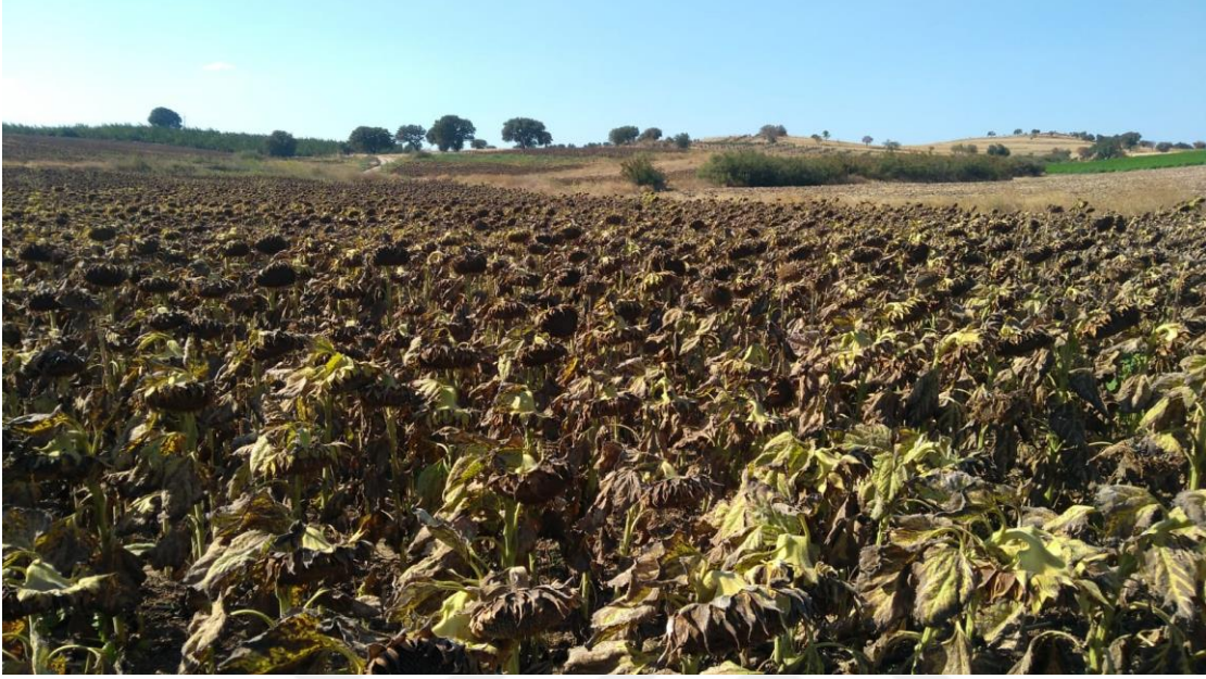
Şekil 3. Hasat tablalar kuruduğunda gerçekleştirilmiştir.

Hasat tablalar kuruduğunda gerçekleştirilmiştir (Şekil 2). Restorer hat sırasından itibaren 1, 3, 5, 7, ve 9'uncu sıralardan üç tekrarlamalı olarak tabla örnekleri alınmıştır.