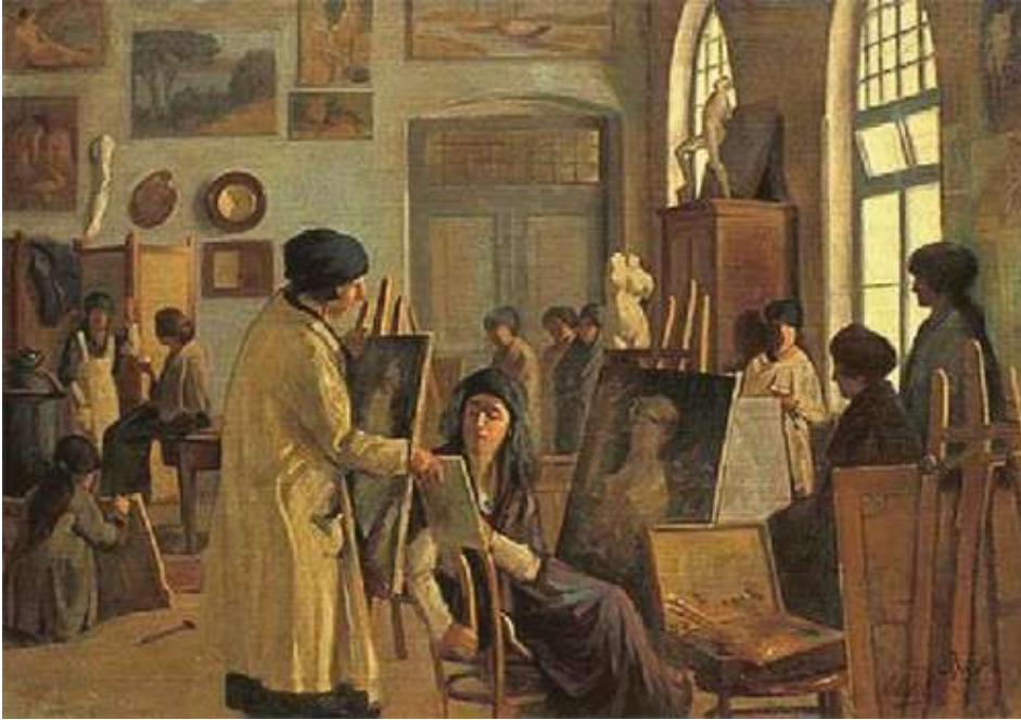
Resim 4: Kızlar Atölyesi 15