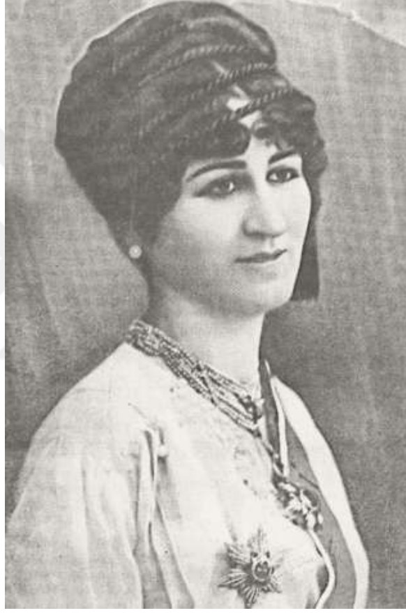
Fotoğraf 9: Kadınlar Dünyası Dergisi'nin Kurucusu Nuriye Ulviye Mevlan Civelek 21

Osmanlı kadınlarının hak ve özgürlüklerine sahip çıkmak amacıyla kurulmuştur. Meşrutiyet Dönemi'nin ilk feminist topluluğudur. Cemiyete Nuriye Ulviye Mevlan önderlik etmiştir.