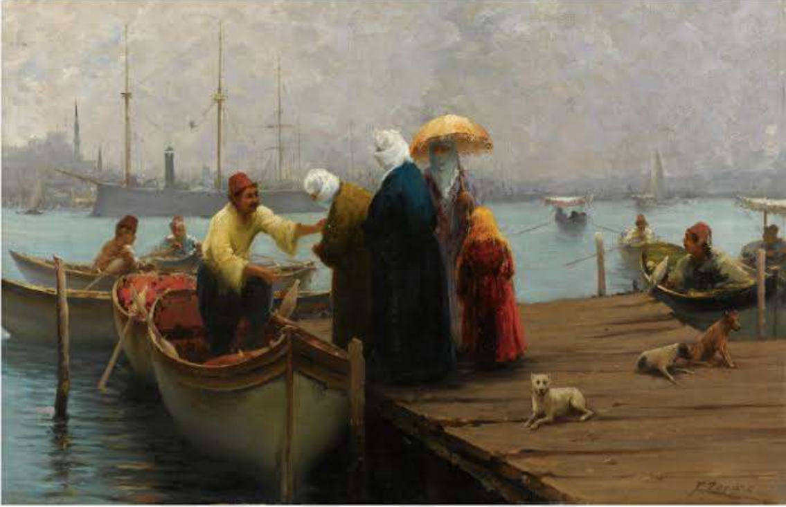
Resim 3: The Embarkation 5

Şeriatla yönetilen Osmanlı toplumunda çok eşlilik yasaldı. Erkekler birden fazla kadınla evlenebiliyor ve bu kadınları istedikleri zaman bir “boş ol” kelimesiyle hukuksuz bir şekilde boşayabiliyordu. Evlilik ve boşanma tamamen erkeklerin isteği doğrultusunda geliyordu. Kadınların hukuki hiçbir hakkı yoktu. Ne miras alabiliyorlar ne de tanıklıkları mahkemece erkekle eşit olarak görülüyordu. Kadınlar toplumsal hayata dâhil olamıyorlar ya da eşlerinin/babalarının verdiği ölçüde dâhil olabiliyorlardı. Kadınların örtünmesi zaruriydi çünkü mahremiyetleri kendilerinden başka tüm toplumu ilgilendiriyordu ( https://www.youtube.com/watch?v=fuxaGKm17KI ).