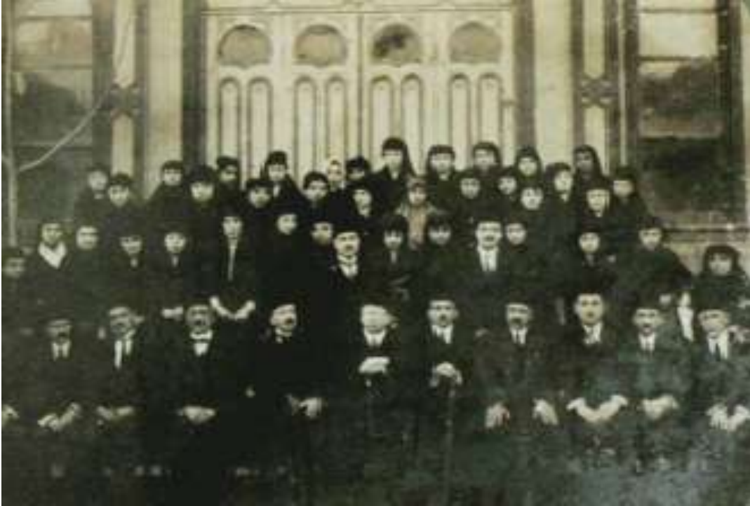
Fotoğraf 6: İnas Darülfünunu Edebiyat Bölümü Kadın Öğrenciler ve Hocalar 17