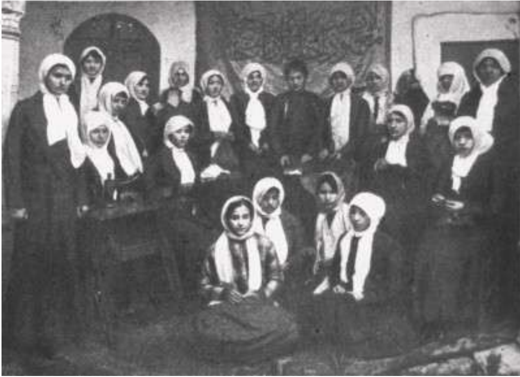
Fotoğraf 15: Mâmulât-ı Dâhiliye İstihlâkı Kadınlar Cemiyet-i Hayriyesi Üyeleri 27

Bu derneğin kuruluş amacı yerli üretimi teşvik edip ülke ekonomisinin dış ülkere bağımlılığını azaltmaktır. Bu amaç doğrultusunda sadece yerli ham madenin kullanıldığı bir terzihane açılmıştır. Böylece hem yerel ürünler üretilebilmiş hem de kadınlara istihdam sağlanmıştır. Çeşitli etkinlikler düzenleyerek bunları ve kadınlara yönelik bilinçlendirme yazılarını Siyanet dergisinde yayımlamışlardır. Savaş yıllarında terzihanelerde askerlere çamaşır dikmişlerdir. (Çakır, 1996: 54-55).