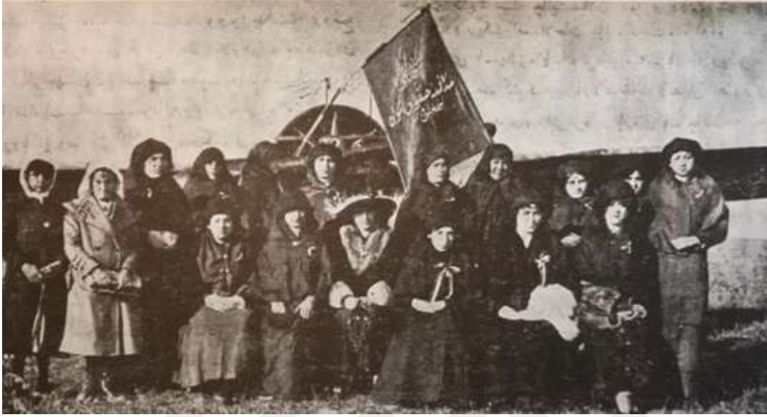
Fotoğraf 10: Osmanlı Müdafaa-i Hukuk-i Nisvan Cemiyeti ve Kadınlar Dünyası Heyeti 22

faydalanabilmesi adına çalışmalar yapılmıştır. Kadınların daha fazla iş hayatında yer almasını, giyimlerinin modernleşmesini, eğitim hakkından faydalanmalarını sağlamak ve kadınların daha fazla bastırılmasını önlemeye çalışmak cemiyetin hedefleri arasındadır (Gülcü ve Tunç, 2012: 158).