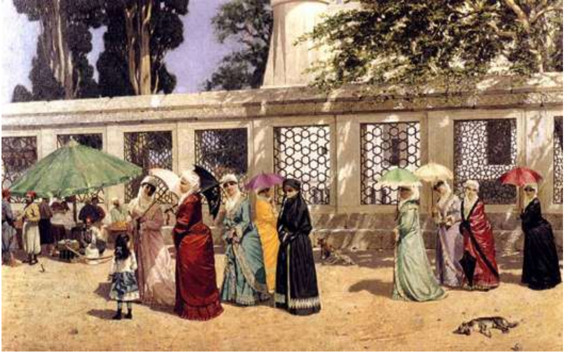
Resim 2: Gezintide Kadınlar 4