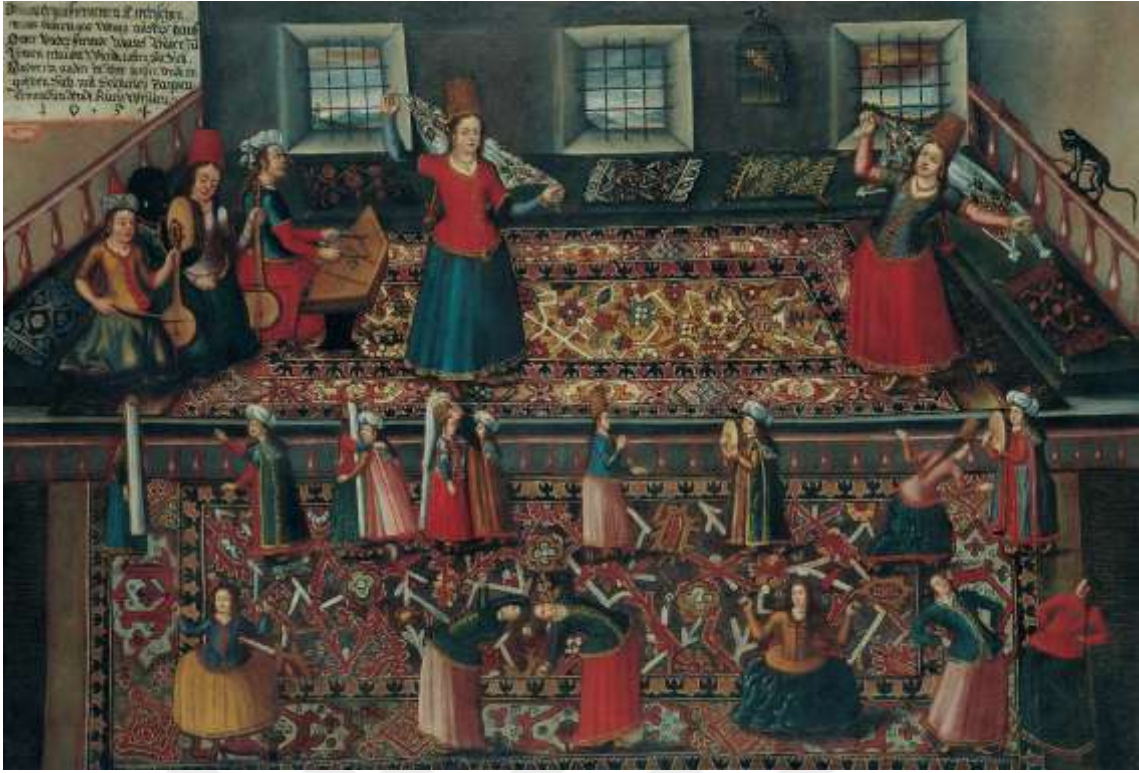
Resim 1:Türk Hareminden Bir Sahne 2

Osmanlı tarihinde kadınların kıyafetleriyle en çok ilgilenen padişah II. Abdülhamit olmuştur. 1889 yılında kadınlar saldırıya uğruyor diye feraceyi yasaklayan Abdülhamit bir yıl sonra da çarşafı yasaklamıştır. Bunun nedeni; Yıldız Sarayı'na çarşaf giyerek kaçak olarak giren erkeklerin varlığını öğrenip bir suikasta kurban gitme korkusuydu. Ancak kadınlar bu durumdan dolayı saldırıya uğramışlardır. Kadınların çarşaflarını çıkarmaları tutucu Osmanlı erkekleri tarafından kabul edilmemiştir ( https://www.youtube.com/watch?v=fuxaGKm17KI ).