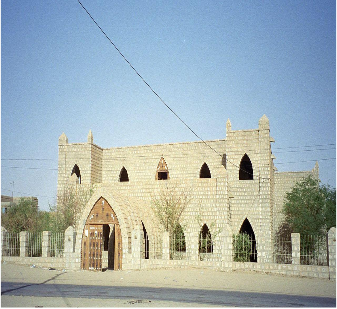
Mali Cumhuriyet tarafından inşan edilen Ahmed Baba et-Tinbuki Kütüphanesi (Meahed Ahmed Baba li't-Tâlim'il Âlî ve'l Buhûsi'l İslamiyye)