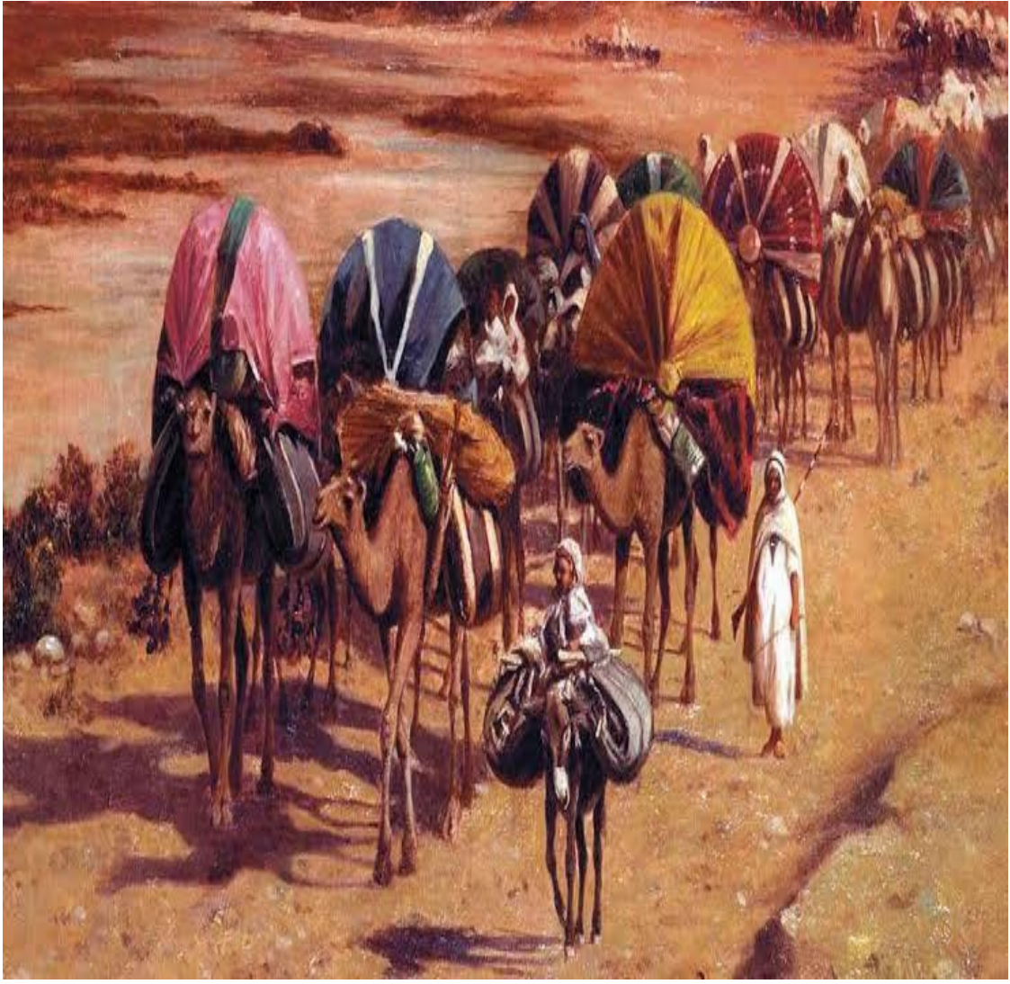
Dünyanın her taraftan özellikle Kuzey Afrika'dan Batı Afrikaya gelen Ticari Kervanlar.