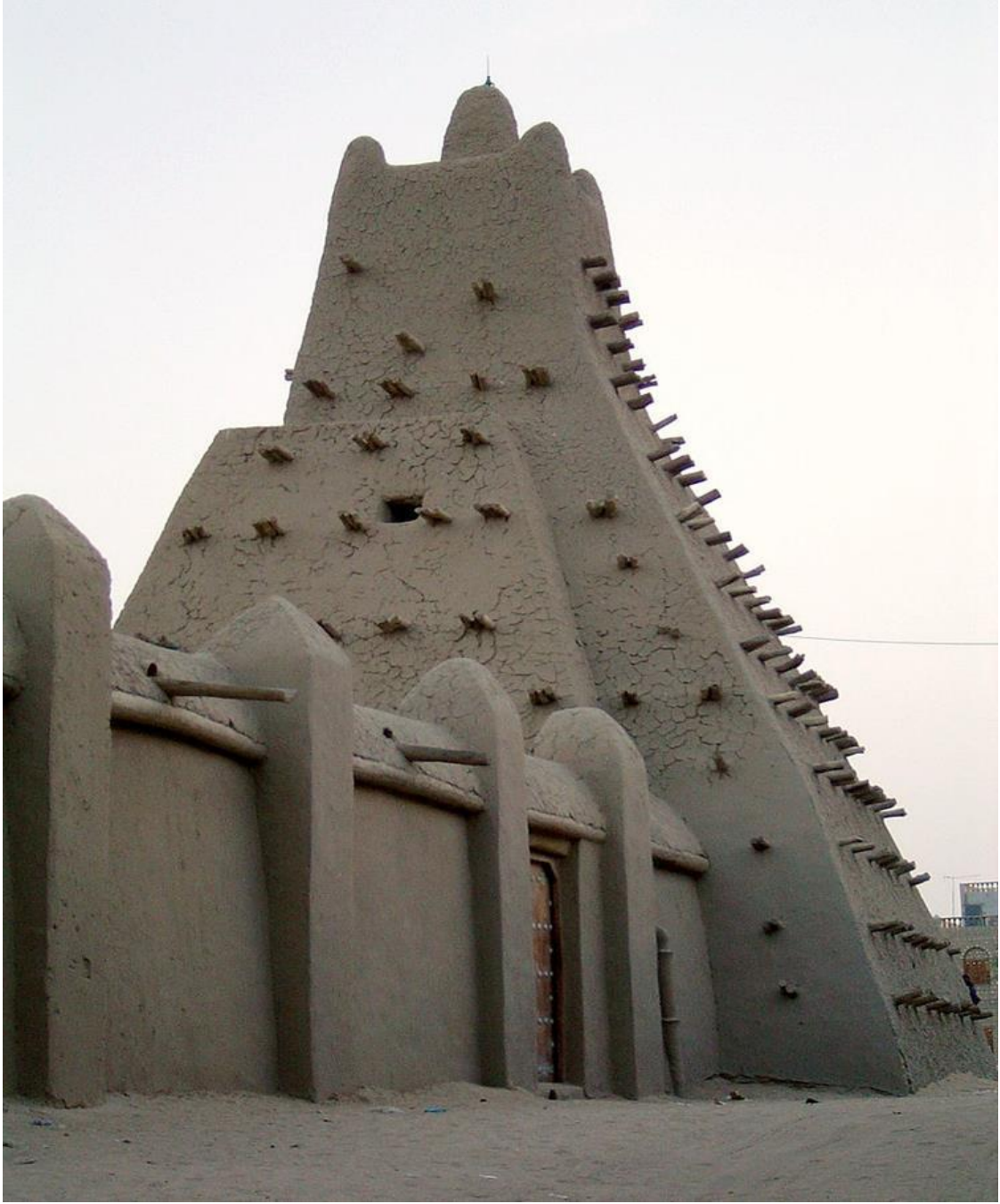
Sankorey Cami'nin mihrap