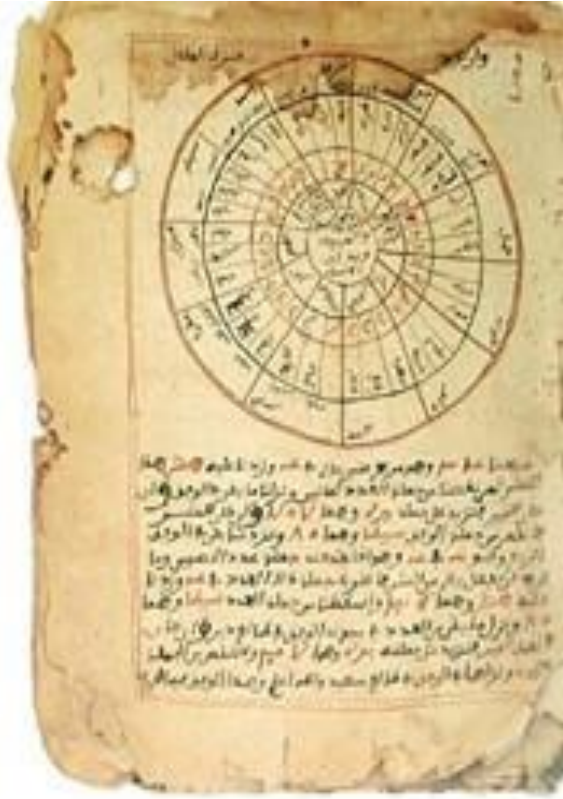
Kütüphelerde Binlerce Bulunmakta Olan Elyazmalarından Bazı Örneklerdir.