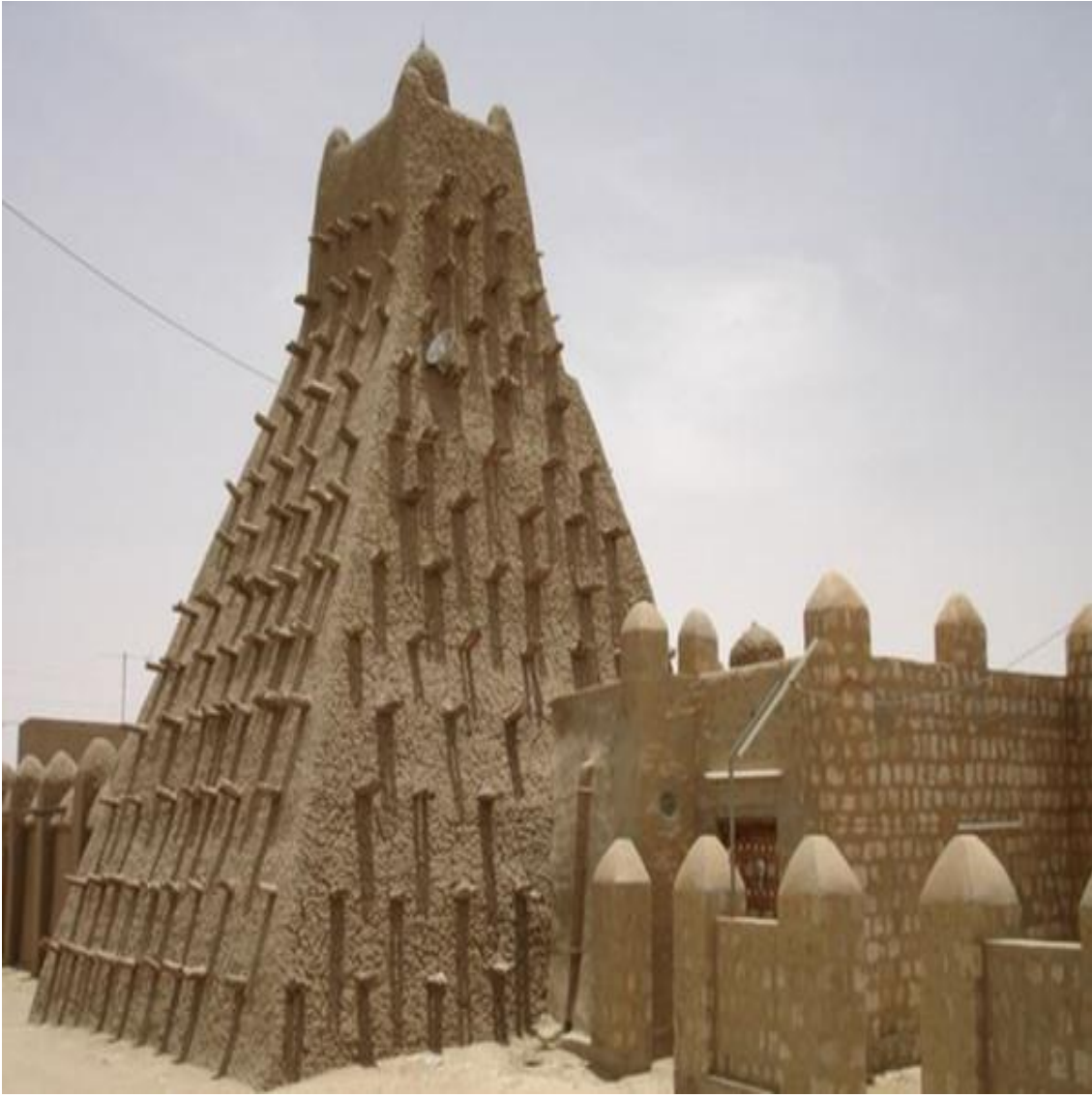
Sankorey Camii ve Yanındaki Sankorey Üniversitesi'nin Bir tarafıdır