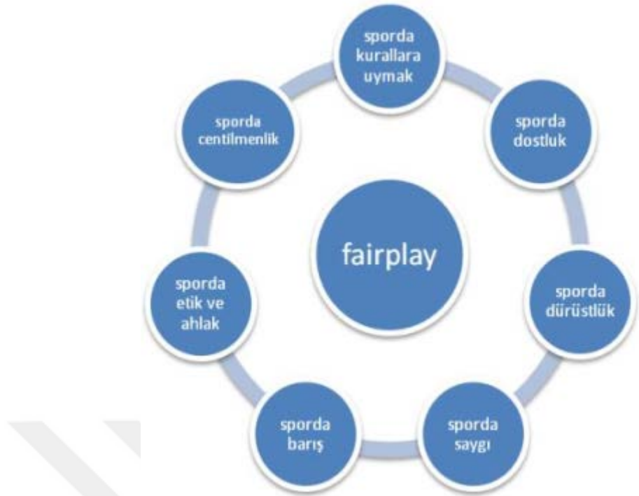
Şekil 2.3. Fair-play kavramı şematik gösterimi ve bileşenleri (Çoknaz, 2010)

Fair play, sporda erdem kavramıyla Türkiye'ye tanıtılmış ve daha sonra sporla ilgili tüm değerleri kapsayan bir spor erdemi olarak kabul edilmiştir. Türkiye Milli Olimpiyat Komitesi bünyesinde 1981 yılında kurulan Fair Play Komitesi, Türkiye'deki ilk fair play organizasyon yapısıdır. Kaleci Konya Derbentspor'un gol konusunda tereddüt eden hakeme topun çizgiyi geçtiğini söylemesi, onun adalet dalında bir ödüle layık görülmesine neden olmuş ve bu fair play kavramının 1983 yılında bu olayın gerçekleştiği Türkiye'de ilk başarılı dönemi olmuştur. Sonraki yıllarda birçok Türk sporcu spora olan davranışları veya katkılarından dolayı fair play ödülleri kazanmaya devam etmiştir (Çavdar, 2019).