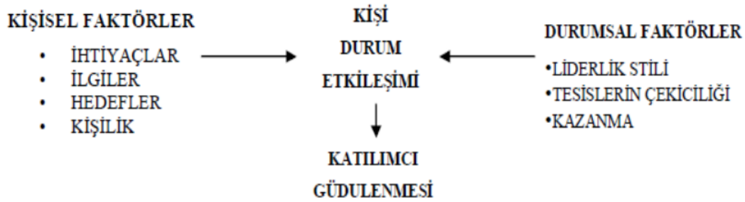
Şekil 2.2. Spora katılımı etkileyen faktörler ve aralarındaki ilişki (Esentürk, 2014)