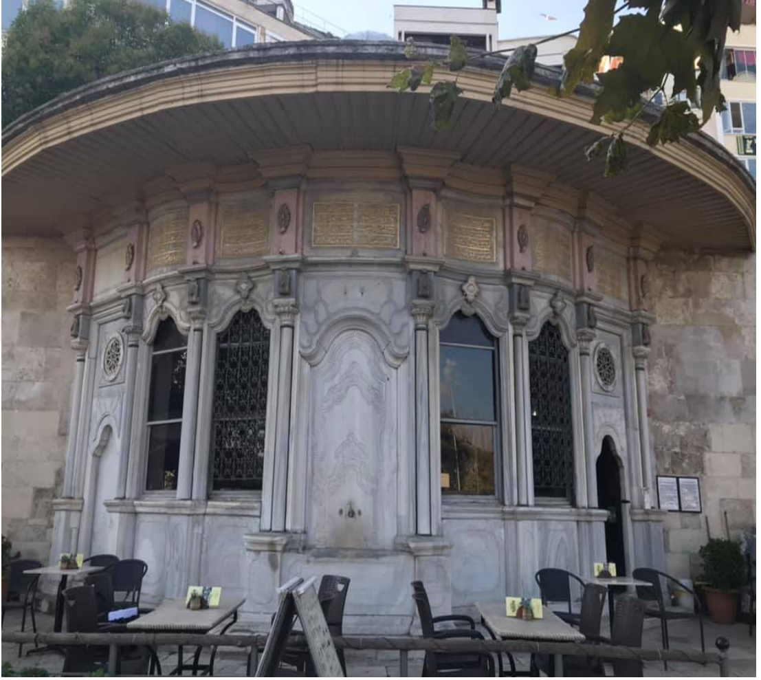
Ek-3: Koca Yusuf Paşa'nın Çeşme-Sebilinin Son Hali 469