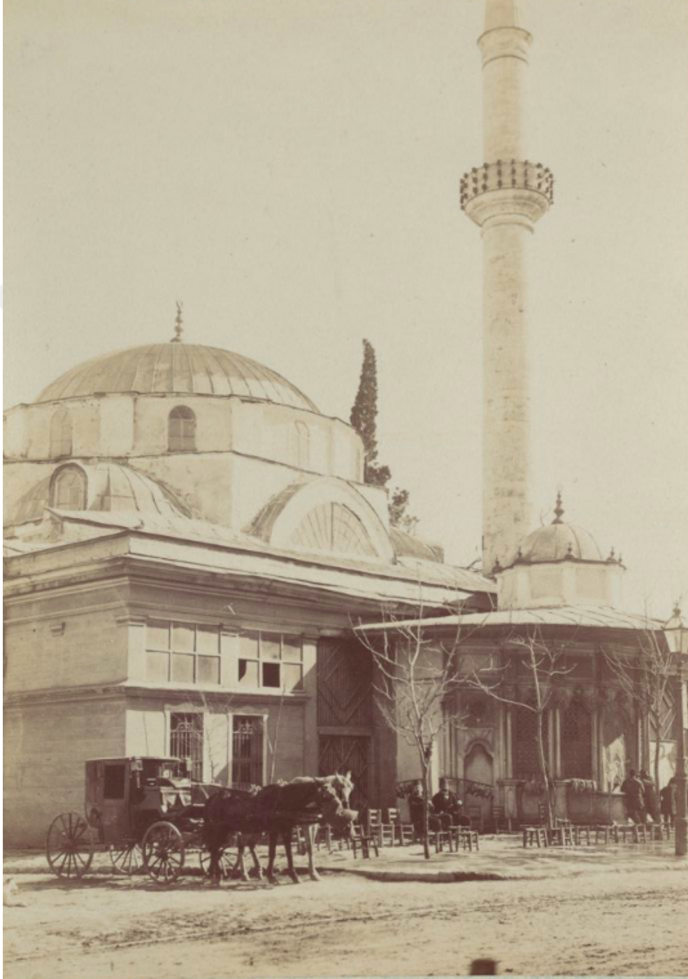
Ek-2: Koca Yusuf Paşa'nın Çeşme-Sebili'nin Molla Çelebi Camii Son Cemaat Yerinin Bitişine Taşınması. 468