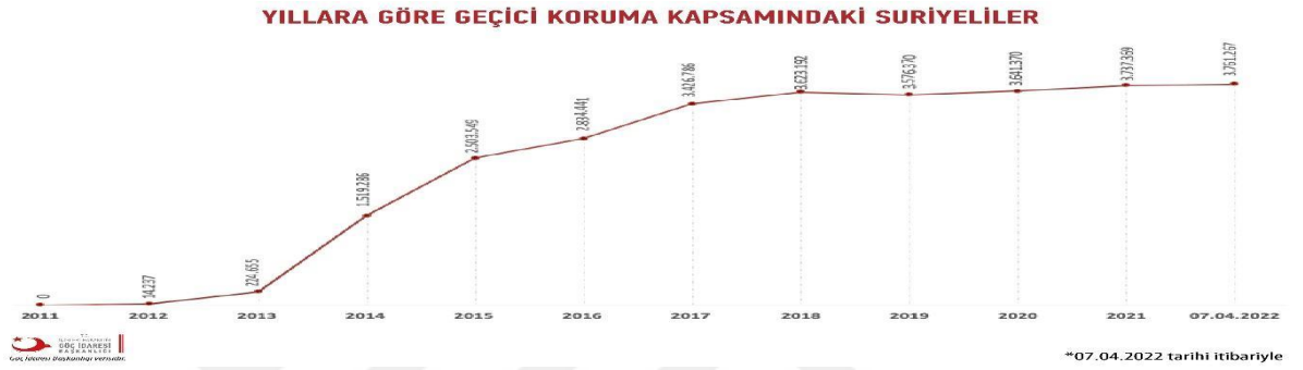
Şekil 1 Yıllara Göre Geçici Koruma Kapsamındaki Suriyeliler

( https://www.goc.gov.tr/gecici-koruma5638 )