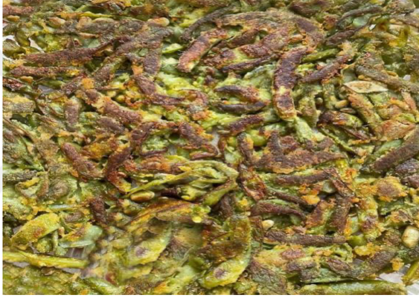
Fotoğraf 8: Bezelye Kızartması Bulgurlu Kara Lahana Dolması (K1, K21)