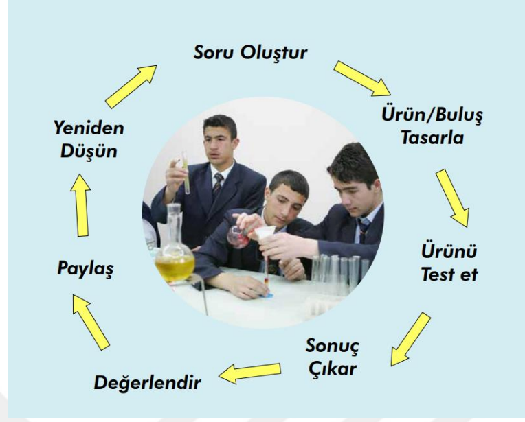
Şekil 3.1. STEM eğitimi öğrenme döngüsü (MEB, 2016).

Şekil 3.1’de de görüldüğü üzere ilk olarak bir problem/soru ile başlanır. Bu problem/soruya göre araştırmalar yapılır ve bir ürün/buluş tasarlanır. Ürün test edilir. Test başarılı ise bir sonuca varılır ve değerlendirilir sonrasında ürün sunulur. Ürün testi geçemezse süreç tekrar edilir yeniden düşünülür.