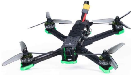
Şekil 2.2: Dört motorlu İHA (Quadcopter).

4 adet motoru bulunan insansız hava araçlarına ise dört motorlu İHA'lar yada Quadcopter denilmektedir.