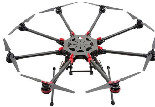
Şekil 2.4: 8 motorlu İHA (Octocopter).

8 adet motoru bulunan insansız hava araçlarına 8 motorlu İHA'lar yada Octocopter denilmektedir.