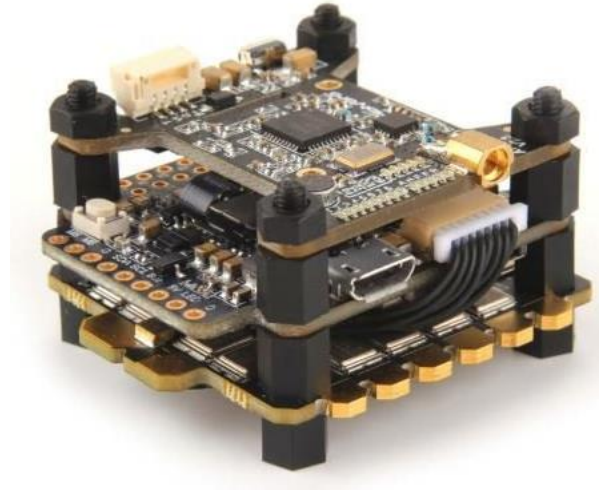
Şekil 2.7: Uçuş kontrolcüsü (Flight Controller).

Şekil 2.7’de de görülebileceği gibi iha’larda bulunan temel bileşenlerden uçuş kontrolcüsünün görevi, uzaktan kumandadan veya üzerlerindeki alıcılardan gelen sinyalleri iletmek yada elektronik hız kontrolcüsü aracılığıyla İHA’nın havada kalabilmesi için motorlara hangi hızda ve ivmeyle dönmeleri gerektiğini iletmektir. Bu çerçeveden yola çıkılarak iha’ların en önemli temel bileşenlerinin uçuş kontrolcüleri olduğu söylenebilmektedir (Hwang ve diğ., 2022).