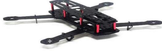
Şekil 2.5: Quadcopter gövde bölümü.

Quadcopter'lerin gövde kısımları iha'ların diğer temel bileşenlerinin sabitlendikleri ana bölümlerdir. İha'ların gövde boyutları, şekilleri ve üretildikleri hammaddeler ve malzemeler kullanım amaçlarına göre farklılık göstermektedirler. Örneğin yarış amacıyla imal edilen İHA'lar da yüksek manevra kabiliyetinin öncelikli öneme sahip olmasından sebep gövdeleri karbon fiberlerden üretilmektedirler (Yılmaz, 2022).