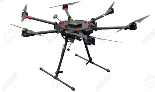
Şekil 2.3: Altı motorlu İHA (Hexacopter).

6 adet motoru bulunan insansız hava araçlarına ise 6 motorlu İHA'lar yada Hexacopter denilmektedir. Hexacopter'lerde, 4 motorlu İHA'ların sistemlerindeki gibi uçuş şekillerine göre (+) ve (x) yönde gövde yapısı ile uçuş şekilleri bulunmaktadır.