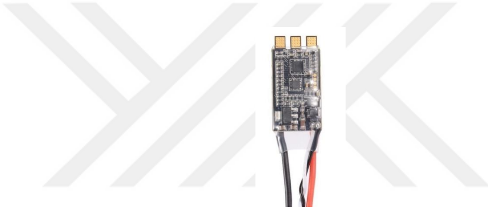
Şekil 2.8: Elektronik hız kontrolörleri (ESC).

İHA'ların bir diğer temel bileşenleri de elektronik hız kontrolörleridir. Elektronik hız kontrolörlerinin diğer bir adıysa ESC'dir.