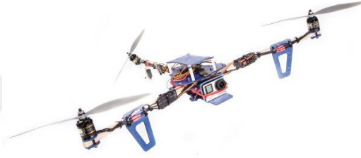
Şekil 2.1: Üç motorlu İHA (Tricopter).

Üç motorlu insansız hava araçları diğer bir adıyla Tricopter'ler havadaki hareketleri ve yapıları bakımından helikoptere benzeyen sistemlere sahiptirler.