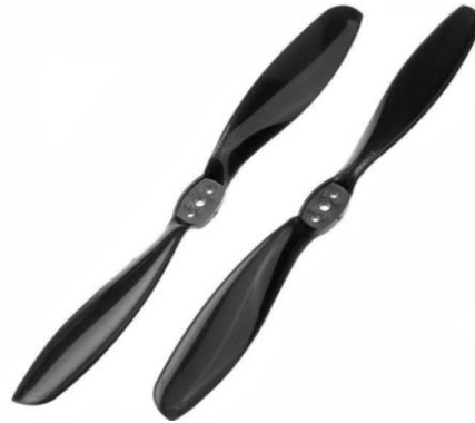
Şekil 2.6: İnsansız hava aracı pervaneleri.

İHA'ların ikinci temel bileşenleri olan pervaneler ise kullanım alanlarına göre bulunan pervane sayılarında değişiklikler görülebilmektedir. Bunun yanı sıra sadece sayıları değil pervanelerin şekilleri, boyutları ve pervane hammaddelerinde de değişiklikler yapılmaktadır. Pervanelerin temel amaçları ihaların uçmalarını sağlamak için hava akımı yaratmak ve itme gücünün üretilmesiyle iniş ve kalkış eylemlerinin yerine getirilmesini sağlamaktır. Aynı zamanda pervanelerin bir diğer görevleri de manevra kabiliyetlerini yönetmektir.