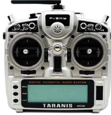
Şekil 2.9: İnsansız hava aracı kumandası.

İHA'larda kullanılan bir diğer temel bileşen ise kumandalardır. İha kumandalarının bir diğer adı da remote controller'dır.