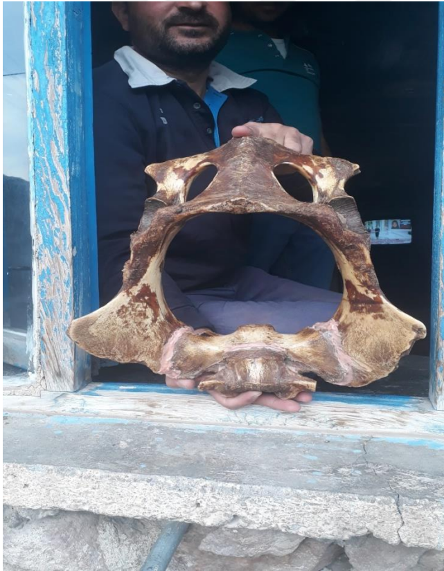
Fotoğraf 4: İçerisinden aydaş olan çocuğun geçirildiği bir deve kemiği.