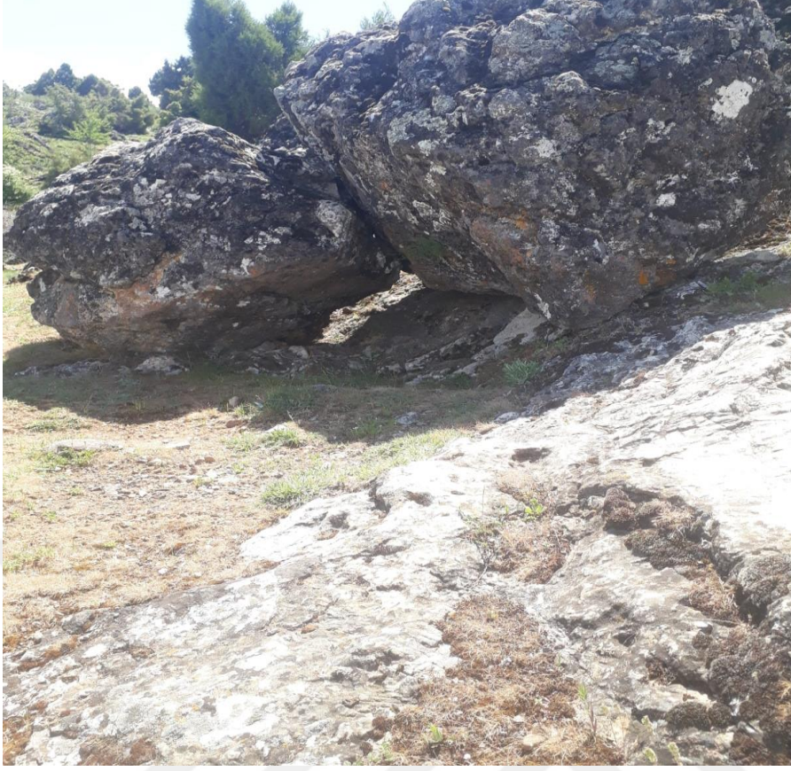
Fotoğraf 7: Gölyüzü Mahallesi'nde aydaş olduğuna inanılan çocukların geçirildiği delikli taş.