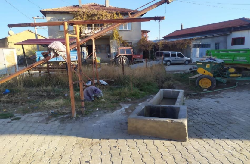
Fotoğraf 5: Akçalar Mahallesinde sürk hastalığının tedavisi amacıyla ziyaret edilen sürk kuyusu.