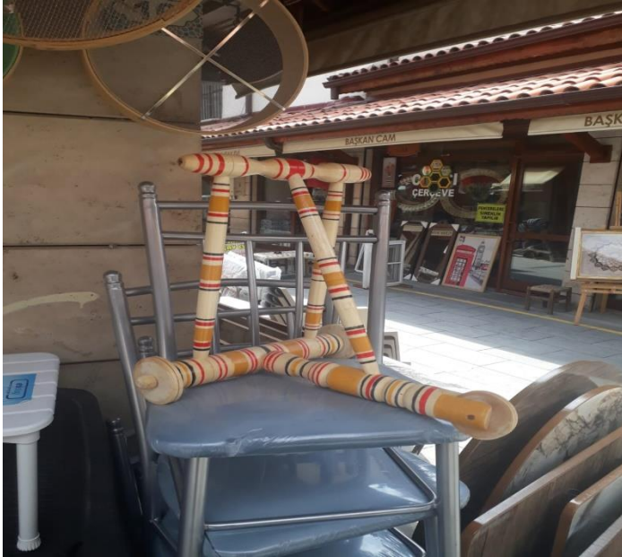
Fotoğraf 8: Çocukların tutunup yürümesini sağlamak amacıyla yapılan yürüteç. (Konya Bedesten Çarşısı)