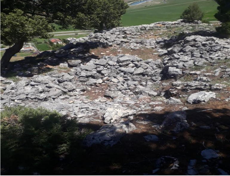
Fotoğraf 6: Gölyüzü Mahallesi'nde yatır olduğuna inanılan, dede olarak adlandırılan, sürekli ağlayan çocukların götürüldüğü yer.