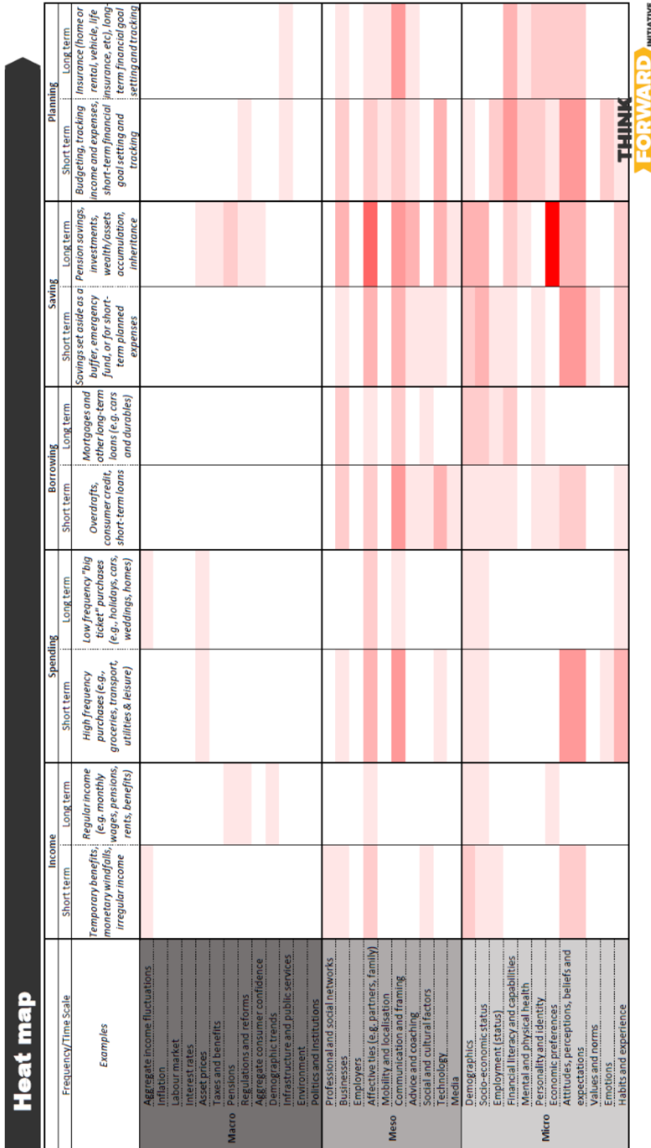
Figure 1: Research Heatmap Prepared by Think Forward Initiative