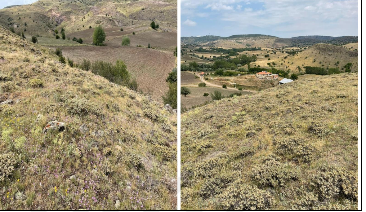
Şekil 3.2 Çalışma alanından görüntüler (Orijinal 2022)