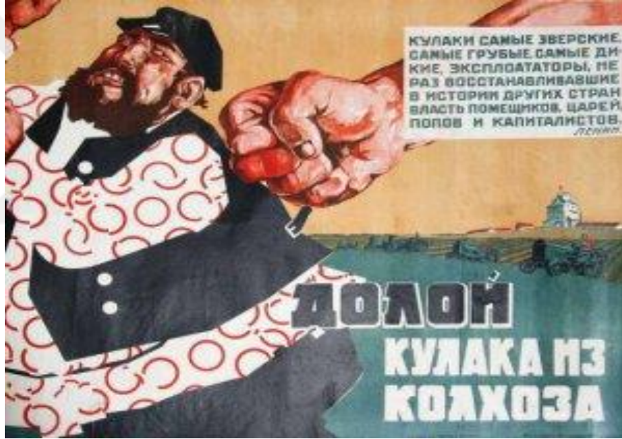
Resim 3. Kulaklara Karşı Propaganda Afışı