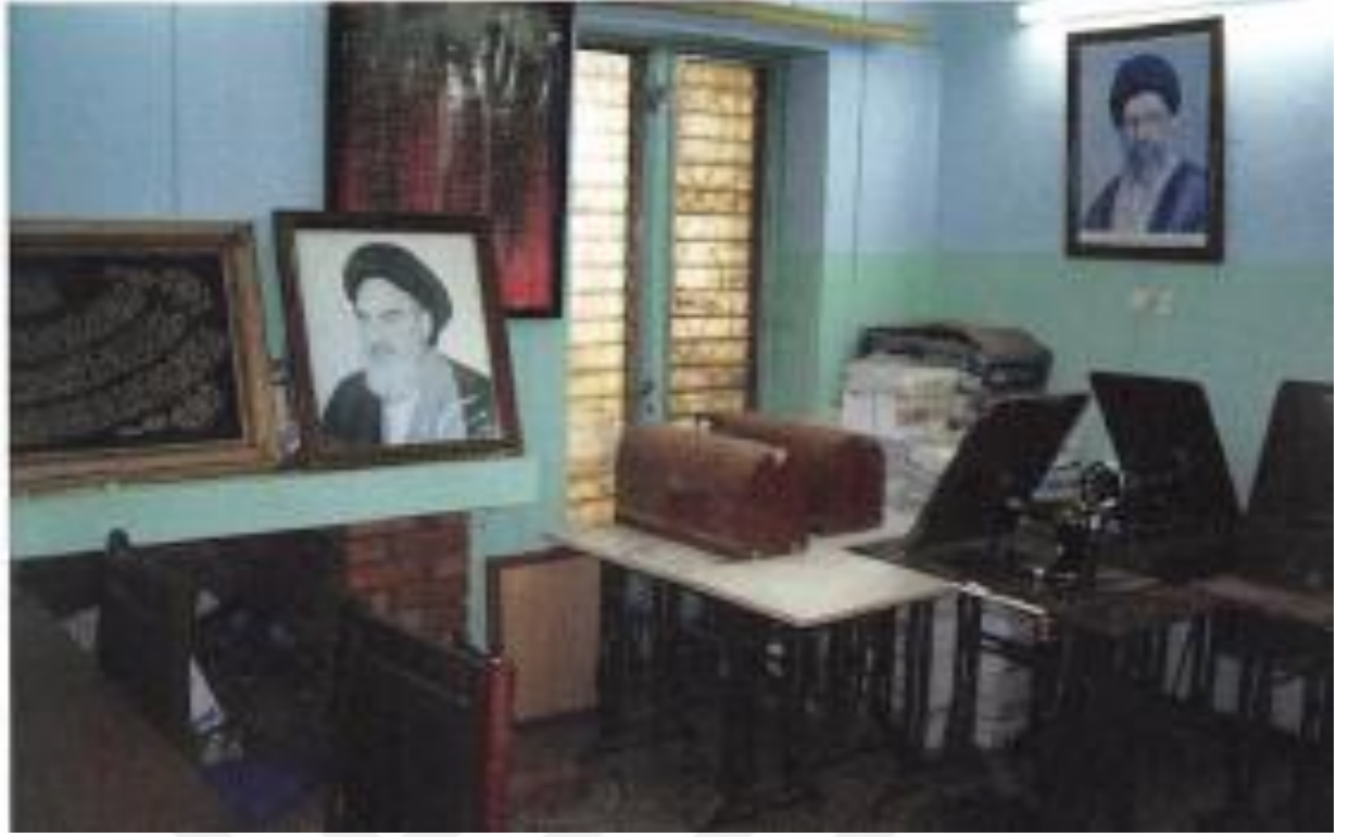
kadınların Dikiş Salonu bir Fotoğrafi. 341

Bundan başkaca İran İslam Kültür Merkezi içerisinde ayarlanan diğer bir bölüm ise kültür enstitüsüdür. Bu enstitüde Arap İslâmî okullarından lise kademesinde öğrencileri kabul ederek, merkezde dinî ilimleri, Şii fikhî usulü gibi alanlara dair öğretim yapılmaktadır. Bu enstitü Mali'deki Eğitim Bakanlığı'nın yasalara ve devlet tarafından okullara sunulan eğitim müfredatına uygun olduğu sebebiyle hükümet tarafından da resmi olarak tanınan liseler arasındadır. Bunun yanında, Arapça ve İslami derslerin yanında resmi devlet öğretmenleriyle fizik, kimya, matematik gibi pozitif bilim dersleri ve İngilizce gibi yabancı dil dersleri için sözleşme yapmışlardır. Ayrıca yabancı dil ve İslami derslerle birlikte bahsi geçen pozitif bilimlere yönelik derslerde de öğrenci eğitimi açısından çok başarılı olmaktadır.