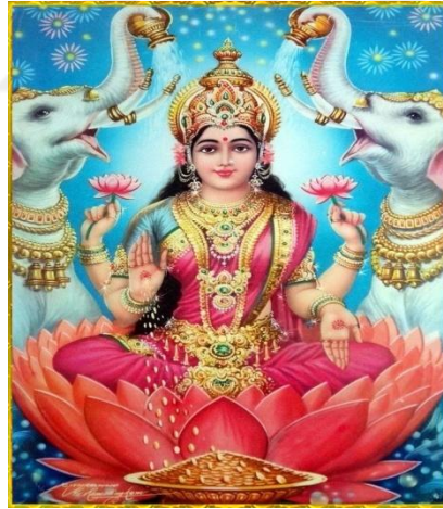
Resim. 1.2: Lakshmi tasvirlerinden biri.