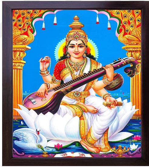
Resim. 1.1: Saraswati tasvirlerinden biri.