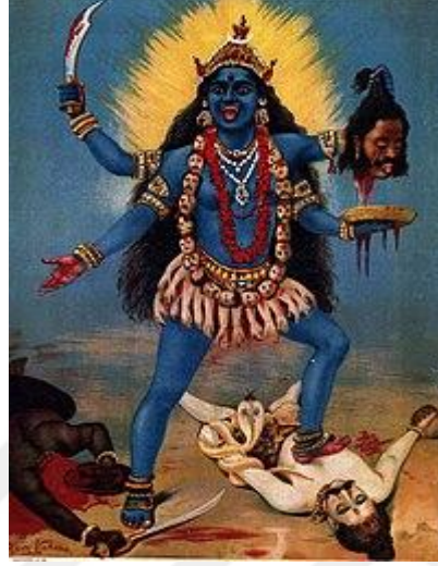
Resim. 1.4: Kali tasvirlerinden biri.

Kaynak: https://artsandculture.google.com/asset/goddess-kali-ravi-varma-press-karla-lonavala/iAHNImEWSOYQeg