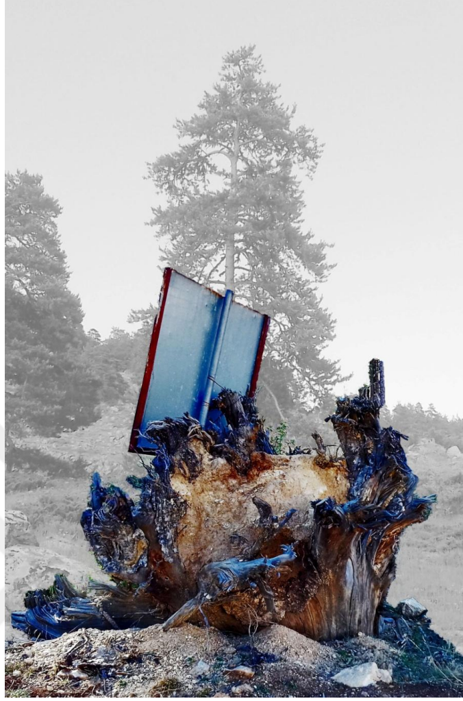
Görsel 20. Şerife Şen Akkaş. Satılık / For Sale. 2021. (Dijital Kolaj, 100 x 65 cm)

Satılık adlı çalışma (Görsel 20) doğadaki nesnelerin bir meta haline getirildiği, ait oldukları yerlerden kopartılarak kapitalizmin hızlı tüketiminin bir parçası haline getirilen doğanın tüketilip yok edilmesine bir tepkiyi dile getirmektedir. Bu iş daha çok para kazanmak uğruna inşaat tüccarlarına satılan arazilerin iç çekişmesidir. Doğaya dair hiçbir yasanın gözetilmediği, zeytinlik arazilerin bile yapılaşmasının önünü açan kanunların yasalaştığı ülkelerde yazık ki daha çok kirli hava solumaya, gri beton parçaları görmeye mahkûm edilmekteyiz. Dijital kolaj tekniğinin kullanıldığını çalışmada; arazide önce kesilmiş sonra da yol kenarına bir moloz yığını gibi bırakılmış bir kök kütlesi bulunmaktadır. Artık ait olduğu ormandan koparıldığı için arka plan gri renkte bırakılarak eski bir anıya ait olduğu vurgulanmıştır. Kökün arkasında görülen metal tabela akadaki arazinin de satılık olduğu düşüncesini kuvvetlendirmektedir.