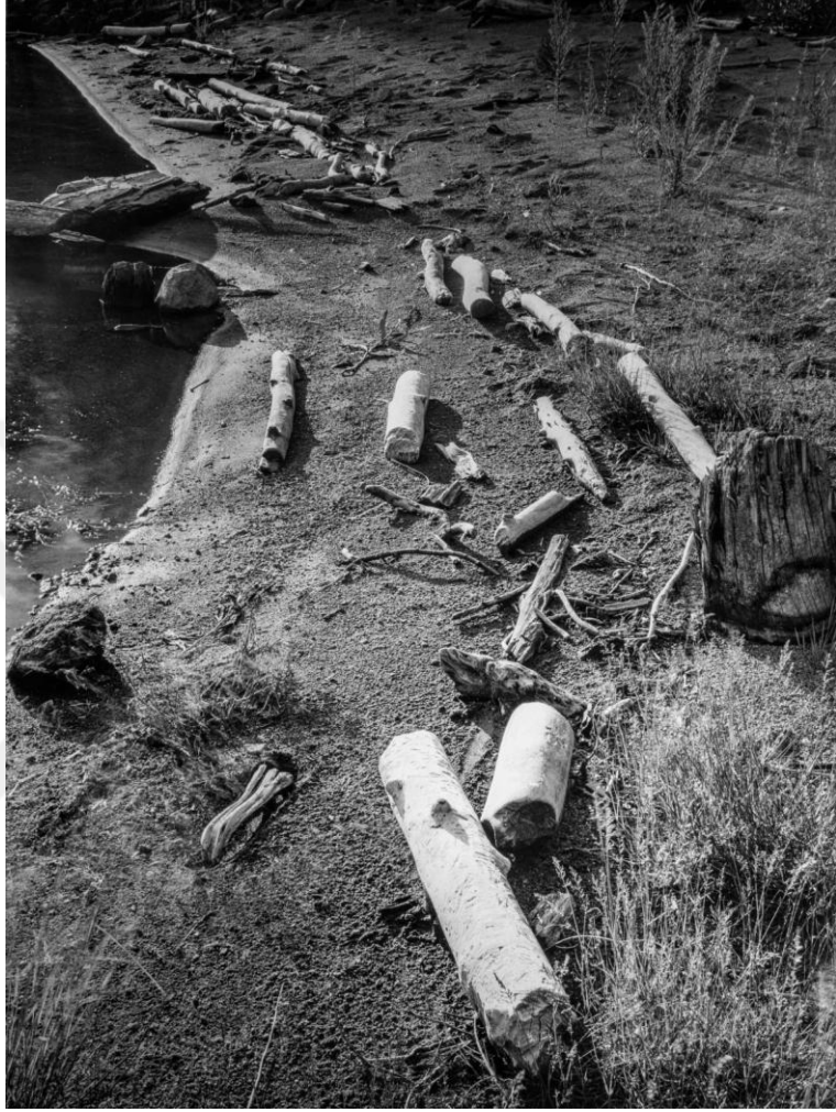
Görsel 23. Kırk P.Conrad. Mezarlık. 1981.Electra Gölü.21/4x 31/4 Panatomix X

çevresindeki ağaç katliamını fotoğraflamıştır (Görsel 23). O günlere ait bir belge niteliği taşıyan fotoğraf, doğaya karşı bakış açımızı değiştirmemiz gerekliliğini hatırlatmaktadır.