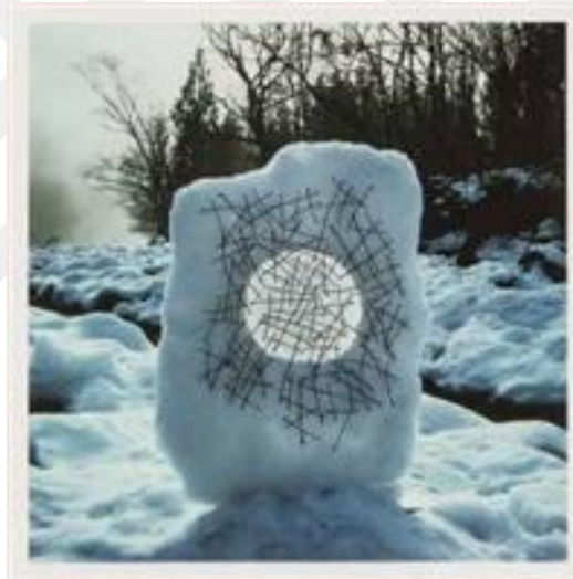
Görsel 2. Andy Goldsworthy. Foggy sun breaking through just as I finished / Bitirdiğimde sisli güneş kırılıyor, 1987. (Kalın kağıda basılmış cibachromeprint, 74.8 x 74.8 cm)

Andy Goldsworthy, doğanın değişiminden aldığı izlenimlerle enstalasyonlar üretmektedir. Yaprak, taş, buz gibi tamamen doğal malzemelerle işler oluşturmaktadır. Doğanın geçiciliğinden etkilenecek ürettiği işleri de zamanla dönüşüme uğramakta ilk halindeki görünüşleri değişmektedir. Sanatçının 1987 yılındaki Foggy sun breaking through just as I finished , adlı çalışmasında buz eridiğinde çalışma da eriyip yok olacaktır (Görsel 2). Bu çalışma ile entropinin düzenden düzensizliğe gitme eğilimine vurgu yapmaktadır. Kullanılan malzeme taş bile olsa rüzgarla zamanla aşınıp yine farklılaşacaktı, buz olduğundan dolayı güneş ısıyla daha hızlı aşınıp eriyip kaybolacaktır.