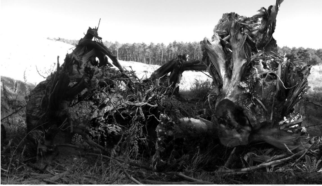
Görsel 35. Şerife Şen Akkaş. Hassas Kaos / Sensible Caos. 2021. (Fotoğraf Üzerine Dijital Kolaj, 70 x 125 cm).

34) adlı dijital baskı çalışmasında iş makinelerinin açtığı yol ve yığın halinde toprak ile üzerine atılmış ağaç kalıntılarını görmekteyiz. Bu duruma eleştiri niteliğinde organik bir görüntüye üç eşit parça halinde dikey şeritler eklenerek, alanın yabancılaştırıldığı yeni düzen için değiştirilerek dönüştürüldüğüne işaret edilmek istenmiştir.