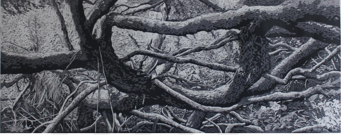
Görsel 17. Şerife Şen Akkaş. Fırtına Sonrası / After the storm. 2020. (Ağaç Baskı, 50 x 125 cm)

ağaca ait olduğu anlaşılan kökün ölümüne vurgu yapılmıştır. Ağacın kesilmiş gövdesi kuruyan kökleri ile toprakla bütünleşmiştir. Yıllarca sular altında kalan toprak bile özelliğini kaybetmiş verimsiz kumlu bir alana dönüşmüştür. Resmin atmosferine yayılan gri renk her an gelecek bir fırtınanın habercisi gibidir. Bu hissi güçlendiren resmin arka planındaki spontane fırça darbeleridir.