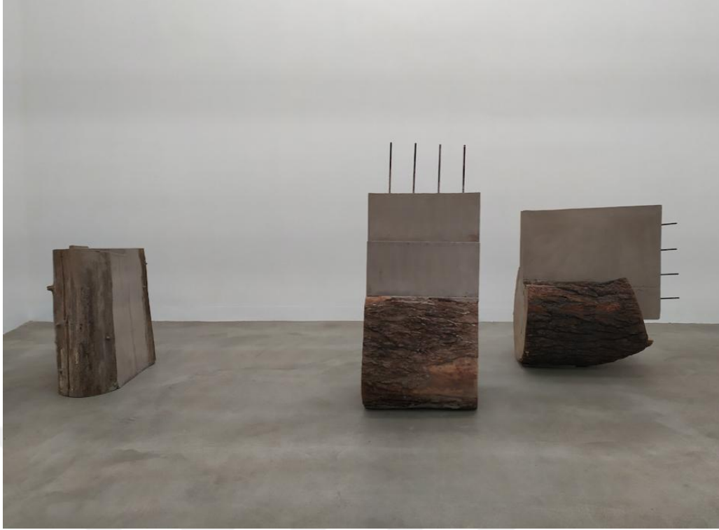
Görsel 18. Stefano Canto. Caries / Çürüme. 2021. (güçlendirilmiş sıkı ahşap, 80x60x140 cm, Photo Courtesy of the artist and Matèria, Roma. Fotograf: Roberto Apa) https://bit.ly/3PaVo7L

Aldığı mimarlık eğitiminin etkilerini sanatı ile buluşturan Stefano Canto, nesnenin şematiği ve bağlamı etrafına odaklanarak doğal çevre, kentsel mekân ve insan etkileşimi arasındaki ilişkiyi sorgulamaktadır. Sanatçının 2017 yılında yaptığı çalışmasında betondan oluşturduğu ağaç kütüklerini bir inşaat malzemesi olan beton bloklarla bütünleştirmiştir. Sergi projesine ismini veren Caries / Çürüme (Görsel 18) adlı çalışma üzerinde 2009 yılından beri çalışmalarını yürüten sanatçı 2021 yılında çalışmasını sergileme olanağı bulmuştur. Sanatçı "Caries" sergi başlığı ile botanik biliminde çürüme ile ilişkilendirilen bitki bozulumuna neden olan bir çeşit parazite atıfta bulunmaktadır. Sanatçı bu ağaç gövdelerinin içinin tamamen çürüyüp aşındırmasını gerçekten gözlemlemiştir. Çürüme ile bozulan ağaç kütlesini beton ile buluşturarak yepyeni bir oluşum yaratmıştır ( https://www.juliet-artmagazine.com/en/carie-stefano-canto-solo-show-opens-new-materia-gallery-location , Erişim: 22.03.2022).