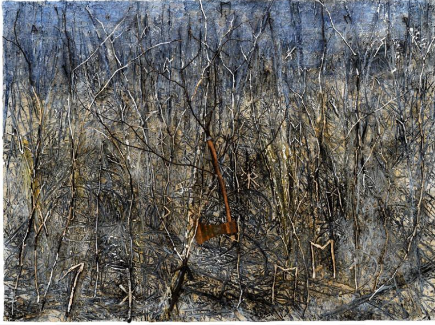
Görsel 6. Anselm Kiefer. Der Gordische Knoten / Gordion Dügümü Serisi. 2018. Photograph: Georges Poncet/courtesy White Cube https://bit.ly/3uPINyE

Sicim teorisi, kuantum düzeyinde evrenin işleyişini anlamaya çalışan matematiksel bir modeldir. Kiefer, sicim teorisinin bağlılığı ve karmaşıklığından yola çıkarak Gordion Dügümü serisini görselleştirdi. Aykırı düşünce niteliğinde olan bir döngüsellik vizyonu geliştirdi. Hem başlangıç hem de son, biçim ve "biçimsizlik", çürüme ve yeniden doğuş, dünya sınırlarının ötesindeki gizemli döngülere vurgu yaptı