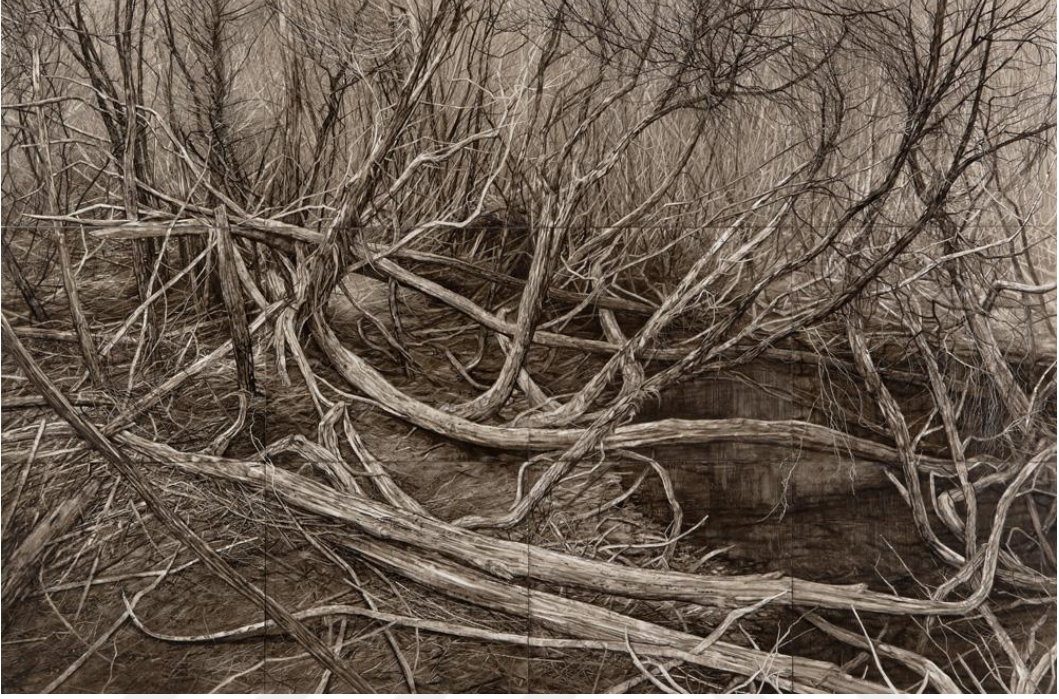
Görsel 14. Nicholas Blower. After the Flood / Taşkın Sonrası. 2014 (Panel üzerine yağlı boya, 120cm x 100cm (overall). https://bit.ly/3aEmEwq

Gelişimin her zaman iyi yönde olmadığına, kayıtsızlık vurgusu yapılmaktadır. Zararın önlenebilirliğine, bilimin doğaya uyumunun nasıl gelişebileceğinin sorgusu yapılmaktadır.