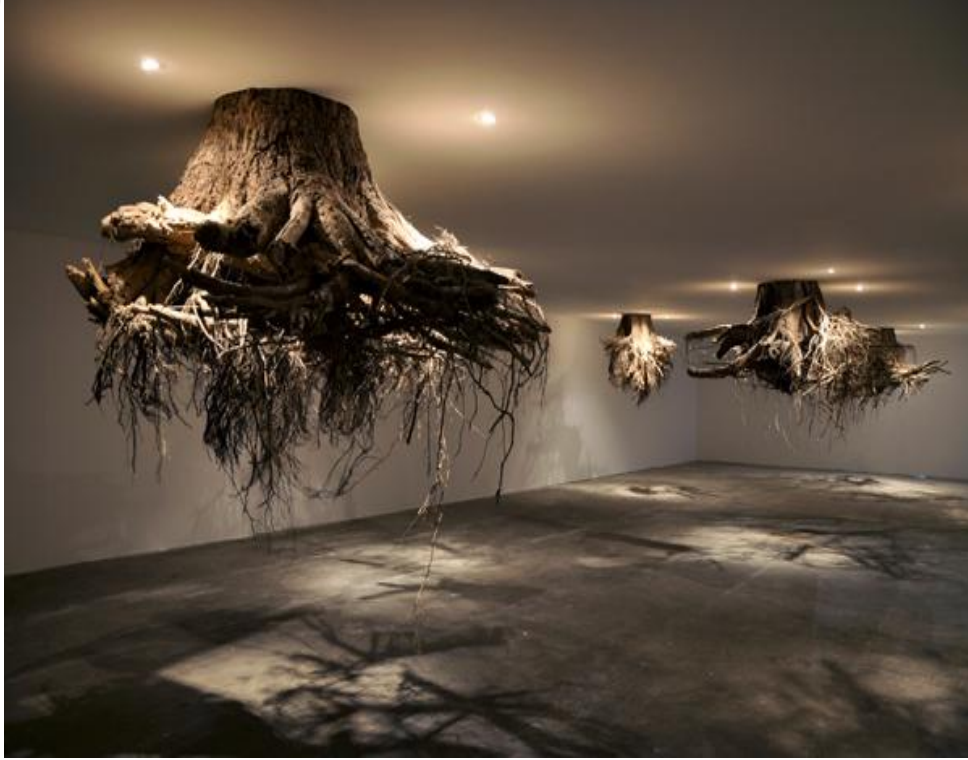
Görsel 21. Giuseppe Licari. Humus / Humus. 2015. In de Luwte van de Tussentijd, 35th Kunsten Festival Watou, Belgium.(Ortam Odaklı Enstalasyon, Ağaç Kökleri, Halojen Lambalar) https://bit.ly/3uQkuQU

Son yıllarda büyük markaların mağazalarında yüksek fiyata, dekoratif sehpa olarak satılan ağaç kütükleri görmekteyiz. Hayatı boyunca bu kadar büyüklükteki gerçek bir ağacı yakından görmemiş, onun yaşamına tanık olmamış, gövdesinde köklerinde ne kadar farklı canlı türleri yaşadığını hiç hayal etmemiş insan, kesilip öldürülmüş bir ağaç kütüğünü evine süs diye alabilmektedir. Bu durumun avlanıp evin duvarına asılan geyik boynuzlarından bir farkı yoktur. Kendi gerçekliğini unutarak doğaya iyice yabancılaşan insana kapitalist düzen tarafından sunulan her doğal nesne onun avuntu aracıdır. Bu çalışmada da kapitalizmin sermayesine kurban edilen tüm doğayı temsilen bir ağaç kökü sapasağlam karşımızda durmaktadır. Yok edilişin güçlü tanığı olan bu kök parçası insanın doğaya yabancılaşmasını da yansıtmaktadır.