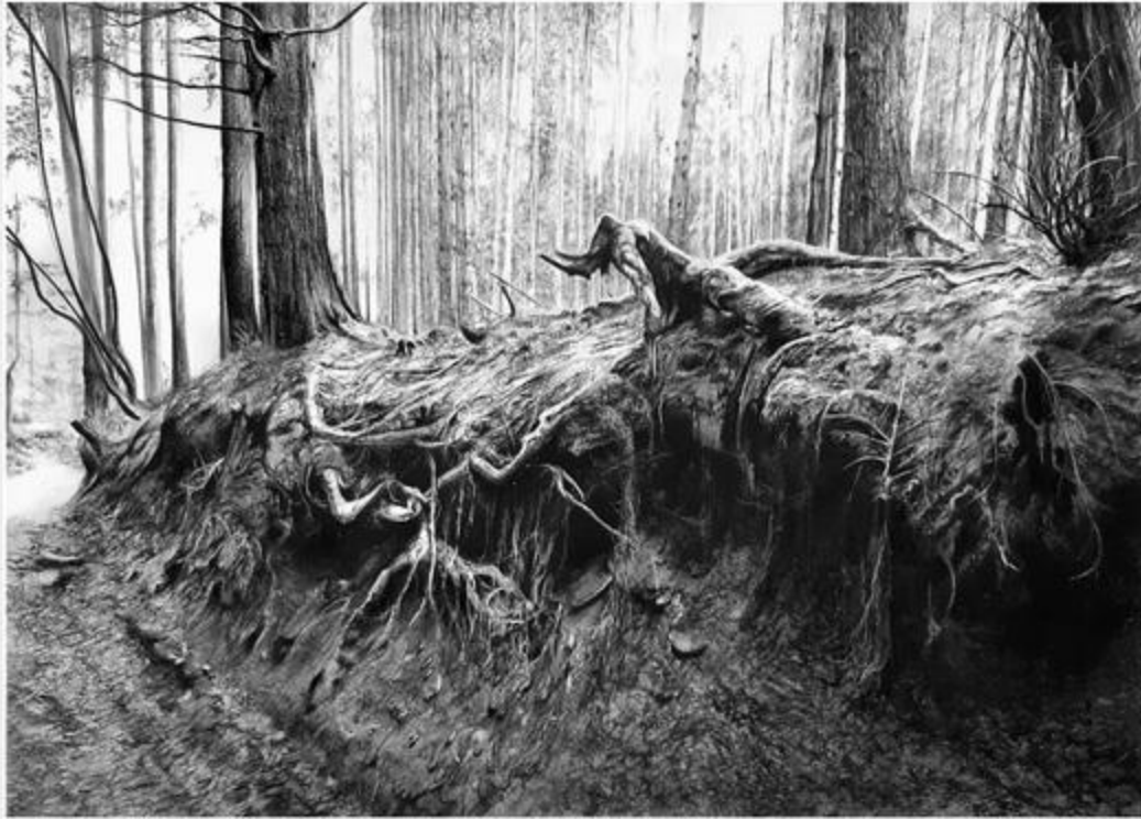
Görsel 5. Kees van der Knaap. The path through the mountain 2 / Dağın içinden geçen yol 2. 2021 (Kağıt Üzerine Pastel Boya, 210 x 120cm) https://bit.ly/3IEgV6a

uyandırmaktadır. Ayak basılmamış coğrafyalar da bile insan müdahalesinin izlerini görmemiz olasıdır. Kırılğan Topografya Serisinin 9.parçası olan çalışmada; (Görsel 4) biçimsel olarak fotoğrafın tam merkezine yerleştirdiği buruşturulmuş kağıt parçası ile doğadaki bozulmayı kırılğanlığı ifade eder. Çektiği manzaralarda şu anda bozulmanın olmadığı ancak zamanla el değmemiş coğrafyalarda bile insan etkisinin hızlandığının kanıtını düşündürür. Buruşmuş bir kağıt parçası asla eskisi gibi dümdüz hale gelmez. Aynı şekilde bozulan bir doğa da artık eski güzelliğinde olamaz. Sanatçı da Kırılğan Topografyalar serisi ile doğadaki bozulma ve kırılğanlığa, bir kere bozulduktan sonra doğanın geri döndürülemez yok oluşuna dikkat çekmektedir. Ormanın tam merkezindeki buruşturulmuş kağıt parçası, başka bir mekana açılan zaman tüneline düşündürmektedir.