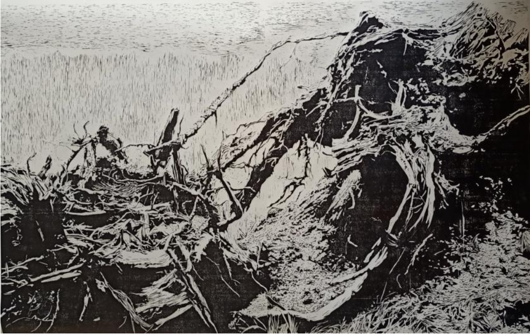
Görsel 43. Şerife Şen Akkaş. Belleğin İşgali / Occupy of Memory. 2019. (Belleğin İşgali adlı çalışmadan kalan kalıbın yeni kağıda basılan son görüntüsü. Ağaç Baskı, 81,5 x 216 cm).

yıkıntı ve doğadaki bozulmanın görüntüsü bulanık ve karanlıktır, bu görüntü çalışmalarda estetik bir ifadeyle sunulmuştur. Çalışmaların ilk bakışta ağaç baskı tekniği ile yapıldığının anlaşılması istenmiş olup, tek kalıptan eksiltme yöntemi ile çok renkli baskı resimler yapılması, üst üste gelen boya katmanları ile zengin bir görüntü elde edilmesi hedeflenerek bu amaca ulaşılmıştır. Çevre bilimci gibi doğayı tanımaya çalışmak ve araştırma yapmak sanatsal üretim yolculuğuma katkı sağlamıştır. Özellikle ağaç baskı çalışmalarında resmin son katı basılıp bittiğinde kalıba siyah renk verilerek yeni bir kağıda baskısı alınmış ve kalıbın kalan son görüntüsü de imge halini almıştır. Tasarlanan asıl resimde üst üste basılan renklerle oluşan kütlelilik, eksilen son kat siyah renk olarak basıldığında da korunmuştur (Görsel 43).