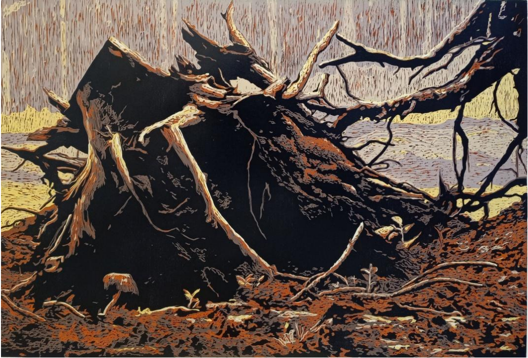
Görsel 37. Şerife Şen Akkaş. Entropi / Entropy. 2020. (Ağaç Baskı, 75 x 110 cm).

Doğada yaşanan trajedi normal bir şey gibi algılanmaya başlayıp günlük rutinelere karışarak normalleşiyor.