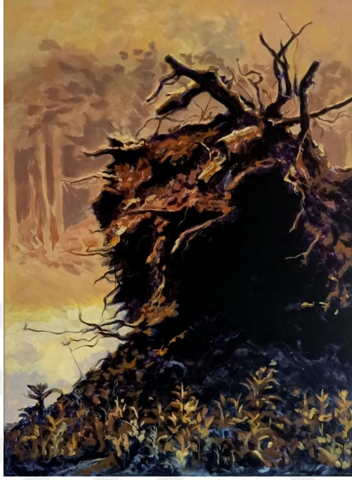
Görsel 24. Şerife Şen Akkaş. Yankı / Echo. 2021. (Tuval Üzerine Akrilik Boya, 110 x 80 cm).

2021 yılında Antalya'da çıkan orman yangınından etkilenerek yapılan Yankı adlı (Görsel 24) çalışmada Görsel 22'deki görselin aksine ormanda başlayan yangın anı sıcak renklerle ifade edilmiştir. Resimde yangının kızgınlığını, her tarafı kaplamasına an kala durumunu ve büyük kök parçasına yansımaları görmekteyiz. Yangının başlaması ile etrafa yayılan dumanın gri rengi henüz başlayan yangının rengine karışmış gibidir. Yanarak acı çekmekte olan yakındaki ormanın yankısı köke sirayet etmekte, içten içe sıcaklıkla kendi yangınına başlatmakta olduğu görülmektedir. Ölmekte olan bir kökün kalan toprağında yeniden filizlenmeye yüz tutan bitkiler ise umut ve entropi ikilemine ışık tutmaktadır. Kökün karanlık alanları bilinmezliğe ve her şeyin yangınla kül olup biteceğine vurgu niteliği taşımaktadır.