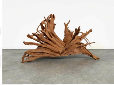
Görsel 9. Ai Weiwei. Roots / Kök. 2019.OCA Sao Paula, Fotograf: Carol Quintanilha https://bit.ly/3ciUVSj