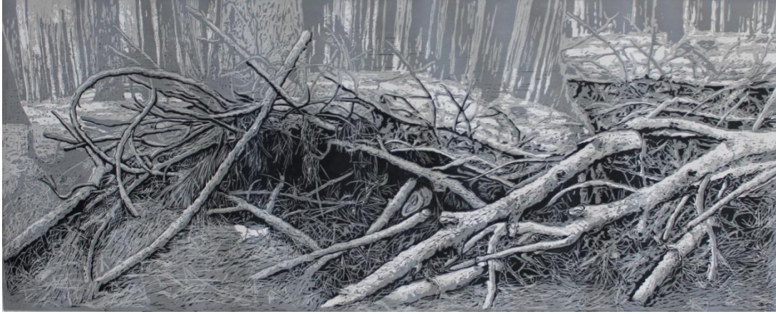
Görsel 32. Şerife Şen Akkaş. Sığınak / Shelter. 2018. (Ağaç Baskı, 50 x 125 cm).

Modern toplumda bireyselleşen insan, sorunlarla yüzleştğinde onlardan kaçacak bir yer arayışına girer. Bu yer bazen daha çok sosyalleşeceği bir mekân, bazen tek başına kalacağı bir oda bazen de rahatlayıp nefes alabileceği doğa olur. İçinde bulunan tüm canlılarla insana kucak açan doğa, ağaç yapraklarının hışırtısı, çam iğnelerinin kokusu ile huzur verir. Dertlerimden uzaklaşıp huzur bulduğum duygusal bir sığınak olarak gördüğüm bu ormanlık alanda (Görsel 32) her zaman ruhumun yenilenip dinginleştiğini hissederim. Ormanın saklı ruhu ile buluşur aslında canlı olan ağaç gövdelerine sarılarak acımı, üzüntümü onların devasa gövdeleri ile buluştururum. Onlarla bir olur, bütün ormanın şarkısını ruhumun derinliklerinde hissederim.