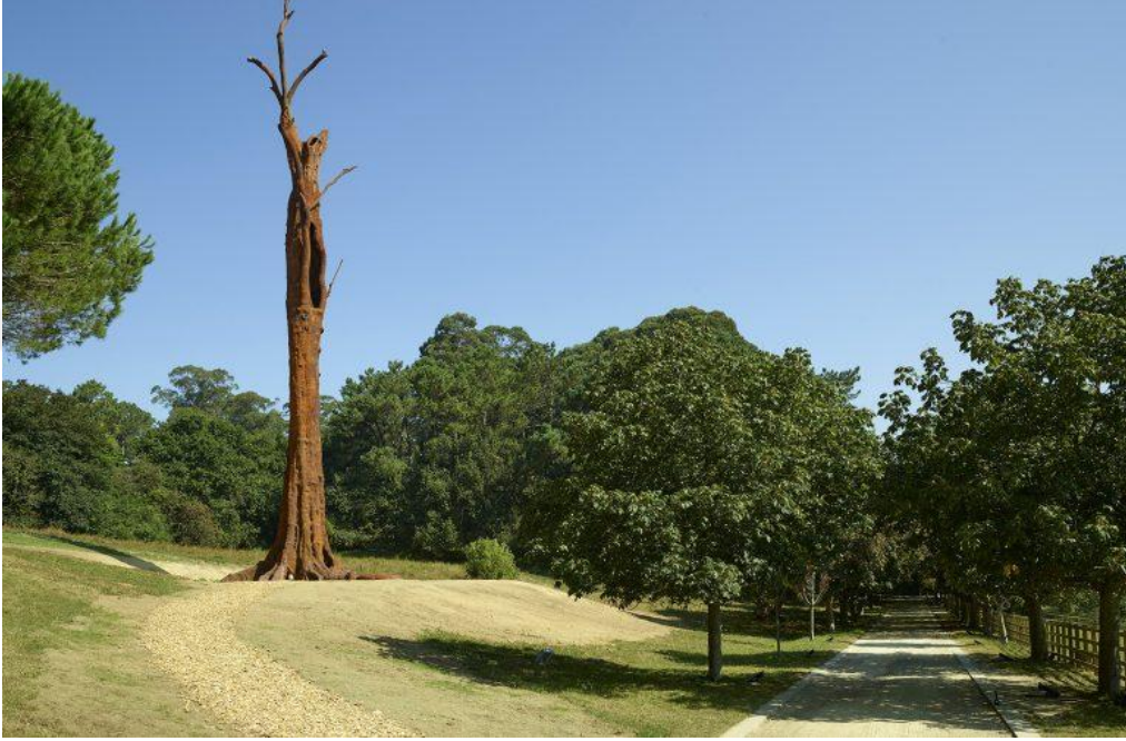
Görsel 11. Ai Weiwei. Entreçalar/ Pequi Vinagreiro / 2022. (Parçası 30 metreden yüksek ve yaklaşık 54 ton ağırlığında demir döküm. Serralvas Müzesi ve Parkı) https://bit.ly/3PzEQpL

Amazon Ormanlarının derinliklerinde yaşayan henüz keşfedilmeyen birçok canlı türünün yaşadığı sanılmaktadır. Yangınlar bu canlıların habitatına zarar vermekte geleceklelerini tehlikeye atmaktadır.