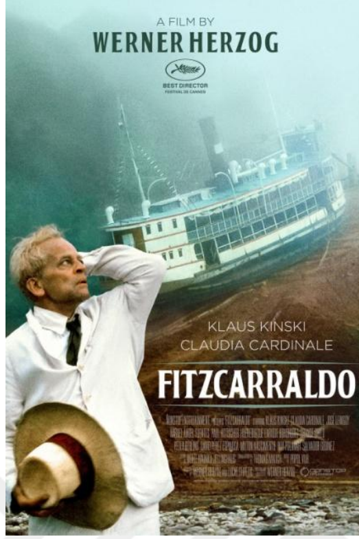
Görsel 12. Werner Herzog. Fitzcarraldo. 1988. (Film). Cannes Film Festivali https://bit.ly/3z90b3Q

Herzog, çektiği filmler ve sıradışı yaklaşımı ile cesur bir yönetmendir. Bizlere ütöpik gelen fikirleri hayata geçiren ve bunları yaparken de dijital yöntemler kullanmayan, olanakları zorlayan bir sanatçıdır. Werner' 1982 yapımı Fitzcarraldo (Görsel 12) adlı film ile, Cannes film festivalinde ödül getiren filminde, ana karakter Fitzcarraldo'nun Amazon ormanlarının ortasında bir opera binası inşa etmek istemesi ve bu uğurda bir gemi satın alarak gemiyi nehirden sonrasında yerli halkın yardımları ile tepeden aşırarak diğer nehre ulaştırmasını konu ediyor. Amazon ormanlarındaki talana, sömürüye yakından bakmamızı amaçlamıştır. Filmde para kazanmak ve ticaret uğruna Amazon Ormanlarına giren, oranın habitatına zarar veren kauçuk imalatına karşı yatırımcılara yönelik eleştiri, müzik aşığı ormanın ortasında opera inşa etmek isteyen bir karakter aracılığı ile sanatsal bir dille yansıtılmıştır.