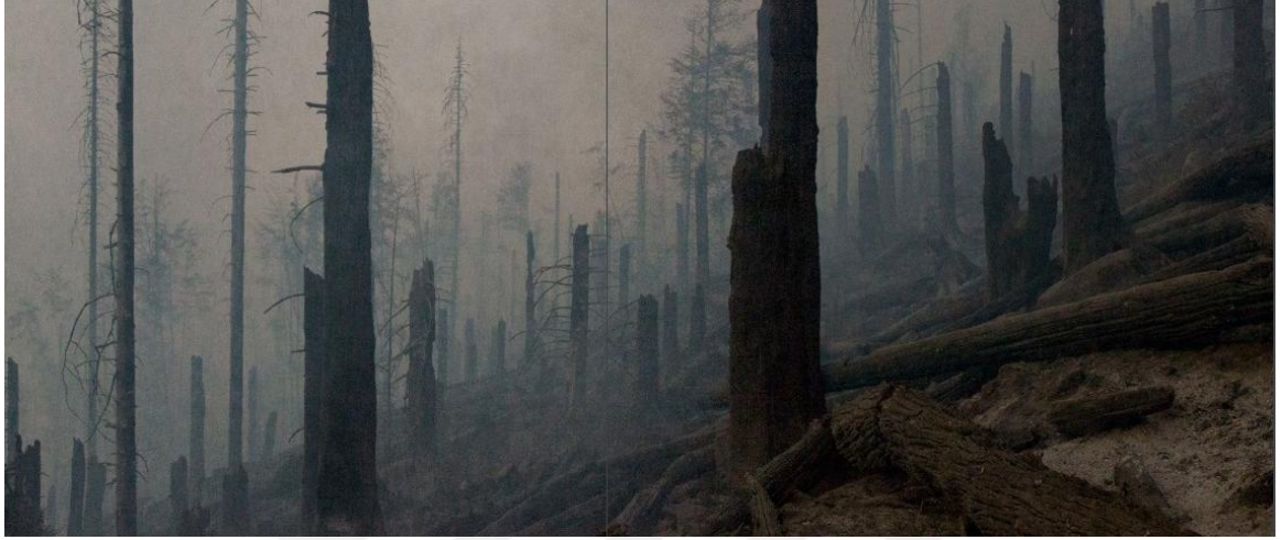
Görsel 25. Youlian Tabakov. Still Alive I / Hala Canlı. 2012 – 2021. (Tekstil Üzerine Mürekkep Püskürtme. 500 x 1190 cm).

tamamen yok edebiliyorsa doğada da moleküller arası zincirleme reaksiyonlar birbirlerini tetiklemektedir. Küçük bir kıvılcımın kocaman bir ormanı yakmaya yettiği gibi doğanın hassas dengesi bozulduğunda kaos ortamı kaçınılmazdır. Bu sadece çevresel bir yıkımı değil, aynı zamanda doğal çevreye ait olan insanı da etkilemektedir.