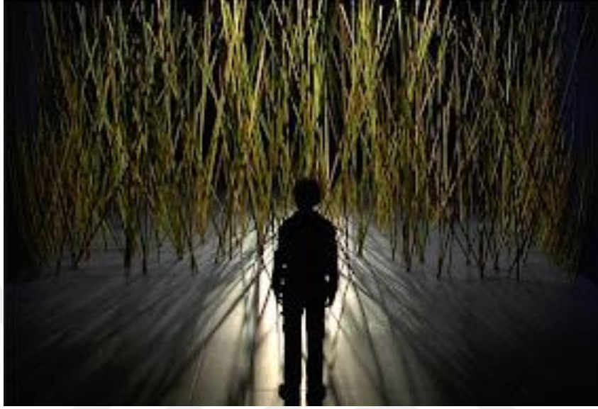
Görsel 3. Alberto Carneiro. O canavial: memória-metamorfose de um corpo ausente/Olmayan Bir Bedenin Bellek Dönüşümü. 1968. (Enstelasyon,sazlık,kurdele). https://bit.ly/3z4rD2F

Sanatçı var olan entropi karşısında hafızanın kırılabilirliği ile doğanın kırılabilirliğini eş tutarak, doğadaki nesnelere hafıza ve entropiye dair işler üretiyor. Bataklıkta tutan sazlıkları bir tür depo gibi görerek beden ve hafıza işlevini onlara aktarıyor ( https://artistasunidos.pt/alberto-carneiro , Erişim: 13.05.2022).