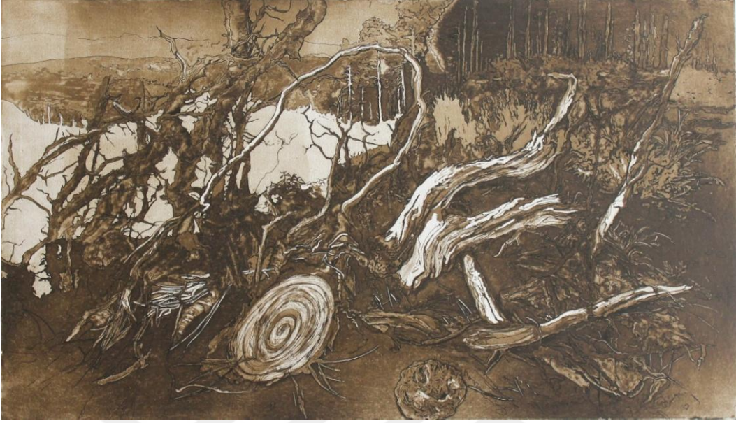
Görsel 8. Şerife Şen Akkaş. Bozulma / Corruption. 2019. (Metal Gravür.39 x 67cm)

sahipliği yapar. Fonksiyon bakımından faydalı olanla düzenli olan yer değiştir. Bu sebeple düzenleme uğruna değerli olanı yok ettiğimiz farkına varılması gerekir.