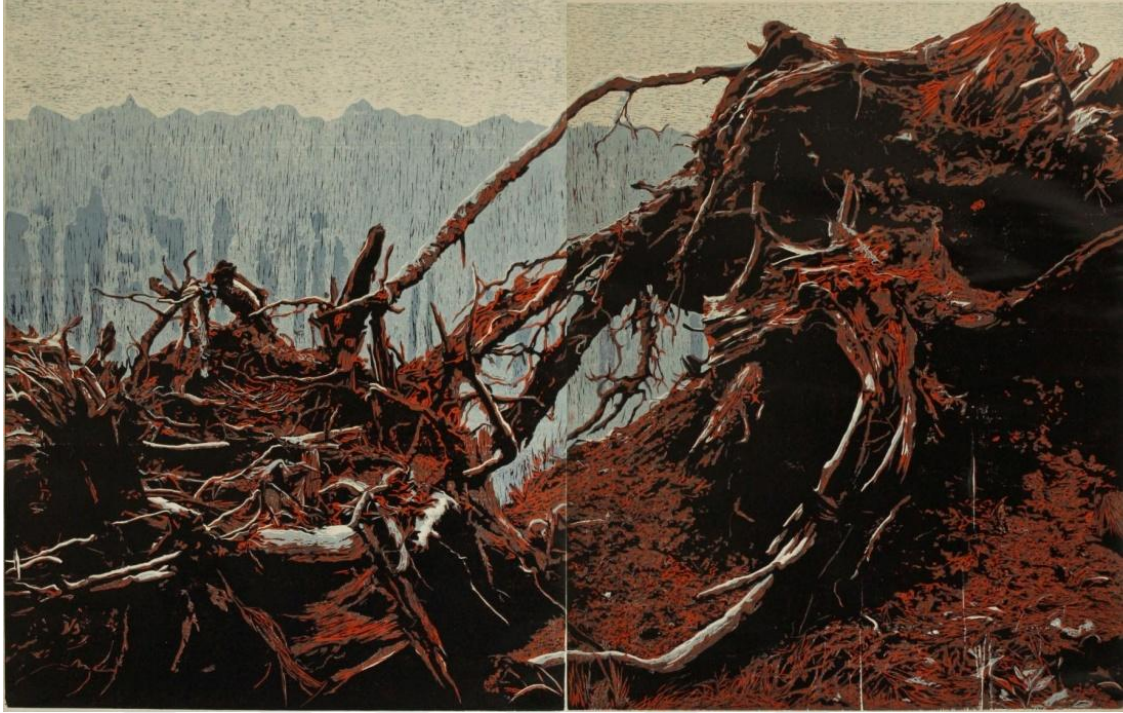
Görsel 28. Şerife Şen Akkaş. Belleğin İşgali / Occupy of Memory. 2019. (Ağaç Baskı, 108 x 162 cm).

Belleğin İşgali / Occupy of Memory isimli (Görsel 28) ağaç baskı çalışmasındaki kompozisyon iki parça halinde tasarlanmıştır. Ağaç köklerinin birbirleri ile olan iletişimine vurgu yapmak amacı ile bu çalışma hem ayrı ayrı, hem de birleştirilerek tek parça halinde sergilenebilmektedir. Yaşanılan anılardan ve izlenimlerden yola çıkılarak oluşturulan bu çalışmada ormanlık bir bölgede baraj yapımı için kesilen ağaçların ardından kalan köklerinin sökülerek yol kenarına atıldığı bir an betimlenmiştir. Ait oldukları alanlarından sökülüp kopartılan bu köklerin alana uzaklığını belirtmek için mavi tonları seçilmiştir. Adeta bir çöp yığını gibi iş makinelerinin topraklarından söktüğü bu kökler, meydan okurcasına tüm ihtişamı ile orada durmaktadır. Bu çalışma her ne kadar anı bellekle ilişkili de olsa kolektif belleği de hatırlatmaktadır.