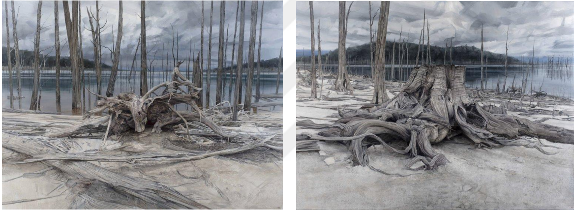
Görsel 15. Nicholas Blowers. Lake Gordon Relic / Gordon Gölü. 2017. (Tuval üzerine yağlıboya 183cmx244cm) https://bit.ly/3RBZSWE

Gördüğü ve deneyimlediği manzaraları resmeden sanatçı, varlığa tanıklık etmekte ilgilendiğini belirtmekte bu şekilde resim kaybolmakta olan bir şeyin anıtı olur. Resimlerini dünyaya görsel bir tepki olarak değerlendirmektedir.