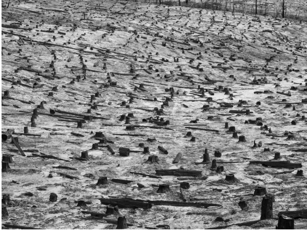
Görsel 22. Paolo Pellegrin. Bondi eyalet ormanında yanmıř aęalar. 2020. Güney Galler Avustralya https://bit.ly/3IFkb1e

Dünyanın önde gelen foto muhabirlerinden birisi olan Paolo Pellegrin, devrimlerden savařlara, tsunamilere kadar birçok felaketi ve çatıřmayı belgelemiřtir. Pellegrin kendi ifadesi ile "bir köprü oluřturması, yüzeyin ötesine geen, yankılanan bir řey söylemek iin" fotoęrafı kullanmak istedięini belirtmektedir. Aynı zamanda dūřündürücü olan, tamamlanmamıř fotoęrafla ilgilenmektedir ( https://www.magnumphotos.com/photographer/paolo-pellegrin , Eriřim: 03.03.2022).