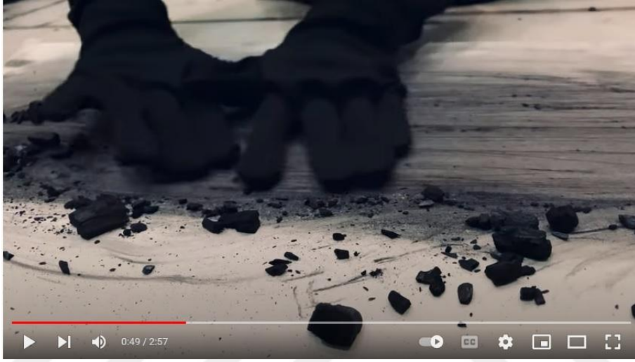
Görsel 26. Gökçe Erhan. 2022. Bir Travma Estetiği adlı Video Çalışmasından Bir Görüntü). https://bit.ly/3DxOHco

Maria Vassileva, sanatçının projesi için yazdığı katalog yazısında, her yanmış ağacın geçmiş ile gelecek arasında bir hafıza alanı olduğunu belirtmiştir. Onlar geride bıraktığımız izlerin sembolüdür. Kendi eylemlerimiz sonucu, yıkıntıların arasında hayatta kalma çabamızdır.