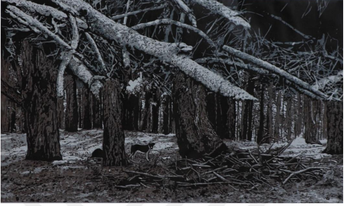
Görsel 27. Şerife Şen Akkaş. Goliçka'da İşgal / Occupy at Goliçka. 2018. (Ağaç Baskı. 75 x 125 cm).

Anton Çehov'un Vişne Bahçesi adlı kitabında yer alan: