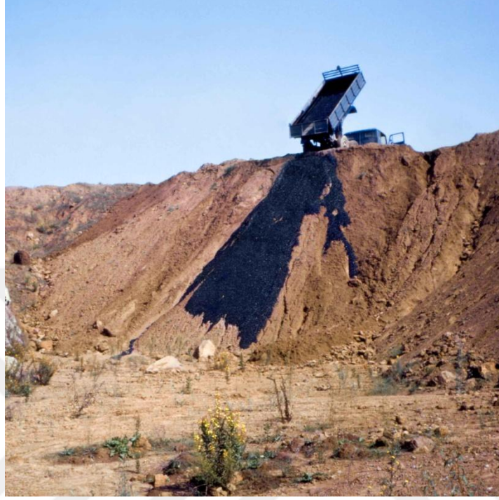
Görsel 1. Robert Smithson. Asphalt Rundown / Asfalt Yıkımı, 1969. (Asfalt, toprak, heykelsi oluşum).

Sanatçının 1969 yılında yaptığı ilk anıtsal iş olan Toprak Yıkımı (Görsel 1) adlı çalışma entropinin önemini gösterir. Bölgedeki yer çekimi ve enerji kaybı bu işin yaratılmasının bir parçası olarak değerlendirilmiştir.