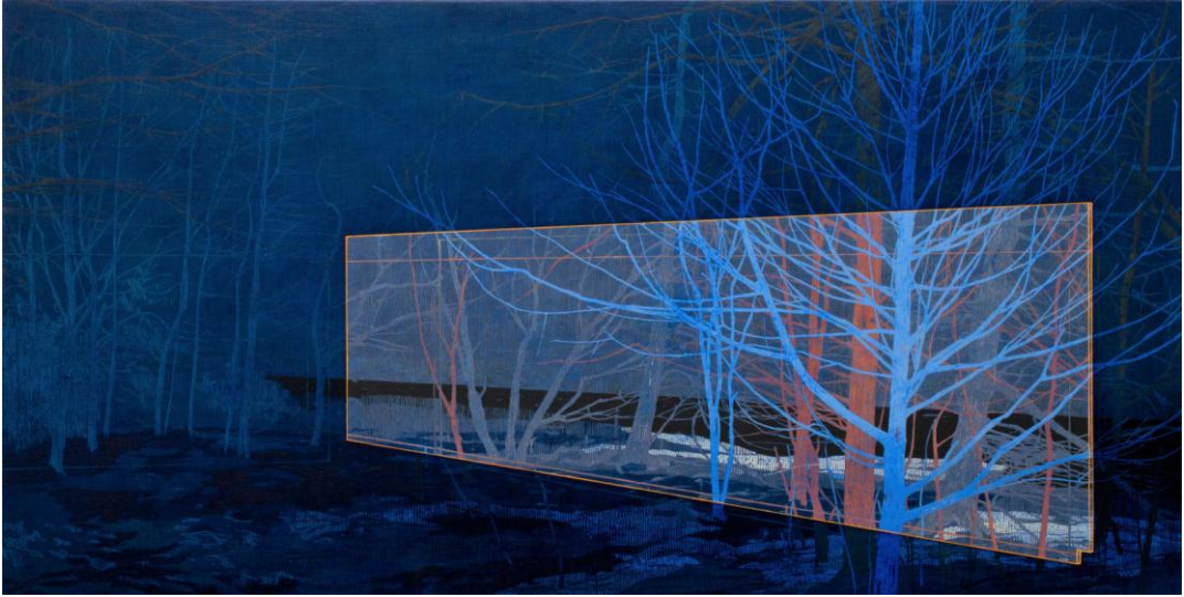
Görsel 33. Andrew Mackenz. Into the wood (velvet deep dusk) / Ağaçlarda, (Panel üzerine yağlı boya, 40 x7 9 cm). https://bit.ly/3z7J9mC

Günümüzde mekâna sıkıştırılmaya çalışılan doğanın izi, sanatçıların eserlerinde daha çok görülmektedir. İnsanın yeni doğası şehirdir. Etrafımızı kuşatan gri beton yapıların ardından seyretmek zorunda kaldığımız doğa insana yabancıdır. Bu anlamda insan kendi yapay gerçekliğini yaratmıştır. Alışveriş merkezlerinin içerisine yerleştirilen doğal veya yapay ağaç ve bitkiler insanın dış dünya ile olan ilişkisini etkilemiştir. İnsanın dış dünya ile ilişkisi, çoğunlukla ekranlar aracılığı ile devam etmektedir. Birey gerçek doğa ile yüzleştğinde orada nasıl durması, davranması gerektiğini bilemez duruma gelmiştir. Bu sebeple doğa ve insan arasındaki ilişki, kentlere hapsolme ile yapaylaşmıştır. Son yıllarda bina artış hızına paralel yeşil alan sayısı da azalma göstermektedir. Kent yaşamının getirisi gereği her şeyi tüketen insan çevresini görmezden gelerek, tahrip ederek doğanın bozulmasına zemin hazırlar. Bugünün insanı, oluşturduğu beton yapıların içerisine hem kendini hem de doğayı hapseder.