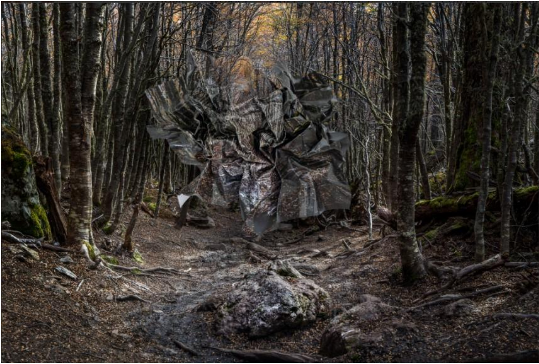
Görsel 4. Ingrid Weyland. Topographies of Fragility IX / Kırılgan Topografyalar 9. 2020. (Birleştirilmiş Fotoğraf. 80 x 50 cm.) https://bit.ly/3ASnHDI

Şiddetli çevresel bozulma yaşayan duygusal sığınağıma bir övgü ve olası bir veda olarak ve basılı görüntünün maddiliği aracılığı ile kendi kişisel manzaralarımı manipüle ederek ve çarpıtarak onların maruz kaldığı şiddeti vurgulamayı planlıyorum (http://www.fractionmagazine.com/ingrid-weyland, Erişim: 08.03.2022).