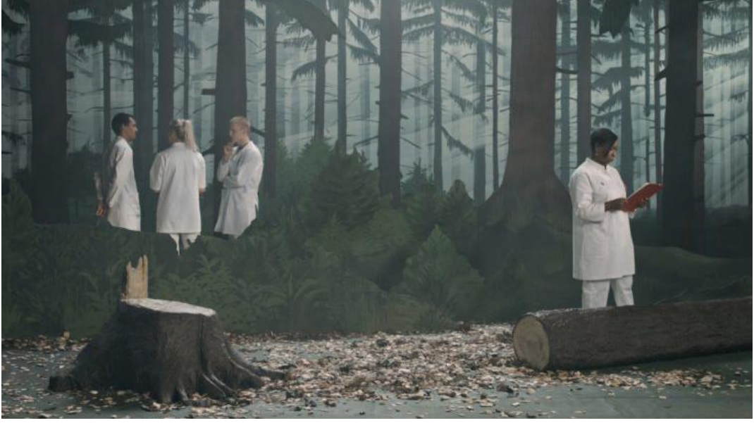
Görsel 13. Ragnar Kjartansson. Figures in Landscapes (Monday) / Manzaradaki Figürler (Pazartesi). 2018. (24 saatlik tek kanallı video). https://bit.ly/3IDIQo1

İnsan doğanın efendisi mi yoksa yok edicisi mi?