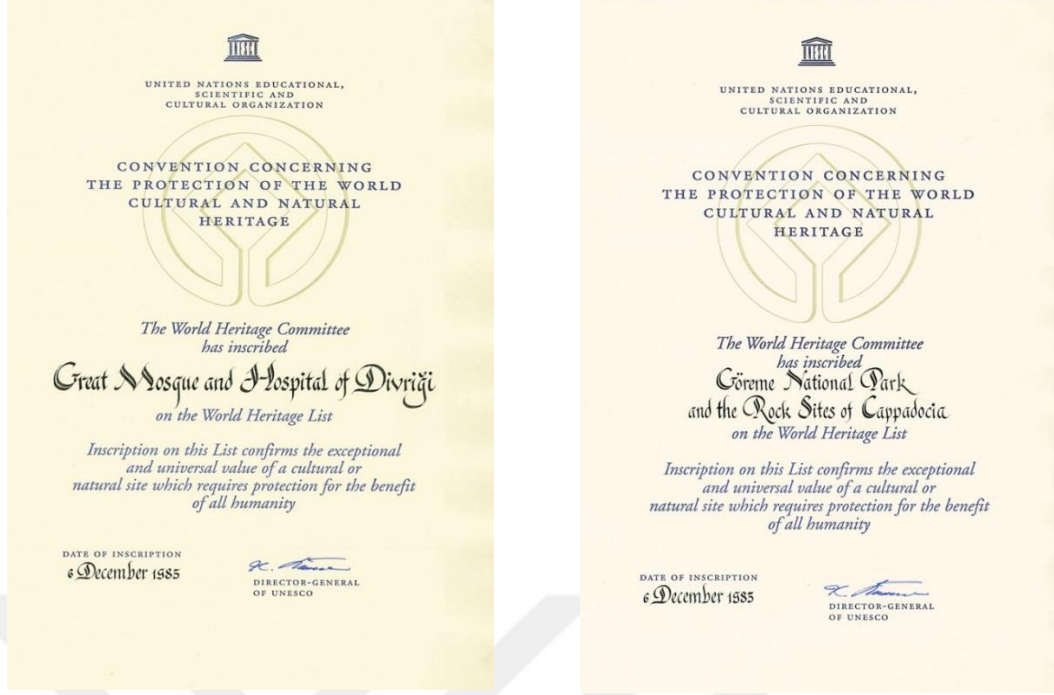
Şekil 2: UNESCO Dünya Mirası Listelerine Giren Eserlerle İlgili Düzenlenen Sertifika Örnekleri

UNESCO Dünya Mirası listelerine Dünya Miras Komitesi'nce dahil edilen bu mirasların yanında bir de bu listede yer alması önerilmekle birlikte adaylık süreçleri henüz tamamlanmamış miraslardan meydana gelen Geçici Liste yer almaktadır. Üye Devletler için Geçici Liste ulusal bir envanter niteliği taşımaktadır; asıl listeye müracaat eden alanlar bu listeden seçilmek suretiyle tespit edilmektedir. UNESCO tarafından belirlenen Dünya Mirası Geçici Listesi'nde taraf devletlerden 178 tanesinin 1740 adet mirası bulunmaktadır. Geçici Listede Türkiye'nin ilki 1994'te sunulmuş olan ve 2020'de güncellenmiş haliyle 77 kültürel, 3 doğal ve 4 karma olmak üzere toplamda 84 kültürel mirası yer almaktadır ((UNESCO Türkiye Millî Komisyonu, 2019).