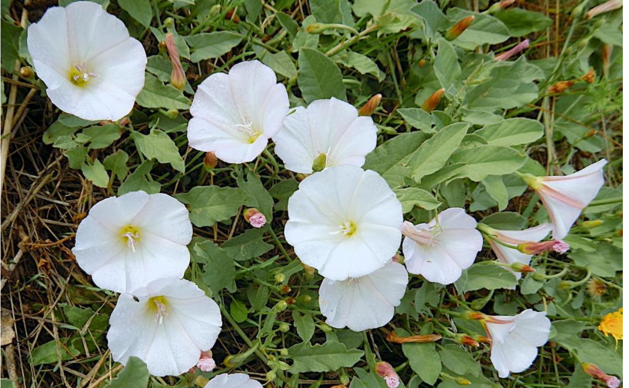
Şekil 4.2. Convolvulus arvensis L. (tarla sarmaşığı)'nın görünümü