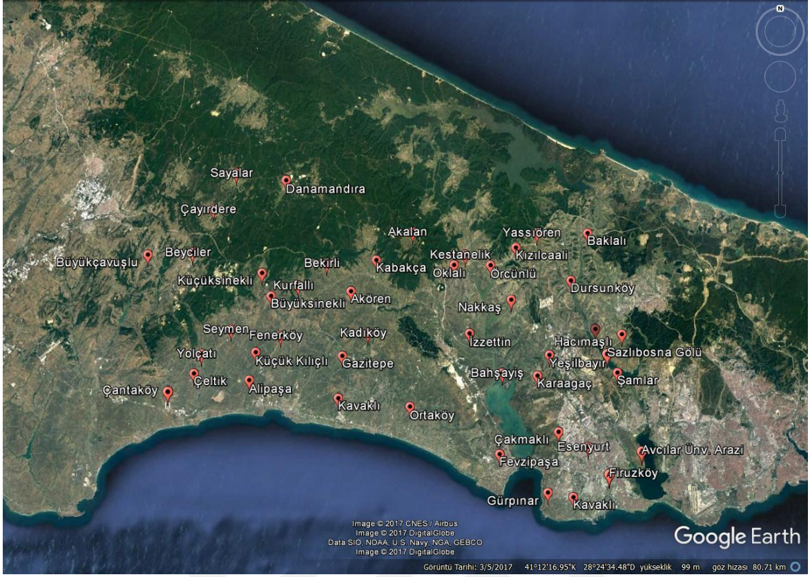
Şekil 3.2. İstanbul İli buğday tarlalarında survey yapılan noktaların Google Earth görüntüsü

Şekil 3.2.'de İstanbul İline bağlı 8 ilçede survey yaptığımız noktalar işaretlenmiştir. İstanbul Arnavutköy'de; Baklalı, Yeşilbayır, Yassıören, Dursunköy, Sazlıbosna, Hacımaşlı mahallerinde, Silivri'de; Akören, Çeltik, Çantaköy, Alipaşa, Küçük Kılıçlı, Ortaköy, Kadıköy, Kavaklı, Gazitepe, Fenerköy, Seymen, Yolçatı, Kurfallı, Bekirli, Küçüksinekli, Büyüksinekli, Beyciler, Çayırdere, Danamandıra, Sayalar, Büyükçavuşlu mahallelerinde, Çatalca'da; Oklalı, Kestanelik, İzzettin, Örcünlü, Nakkaş, Bahşayış, Kızılcaali, Kabakça, Akalan, Fevzipaşa mahallelerinde, Başakşehir'de Şamlar mahallesi, Sazlıbosna Göl Kenarı yakınında, Avcılar'da Firuzköy, İstanbul Üniversitesi arazisinde, Esenyurt'da General Kani Akman Kışlası yakınındaki arazide, Beylikdüzü'nde Kavaklı, Gürpınar mahallelerinde ve Büyükçekmece'de Karaağaç ve Çakmaklı mahallelerinde toplam 53 noktada survey yapılmıştır.