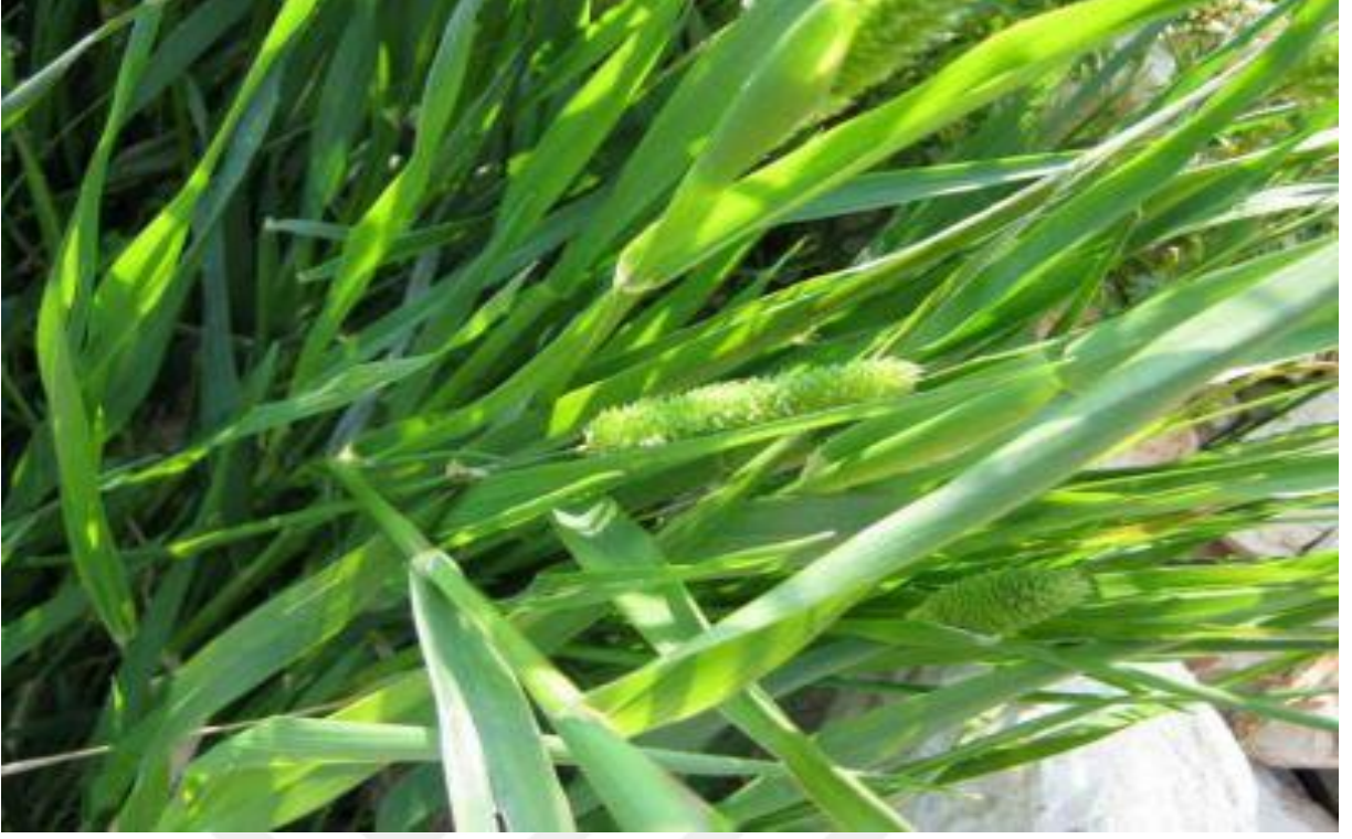
Şekil 4.5. Phalaris spp. (kuş yemi)'nin görünümü