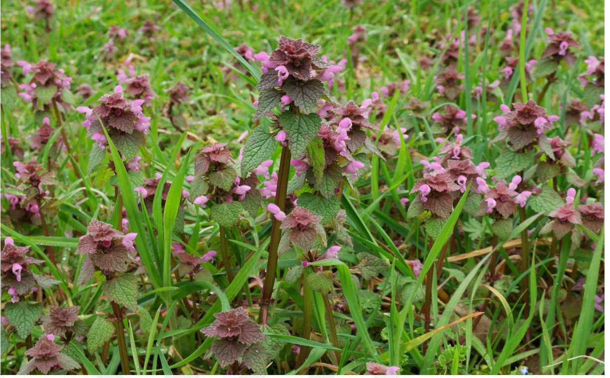
Şekil 4.7. Lamium purpureum L. (eflatun çiçekli ballıbaba)'nin görünümü