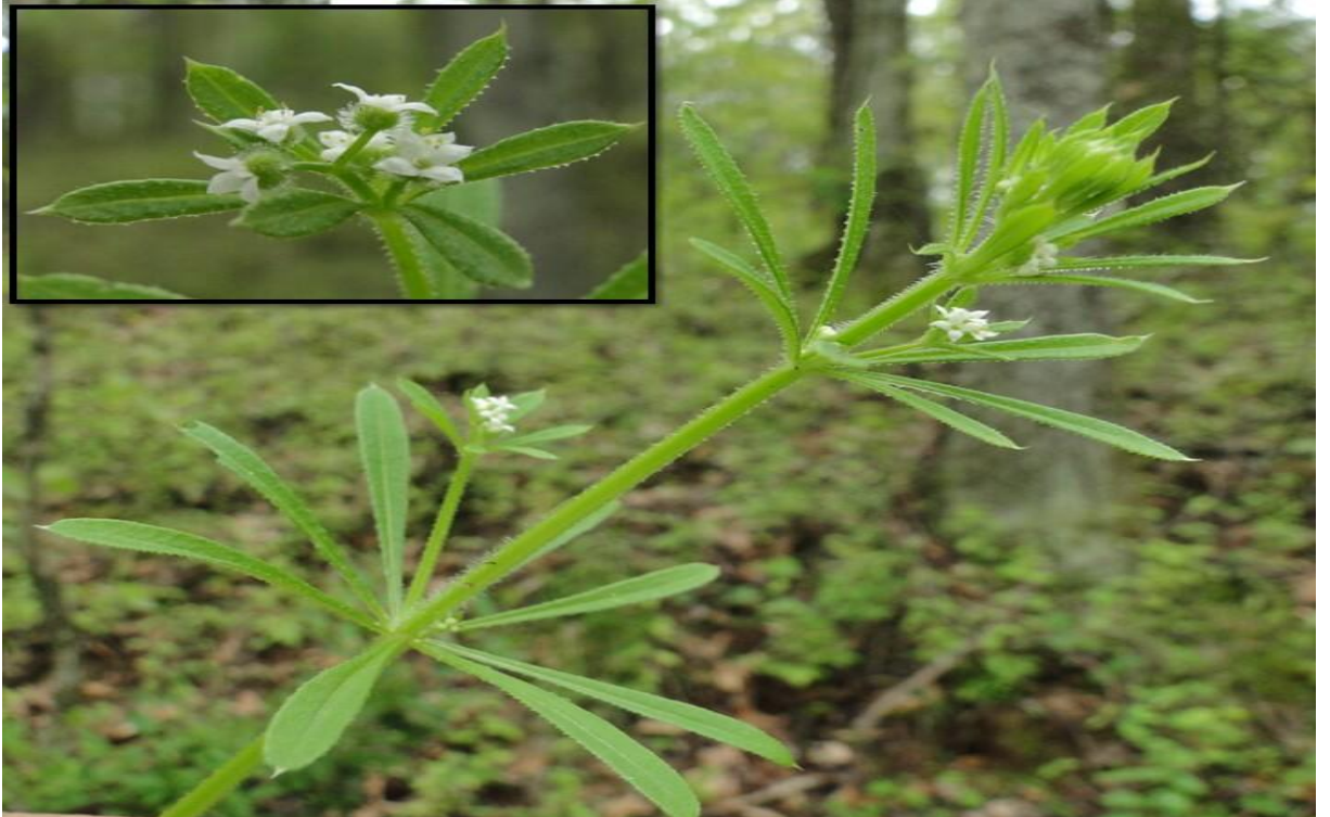
Şekil 4.4. Galium spp. (yapışkan ot)'nin görünümü