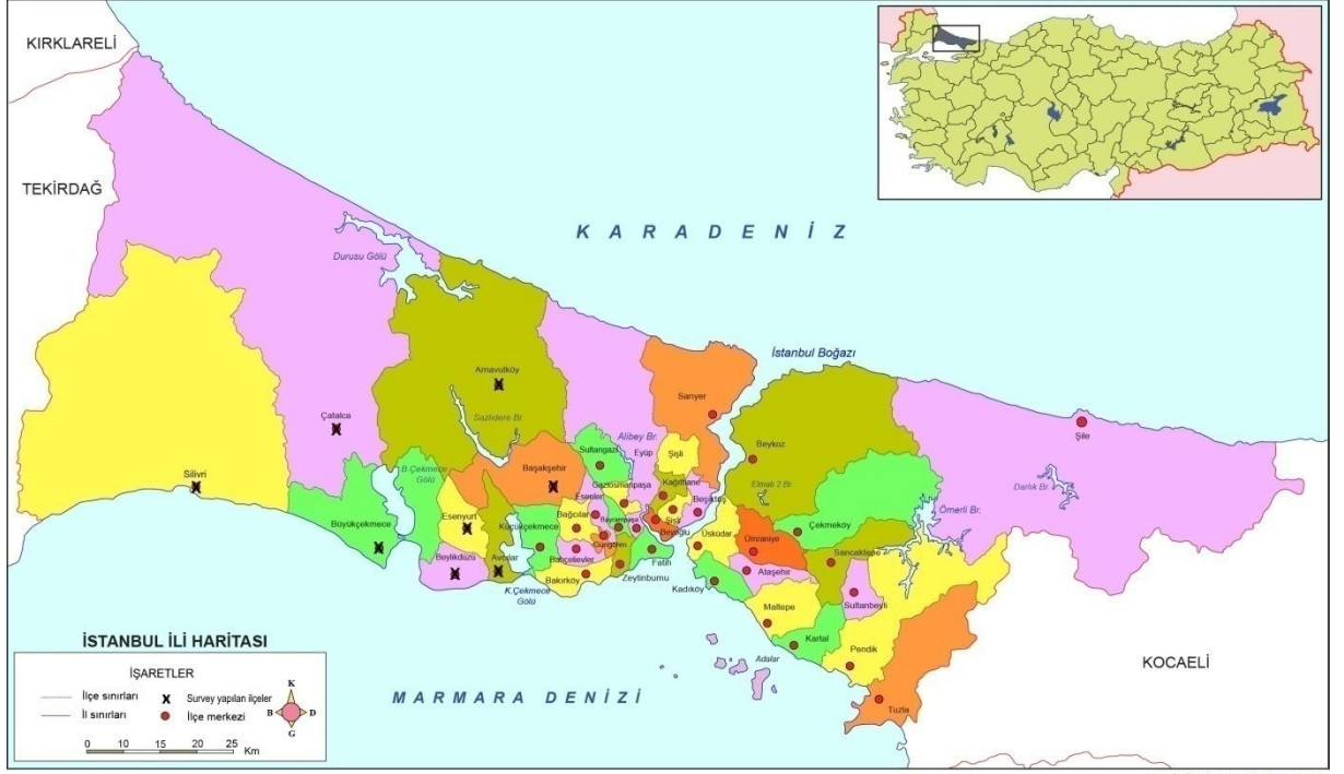
Şekil 3.1. İstanbul İli buğday tarlalarında survey yapılan ilçeler