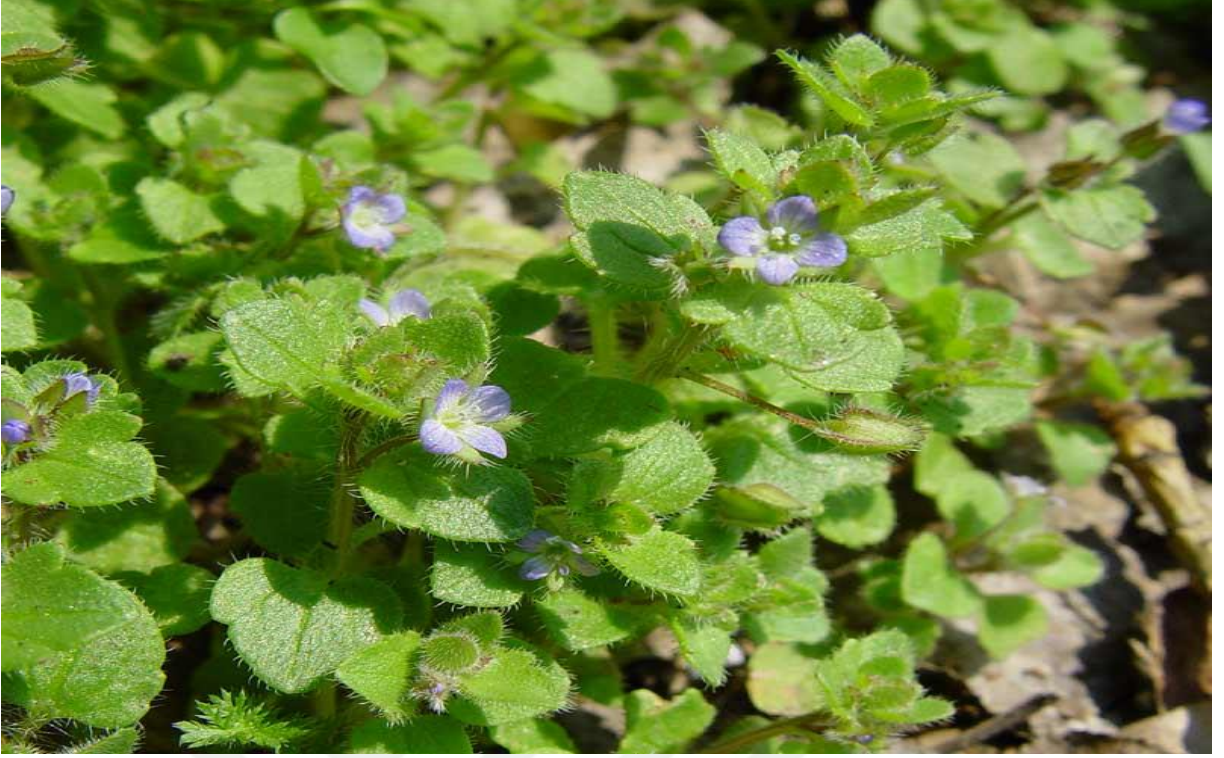
Şekil 4.1. Veronica hederifolia L. (adi yavşan otu)'nın görünümü