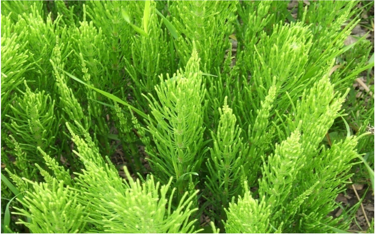
Şekil 4.10. Equestium arvense L. (tarla at kuyruğu)'nin görünümü