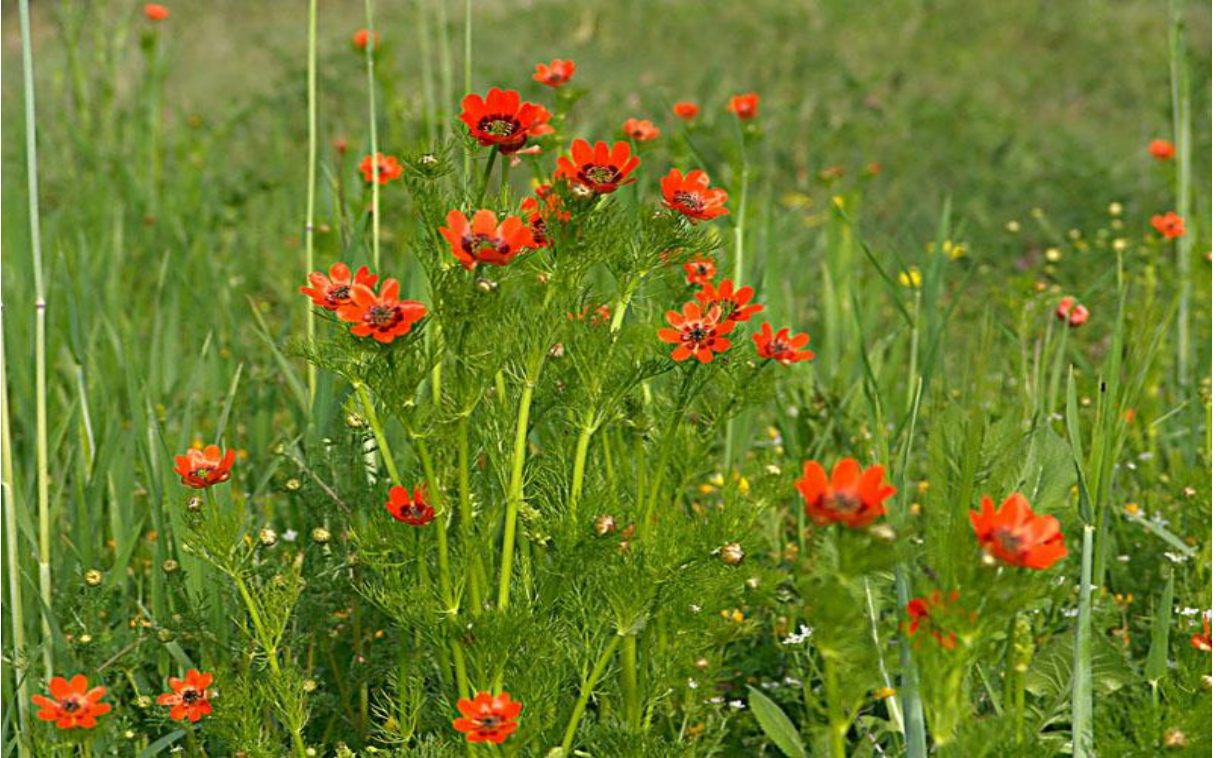
Şekil 4.6. Adonis flammea JACQ. (kan damlası)'nın görünümü