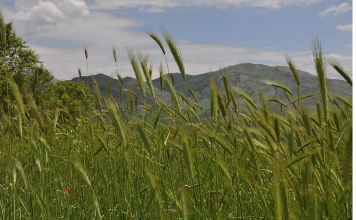
Şekil 4.8. Dasyphyrum villosum L. (kızıl ev)'in görünümü