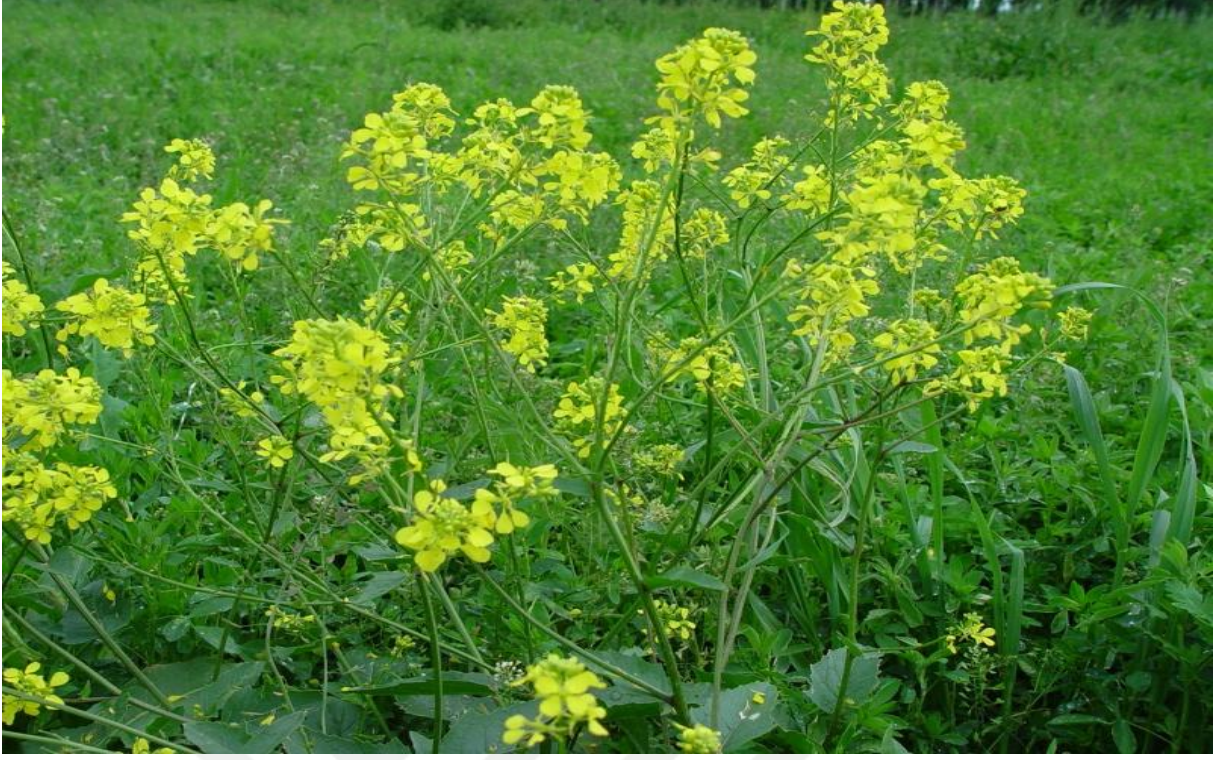
Şekil 4.3. Sinapis arvensis L. (yabani hardal) 'in görünümü