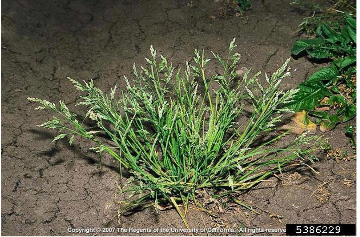
Şekil 4.9. Poa annua L. (tavşan bıyığı)'nin görünümü