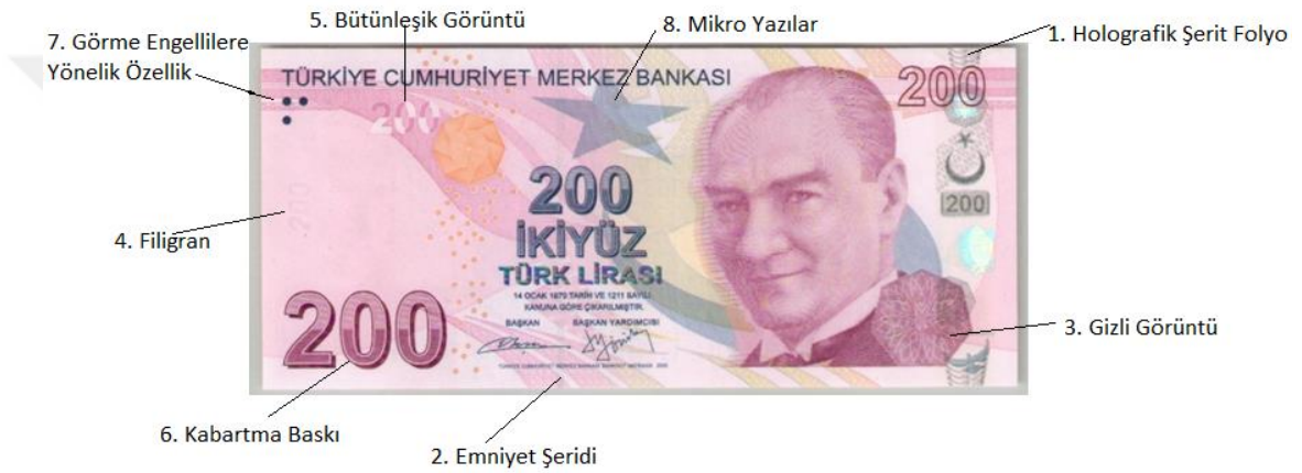
Şekil 1. 200 TL Örneğinde Banknot Üzerinde Yer Alan Bazı Güvenlik Önlemleri

Bu konuda, her ülke açısından farklı olmakla beraber, dolaşımda bulunan paralar, tecrübesiz kişilerin aldatılmalarının önüne geçmek amacıyla, gerçek paranın sahte paradan ayırt etmesini kolaylaştırıcı ya da sahtesinin üretilmesini zorlaştırıcı bir takım güvenlik özelliklerini bünyelerinde barındırmaktadır. Sahte para ile karşılaşan ferdi, bu güvenlik özellikleri yardımıyla aldatılmasının önüne geçilmek istenmiştir. Buna göre özellikle, bir banknotun sahte olup olmadığını anlamak için, gerçek paraların taşıdığı özellikleri bilmek ve buna göre karşılaştırma yapmak gereklidir. Karşılaşılan sahte banknotlarda, güvenlik özelliklerinden birkaçının birlikte kontrol edilmesi durumunda, sahte banknotların diğerlerinden kolaylıkla ayırt edilebileceği öngörülmektedir.