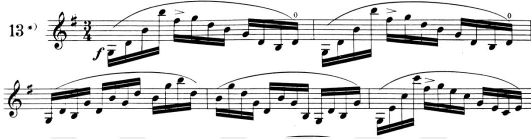
Şekil 7. Etüt no 13'ten legato tekniği içeren bir kesit

Konumlar: 1.ve 3. Pozisyonlarda kalıcı ve geçişli çalma