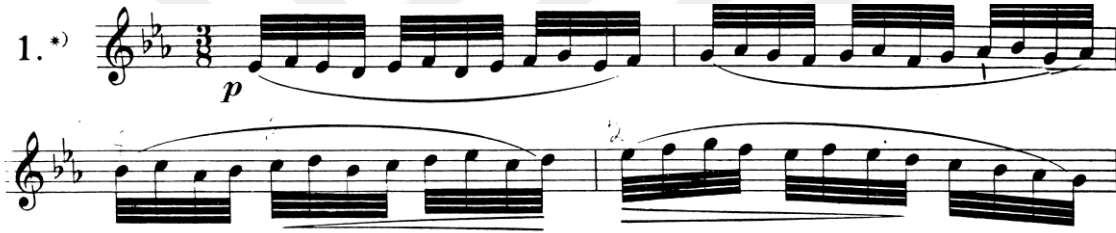
Şekil 1. Etüdü no 1 'den legato tekniği içeren bir kesit