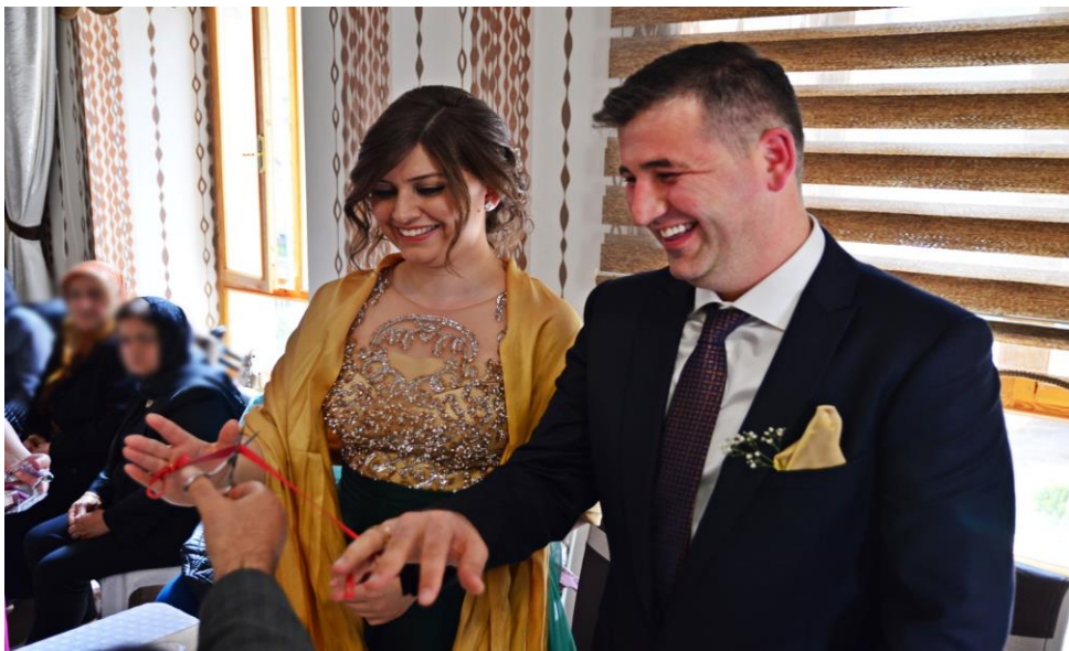
Fotoğraf 4: Niğde Merkez’de salonda nişan yüzüklerinin takılma merasimi