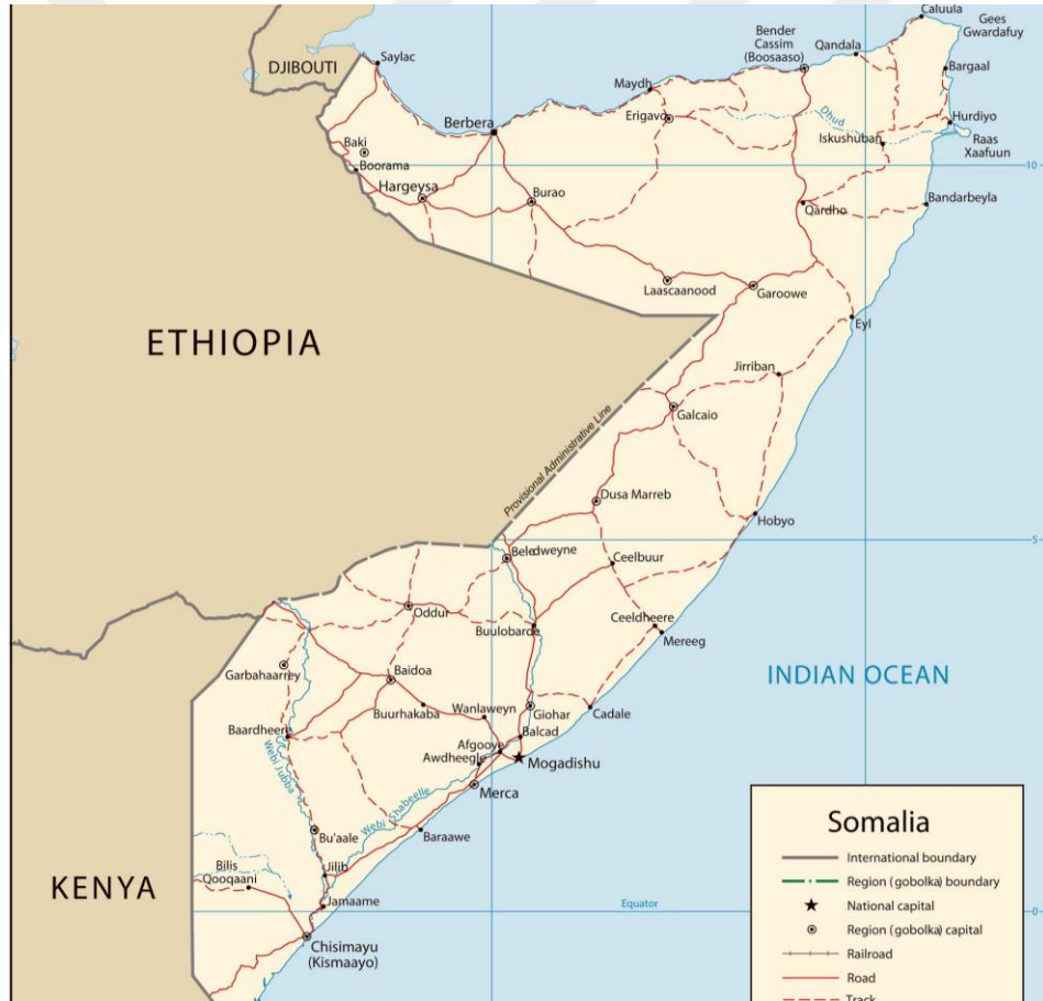
Şekil 1.1: Somali'nin Coğrafi Konumu