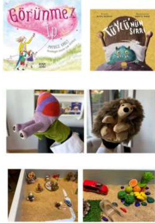
Şekil 1: Kullanılan materyaller