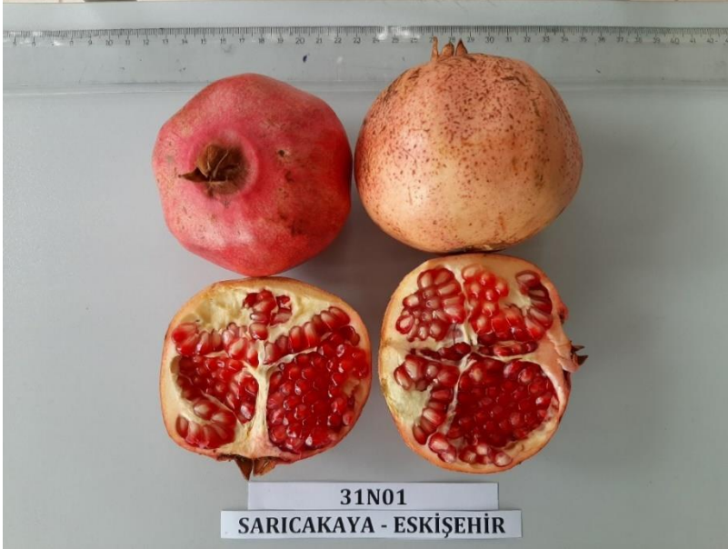
Şekil 3.6. Araştırmada kullanılan 31N01 çeşidinin meyvesi

31N01: Akdeniz bölgesinden selekte edilmiş bir çeşittir.