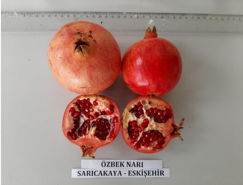
Şekil 3.2. Araştırmada kullanılan Özbek çeşidinin meyve görünümü

Wonderful: Kaliforniya'da en fazla yetiştirilen ticari standart çeşittir. İri, parlak, koyu kırmızı-mor renkli meyvelere sahiptir. Daneleri koyu kırmızı, küçük, meyve suyu randımanı yüksek, tohumu orta sert ve orta kalınlıkta kabuğa sahiptir. Mayhoş bir tada sahiptir. Ağacın gelişimi kuvvetli ve bol verimlidir.