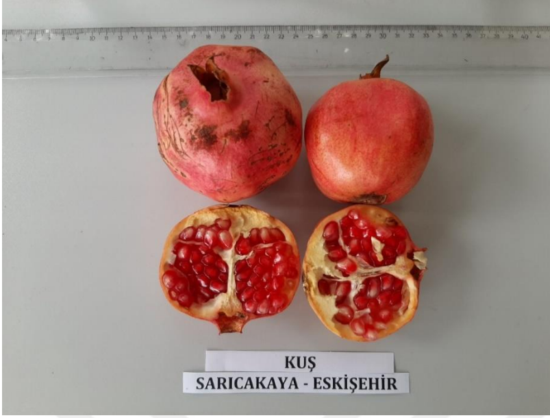
Şekil 3.4. Araştırmada kullanılan Kuş narı çeşidinin meyvesi

Onurnar2: Batı Akdeniz Araştırma Enstitüsünde ıslah edilmiş bir çeşittir.