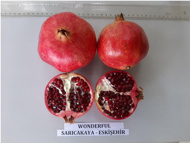
Şekil 3.3. Araştırmada kullanılan Wonderful çeşidinin meyve görünümü

Wonderful: Kaliforniya'da en fazla yetiştirilen ticari standart çeşittir. İri, parlak, koyu kırmızı-mor renkli meyvelere sahiptir. Daneleri koyu kırmızı, küçük, meyve suyu randımanı yüksek, tohumu orta sert ve orta kalınlıkta kabuğa sahiptir. Mayhoş bir tada sahiptir. Ağacın gelişimi kuvvetli ve bol verimlidir.