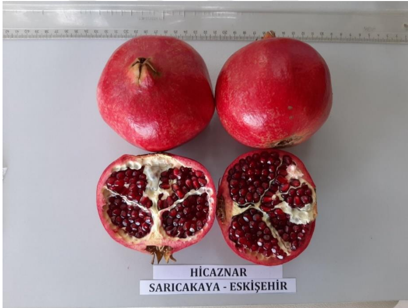
Şekil 3.1. Araştırmada kullanılan Hicaznar çeşidinin meyve görünümü

Hicaznar: Akdeniz Bögesinden selekte edilmiş bir çeşittir. Ülkemiz için başlıca çeşittir.