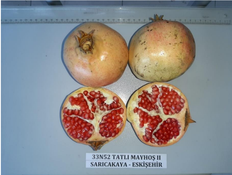
Şekil 3.4. Araştırmada kullanılan 33N52 çeşidinin meyvesi

33N52: Akdeniz bölgesinden selekte edilmiş sofralık bir çeşittir.