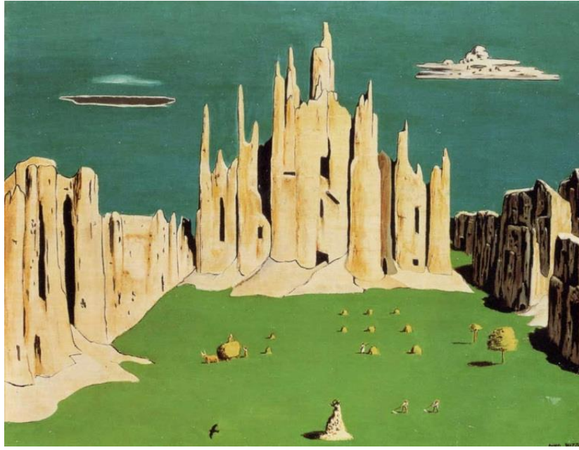
1. Dino Buzzati, La Piazza del Duomo di Milano (Milano Duomo Meydanı).