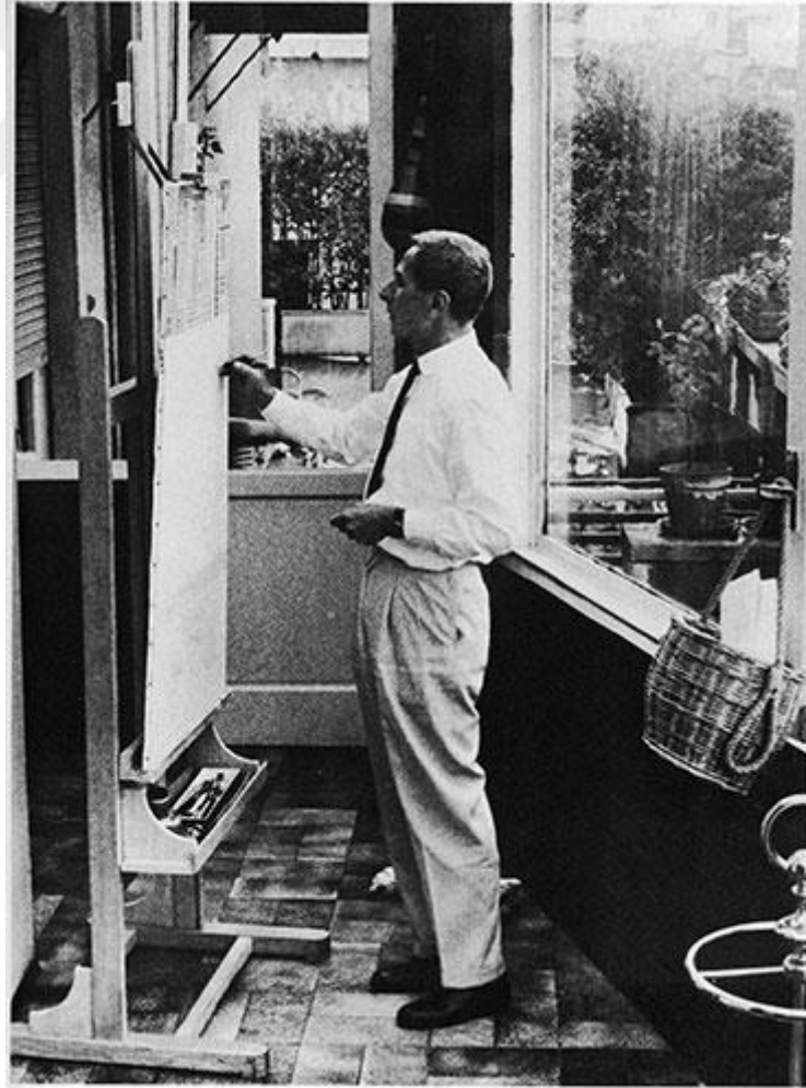
4. Dino Buzzati, resim yaparken.