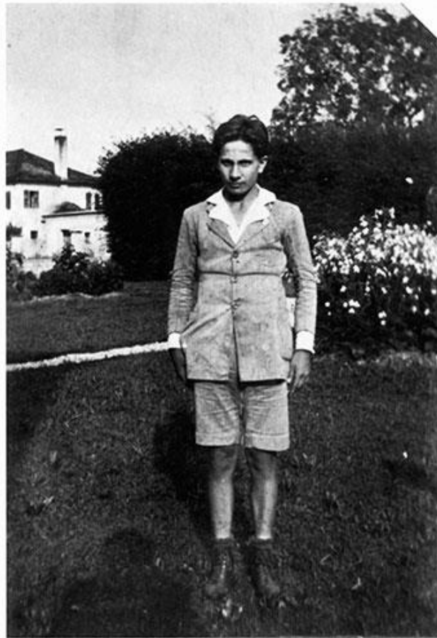
2. Dino Buzzati, San Pellegrino'daki evinin bahçesinde.